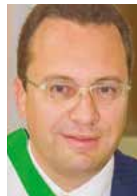
Davide Ferrari Sindaco di Galliate