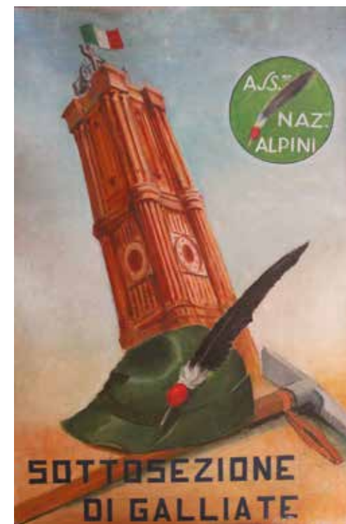
Copertina del libro