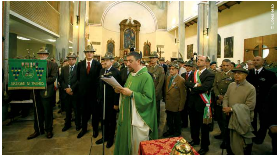
La cerimonia dell'offerta all'altare della Madonna del Don.