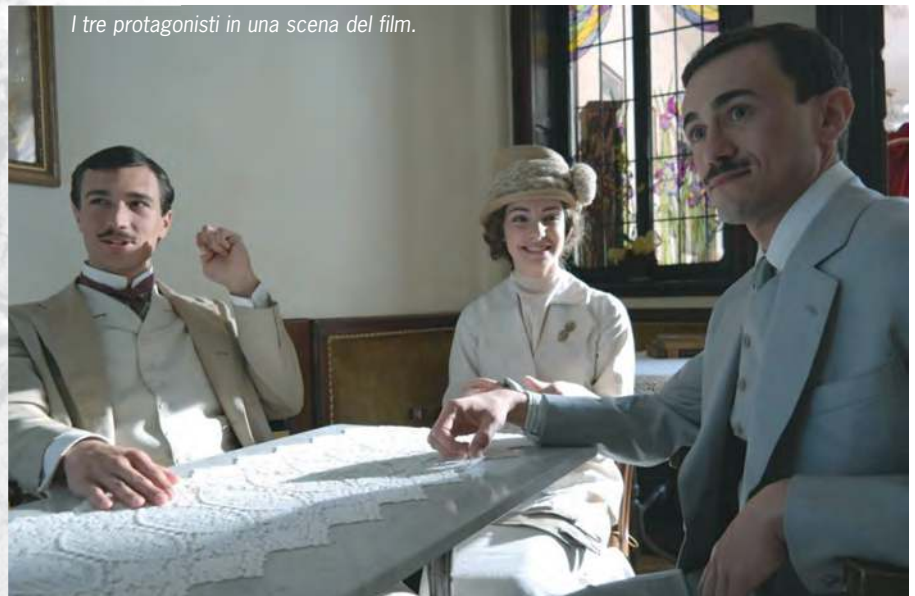
I tre protagonisti in una scena del film.

L e città sono in fermento. I soldati si muovono faticosamente per le strade fangose scansando gli animali da soma e i carri stracolmi di vettovagliamenti. In periferia una lunga colonna di alpini e muli è affiancata dagli autocarri diretti frettolosamente al fronte.