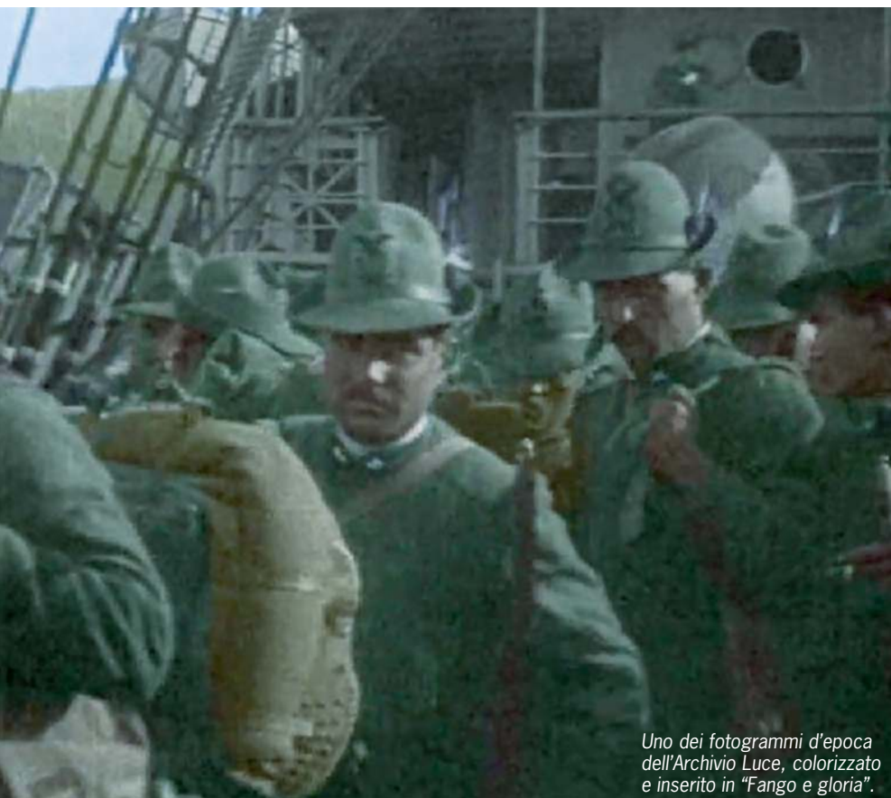
Uno dei fotogrammi d'epoca dell'Archivio Luce, colorizzato e inserito in "Fango e gloria".