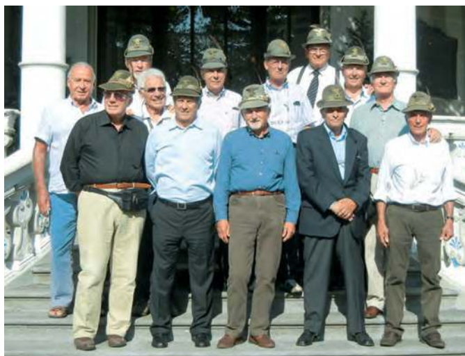
Allievi del 30° corso AUC di nuovo insieme ad Aosta a 50 anni dalla naja. Eccoli immortalati davanti al castello del generale Cantore.