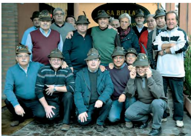
Alcuni alpini della 20ª e 76ª cp. del btg. Cividale di stanza alla caserma Zucchi di Scuse (Chiusaforte), nel 1970.