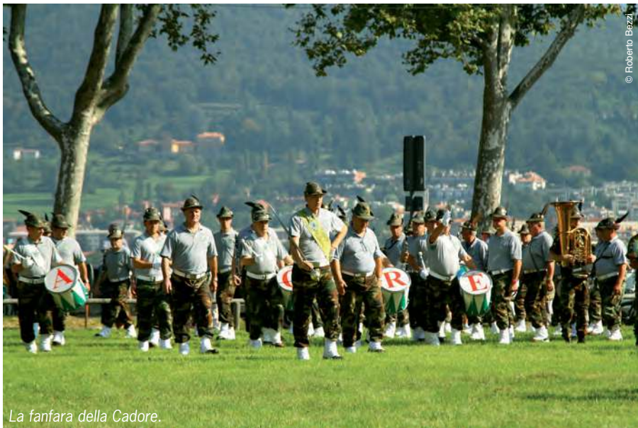
La fanfara della Cadore.

La sera il concerto nel prestigioso teatro Donizetti dove i cinque complessi si sono esibiti in pezzi d'opera, musiche alpine e brani folcloristici tutti sottolineati dall'applauso del pubblico che ha riempito la sala e il porticato dove era stato allestito un maxischermo per la ripresa di TV-Bergamo. Meritano una citazione i direttori, ben collaudati da quattro edizioni: Ghirardello per la Taurinense,