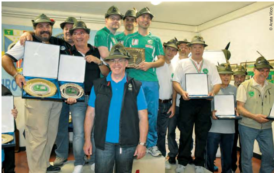
Il podio del trofeo "Bertagnolli".

Sotto: la cerimonia di sabato al monumento dell'Alpino nella bufera di Treviso.