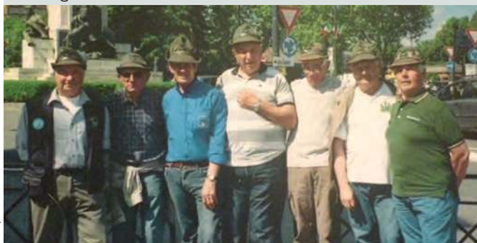
Alcuni commilitoni che 50 anni fa erano alla caserma Italia di Tarvisio, 22ª artiglieria.