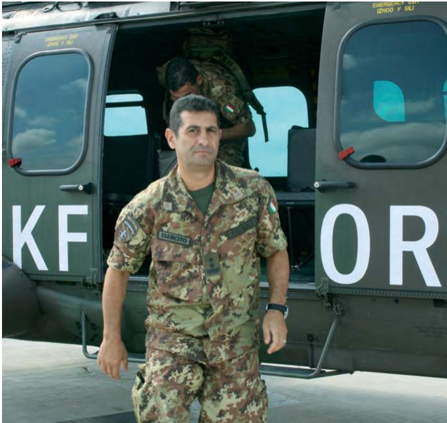
Il gen. Paolo Francesco Figliuolo mentre scende da un elicottero della KFOR.

A tre lustri dal grave conflitto nei Balcani il Kosovo è una terra di mezzo, dal futuro incerto e dallo status internazionale non ben definito. Nel 2008 la proclamazione d'indipendenza, non riconosciuta da molti Stati - alcuni anche europei - ha riacutizzato le tensioni con la Serbia che rivendica il territorio. L'Unione Europea ha quindi rafforzato l'impegno internazionale con EULEX (acronimo di European Union Rule of Law Mission) per agevolare la costituzione di uno stato di diritto, cercando di aumentare la sicurezza interna, amministrare la giustizia e il controllo doganale. Il faticoso cammino verso la transizione non può prescindere dall'operato della KFOR (Kosovo force) che dallo scorso settembre è comandata dal generale di Divisione, alpino, Francesco Paolo Figliuolo.