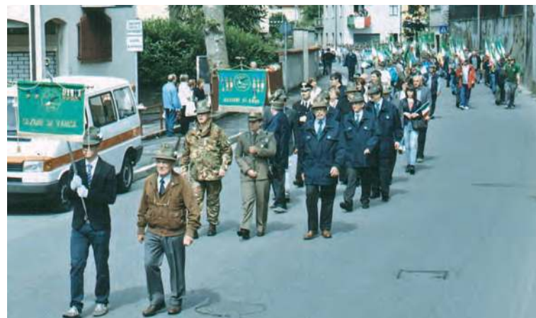
Vessilli e gagliardetti in sfilata ad Albese con Cassano.