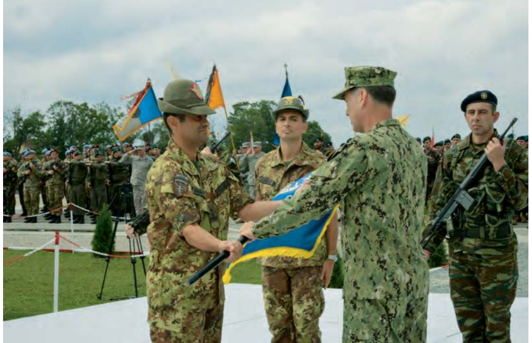
Il comandante del Nato Allied Joint Force Command di Napoli, ammiraglio Mark E. Ferguson III, consegna la bandiera con le insegne della KFOR al gen. Figliuolo, durante la cerimonia di insediamento, a Pristina.

Le due comunità, senza voler dimenticare la presenza di minoranze appartenenti ad altre etnie, convivono in una pace relativa. La situazione è fragile e le divisioni restano. Forti tensioni si sono verificate proprio sul fiume Ibar, in prossimità del ponte di "Austerlitz" che collega le due parti della città di Mitrovica, rispettivamente a maggioranza albanese e serba. Il rischio di scontri è stato comunque sventato grazie all'interposizione della Kosovo Police e di EULEX, missione dell'Unione Europea per l'im-