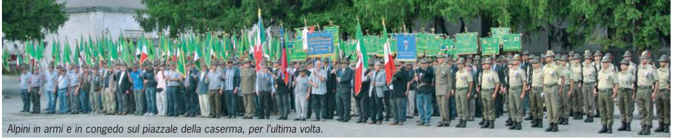
Alpini in armi e in congedo sul piazzale della caserma, per l'ultima volta.