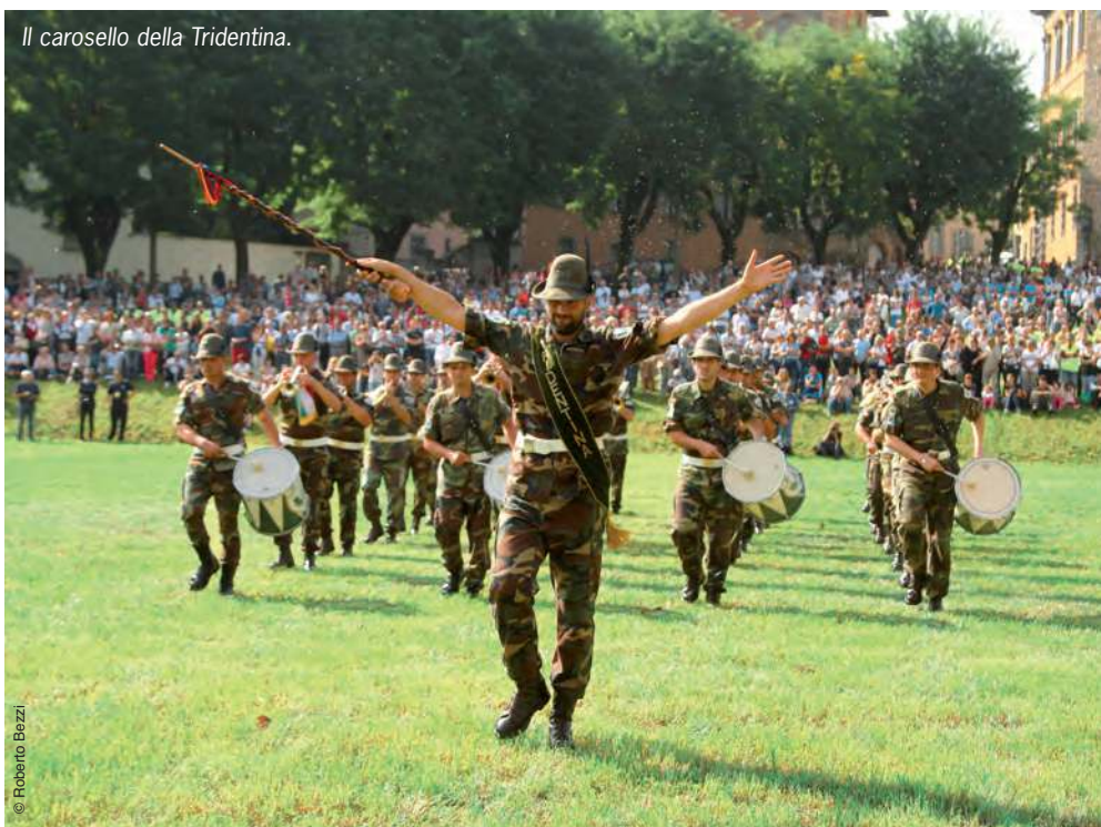
Il carosello della Tridentina.

Domenica mattina, lungo cinque percorsi diversi nella splendida città alta, le fanfare si sono concentrate nel Campo della Fara per un altro breve concerto all'aperto alla presenza di un migliaio di spettatori, all'insegna di un "raduno per brigata degli alpini bergamaschi" voluto dal comitato organizzatore sezionale per far rivivere i tempi trascorsi al reparto da tanti alpini della città e della provincia. Ovviamente una selva di gagliardetti