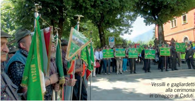
Vessilli e gagliardetti alla cerimonia in omaggio ai Caduti.