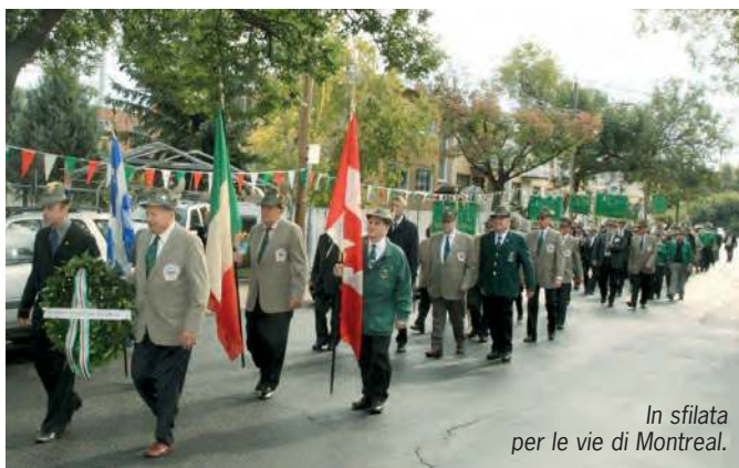
In sfilata per le vie di Montreal.

U na giornata memorabile quella del 60° della sezione di Montreal. Duecento persone, tra cui diverse delegazioni dall'Italia e dalle altre Sezioni canadesi hanno sfilato per le vie cittadine e si sono date appuntamento alla chiesa dedicata alla Madonna di Pompei dove è stata