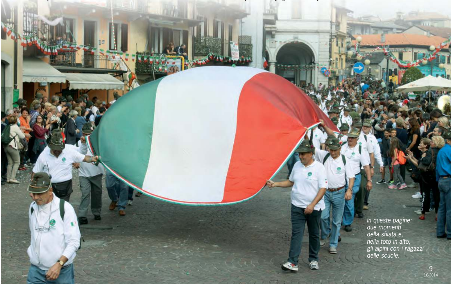
In queste pagine: due momenti della sfilata e, nella foto in alto, gli alpini con i ragazzi delle scuole.