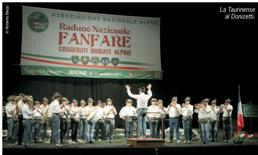
La Taurinense al Donizetti.