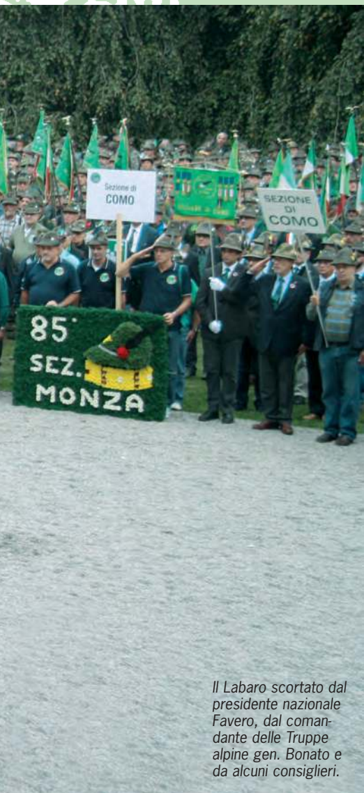
Il Labaro scortato dal presidente nazionale Favero, dal comandante delle Truppe alpine gen. Bonato e da alcuni consiglieri.