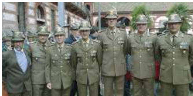
Raduno degli artiglieri del gruppo Aosta alla caserma Mario Musso di Saluzzo.