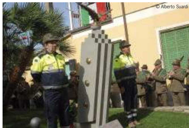
Il monumento ai Caduti alpini.