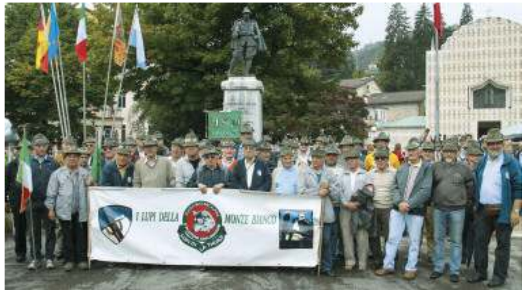
I lupi della Monte Bianco della Scuola Militare Alpina, plotone esploratori, di nuovo insieme a Recoaro, al loro 17° raduno. Il prossimo sarà a Formazza.