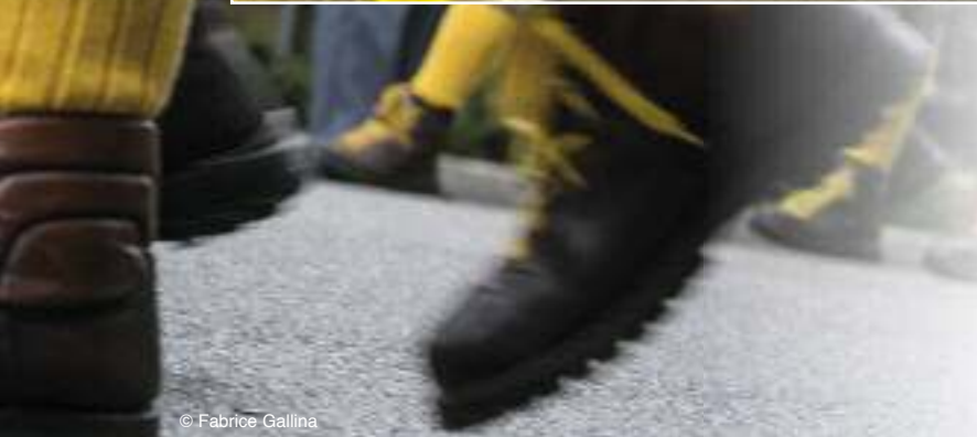
Sfila la sezione di Pordenone e... scrosciano gli applausi!