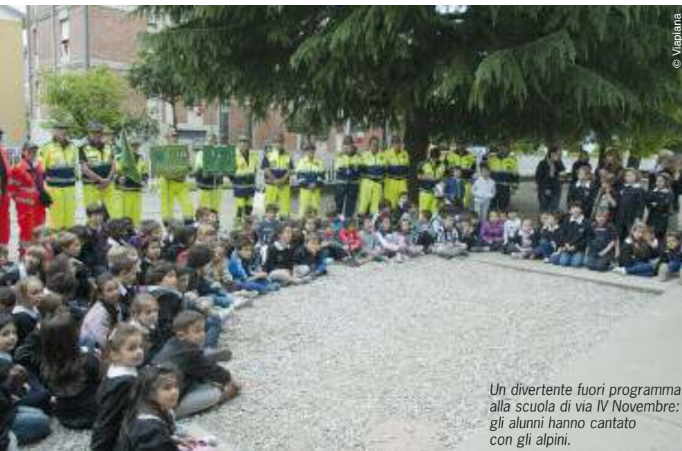
Un divertente fuori programma alla scuola di via IV Novembre: gli alunni hanno cantato con gli alpini.

Ricordiamo a tal proposito che il caschetto è stato scelto, per le sue caratteristiche costruttive conformi alle disposizioni legislative vigenti. Non compromette e non limita l'attività dei volontari, né crea disagi come sudorazione o minore visibilità. (g.b.)