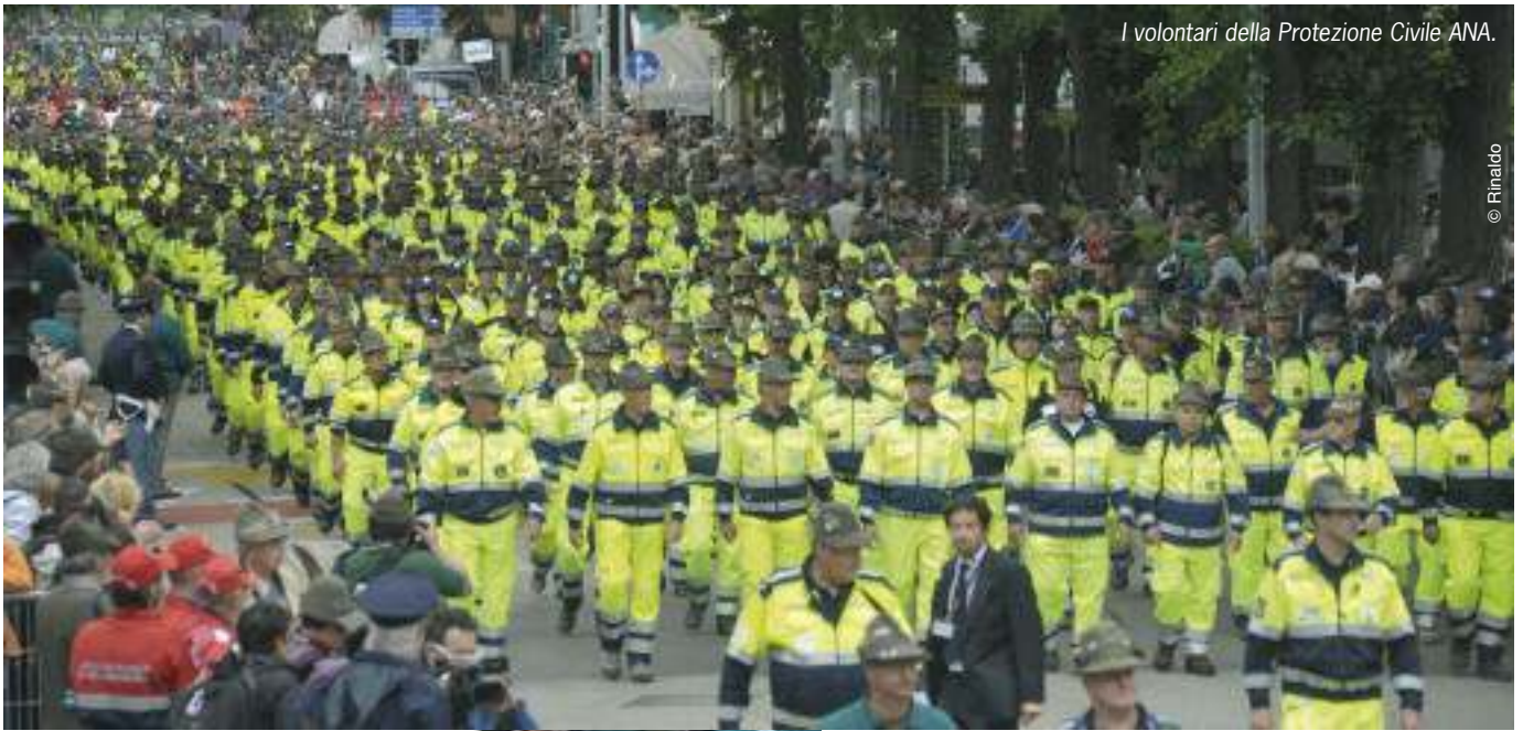
I volontari della Protezione Civile ANA.