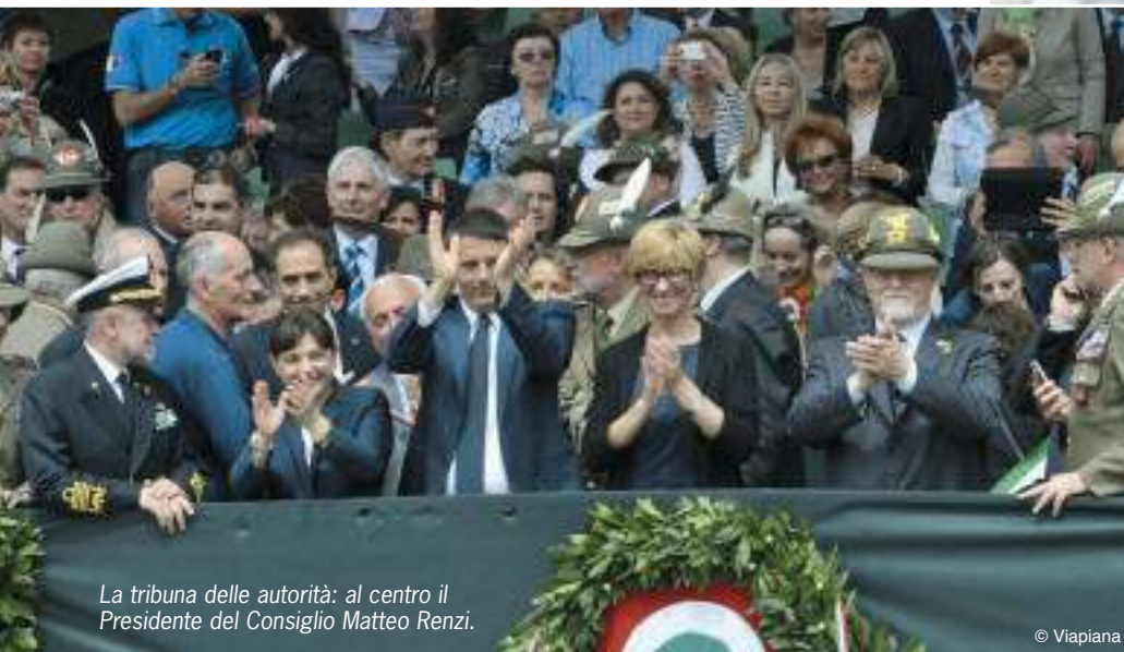
La tribuna delle autorità: al centro il Presidente del Consiglio Matteo Renzi.