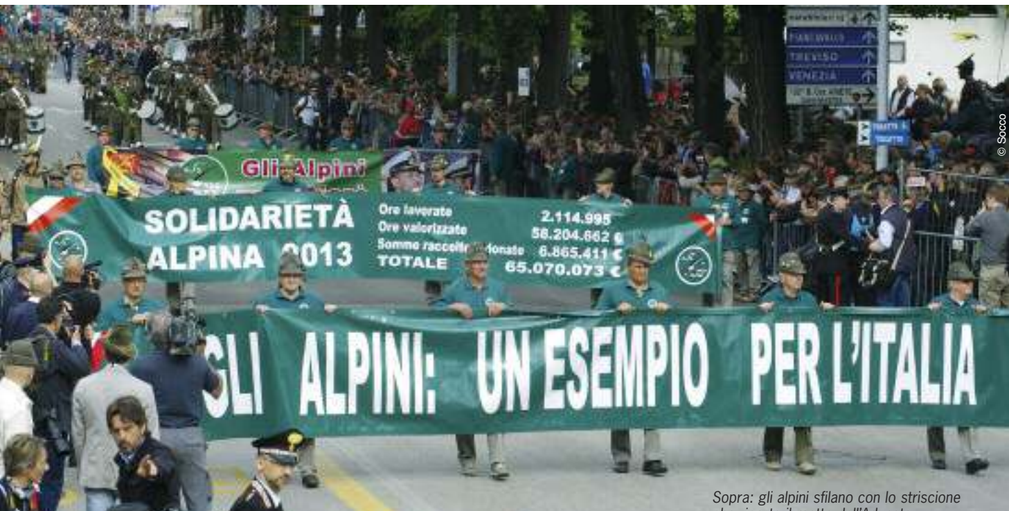
Sopra: gli alpini sfilano con lo striscione che riporta il motto dell'Adunata. A sinistra: il Labaro scortato dal vice presidente del Senato Gasparri, dai vertici dell'ANA e dai gen. Graziano e Primicerj.