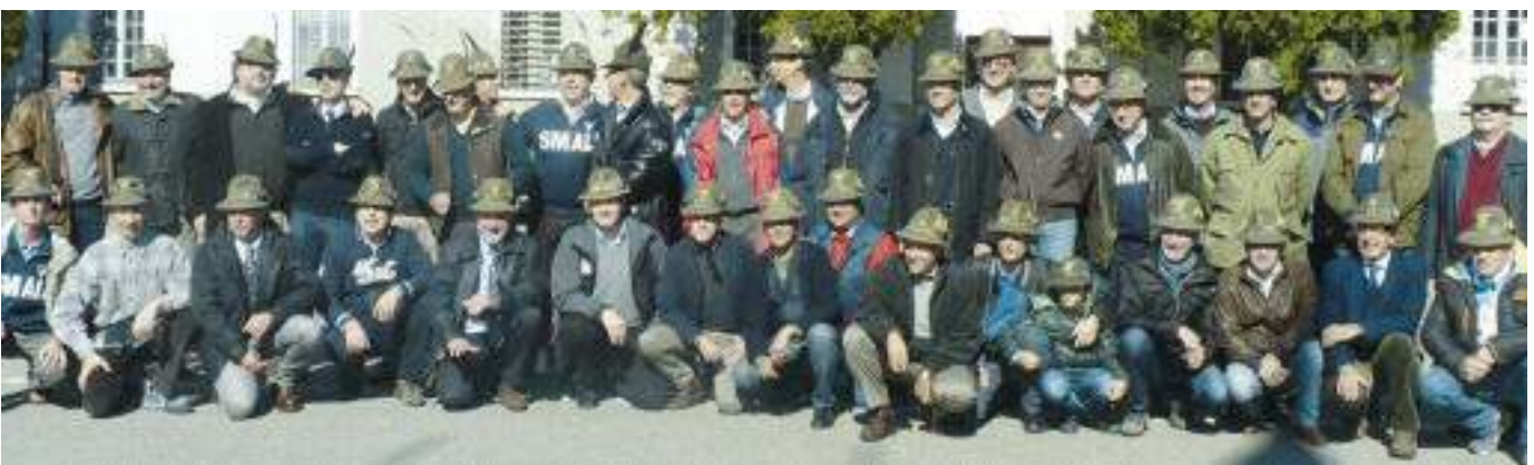
Raduno del 113° AUC a 30 anni dal corso alla SMALP di Aosta. Comandante della 2ª cp. AUC era l'allora capitano Claudio Graziano, ora Capo di Stato Maggiore dell'Esercito.