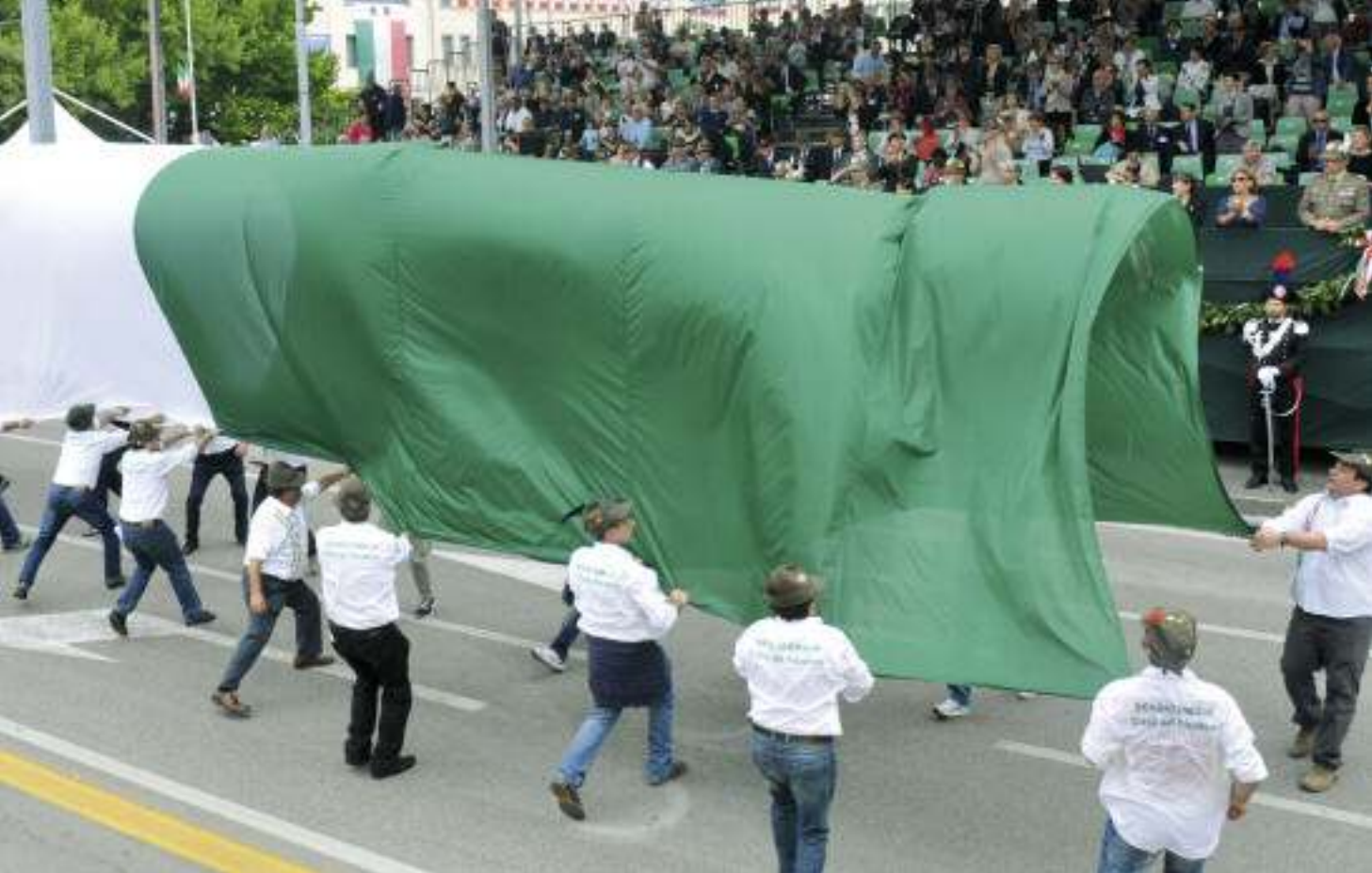
Sopra: gli alpini di Reggio Emilia sventolano un enorme Tricolore davanti alla tribuna delle autorità. Nella pagina a fianco: sfilano i muli, per anni fedeli aiutanti degli alpini.