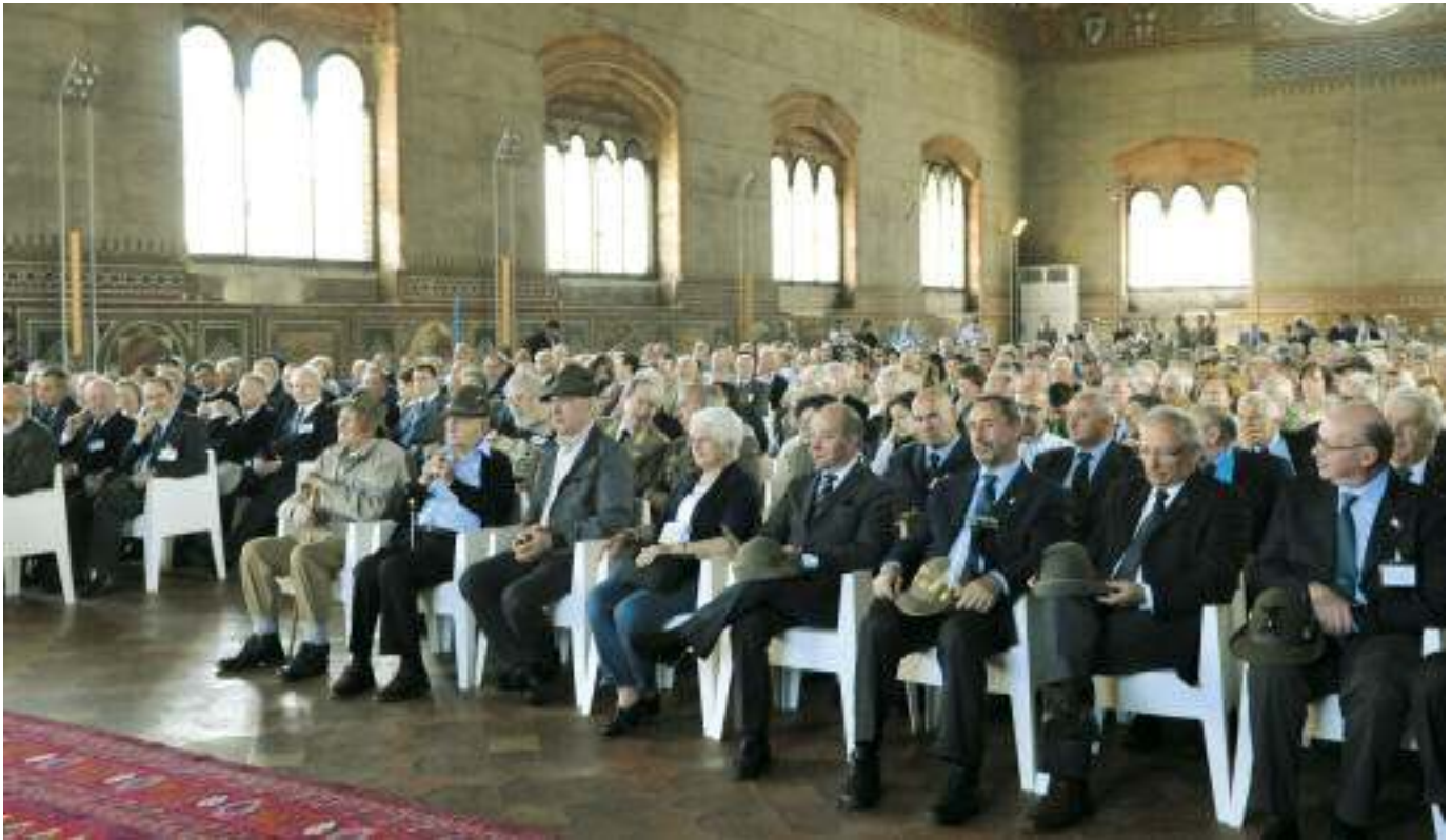
Le autorità e la sala del Palazzo Gotico.