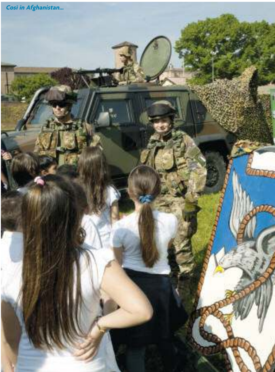
Così in Afghanistan...