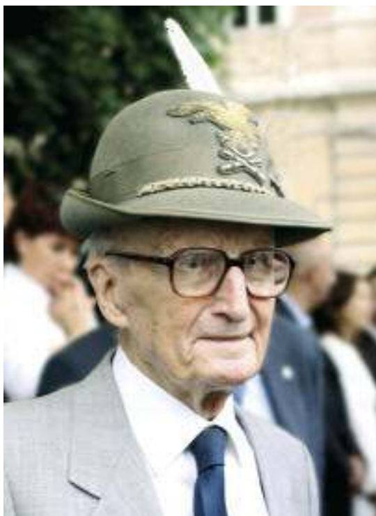
Trentini ad una delle ultime Adunate nazionali.

Nel libro "L'allucinante avanzata degli alpini verso ovest nel gelo e nel fuoco", descrive con commovente intensità gli avvenimenti drammatici della ritirata, narrati attraverso pieghe dolorose dell'animo umano.