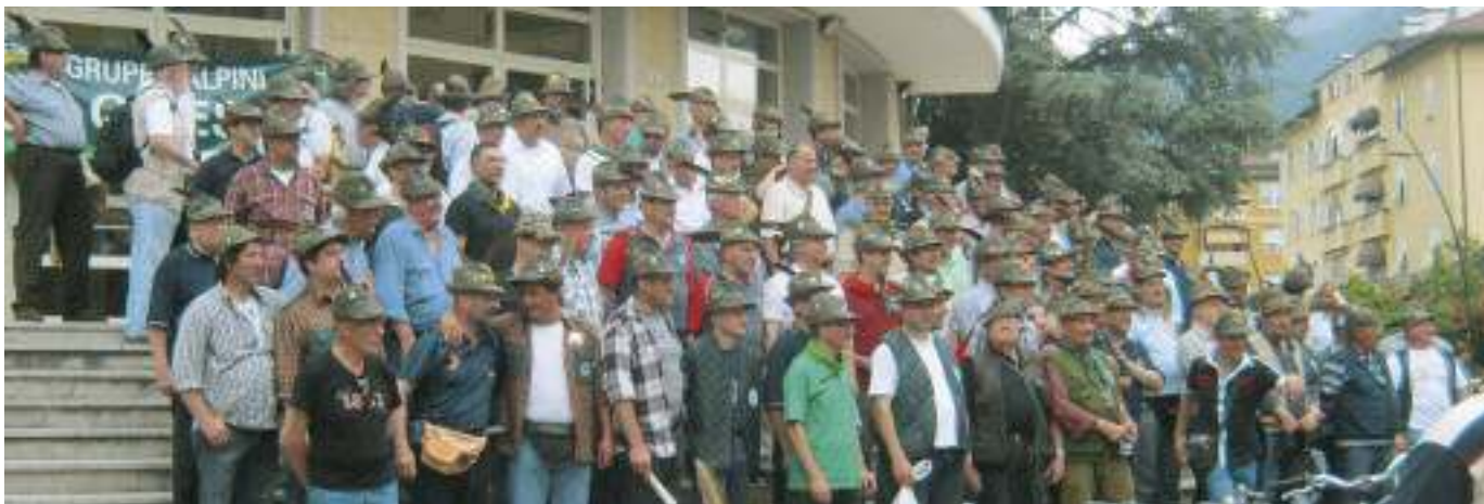
All'Adunata di Bolzano si sono ritrovati un bel numero di 'veci e bocia' di vari scaglioni del gruppo Asiago.