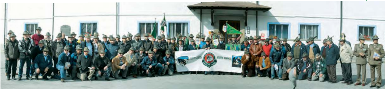
Festeggiato a La Thuile (Aosta) il sedicesimo raduno dei Lupi della Monte Bianco e il sessantesimo anniversario di costituzione del reparto. Una due giorni intensa e ricca di emozioni. L'appuntamento per quest'anno è a Recoaro Terme (Vicenza).