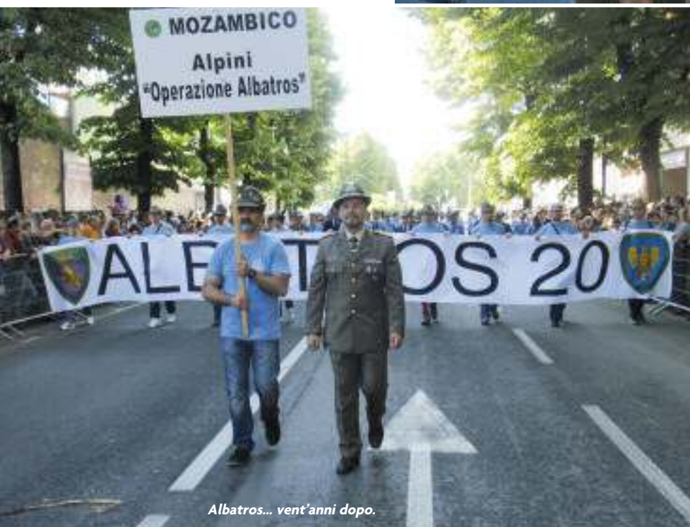
Albatros... vent'anni dopo.

alpini più lontani (Sicilia, Sardegna...), settore per settore, Sezione per Sezione intercalati da bande, corpi musicali, fanfare che danno il passo agli altri e il tono dell'allegria e della festa a tutti.