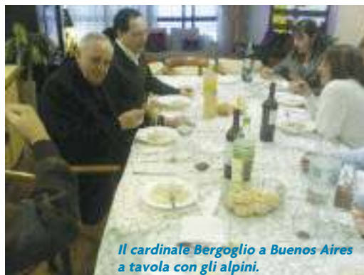
Il cardinale Bergoglio a Buenos Aires a tavola con gli alpini.