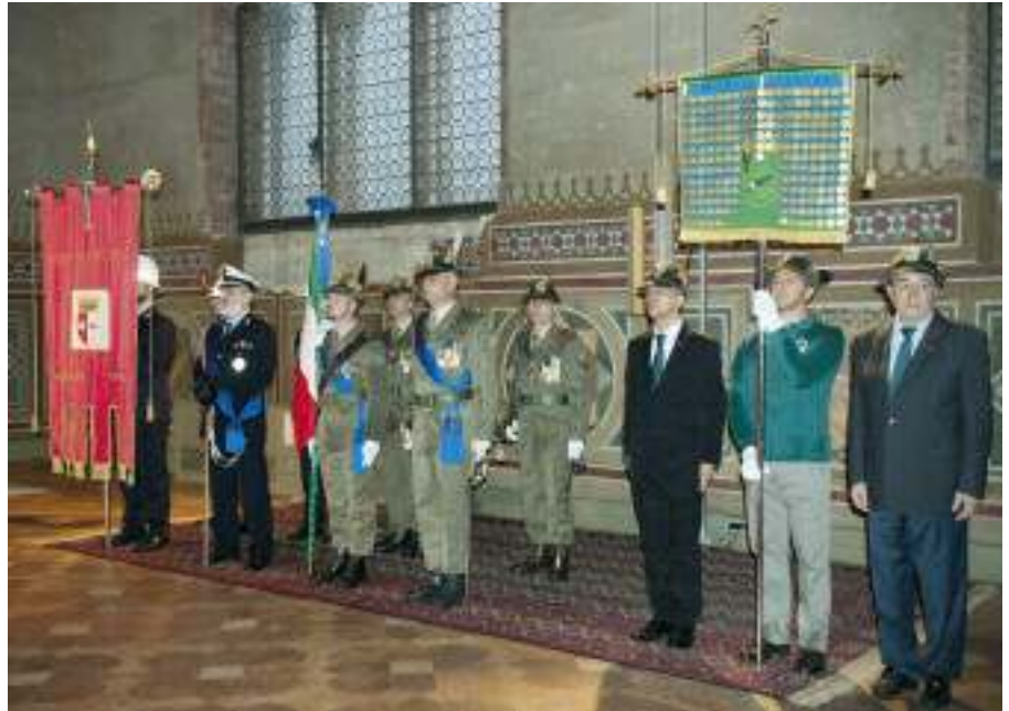
La bandiera di guerra del 1° Art. Mont., il Labaro e il gonfalone di Piacenza al Palazzo Gotico.