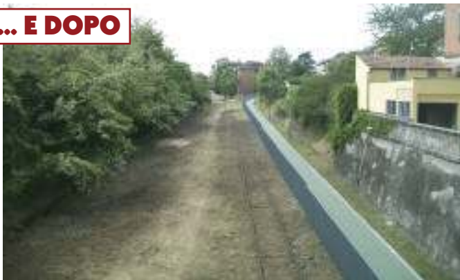
Nelle foto sopra: la zona dell'ex ferrovia prima e dopo i lavori. Sotto: Alpini al lavoro al giardino INA di via Raineri.

S ono arrivati di buon mattino. Tute gialle, pale in mano, hanno iniziato a lavorare nel giardino del quartiere. Dalle finestre dei palazzi i più curiosi si erano affacciati, mentre i passanti elogiavano l'intervento, perché da troppo tempo quel pezzo di verde circondato dagli edifici era lasciato a se stesso e all'incuria dell'uomo: arbusti cresciuti in modo incontrollato, vialetti resi invisibili dalle erbacce, fango ovunque.