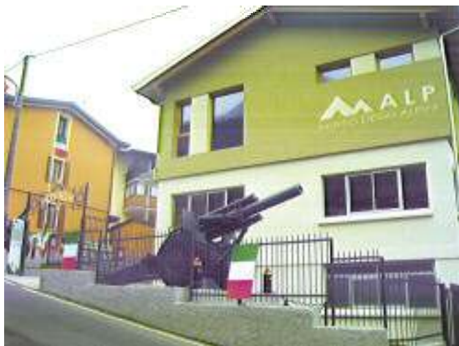
Il museo e il momento del taglio del nastro.

G li alpini di Fucine hanno inaugurato il loro museo che raccoglie una notevole quantità di reperti, utili per ripercorrere la storia recente delle Truppe alpine. Nelle sale, molto ben disposte, sono presenti delle tavole illustrative che aiutano il visitatore nel percorso. Il museo dispone anche di una saletta multimediale, fruibile anche dai diversamente abili, che rappresenta un'opportunità in più per chi visita la Valle Camonica: un territorio particolarmente diversificato ricco di storia e di arte, che si estende dal lago d'Iseo alle cime dell'Adamello e comprende due vasti parchi naturali: quelli dello Stelvio e dell'Adamello.