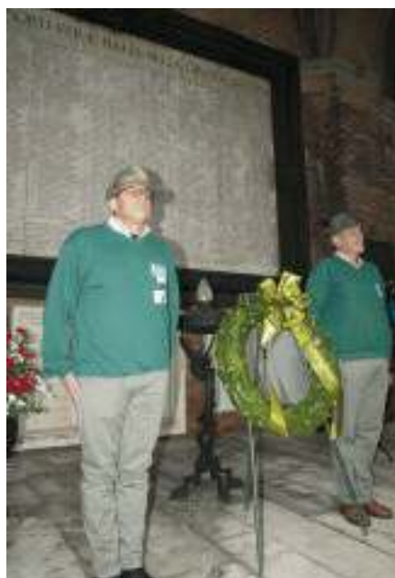
La Corona alla lapide dei Caduti di Piacenza.

Infine gli onori finali al Labaro e al gonfalone della città. Centinaia di alpini si sono riversati nelle vie tutt'intorno. Si respirava ormai aria di festa: era già adunata. (ggb)