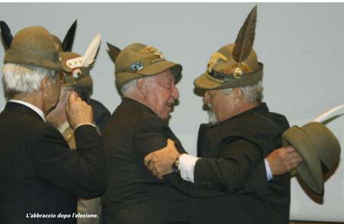
L'abbraccio dopo l'elezione.

Le soluzioni sono dentro di noi, mettiamo a frutto la ricchezza delle nostre risorse sfoderando il coraggio e la determinazione che ci appartengono.