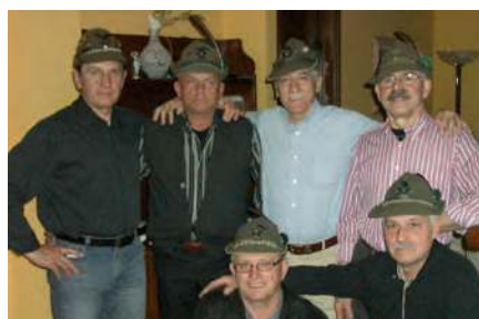
La 78ª compagnia, 'i Lupi di Agordo', si ritroverà il 30 giugno 2013 ad Agordo per festeggiare i 40 anni dal congedo. Per informazioni telefonare ai numeri 0424-708858, 0445-741649, 0444-668140 oppure 0424-511825.