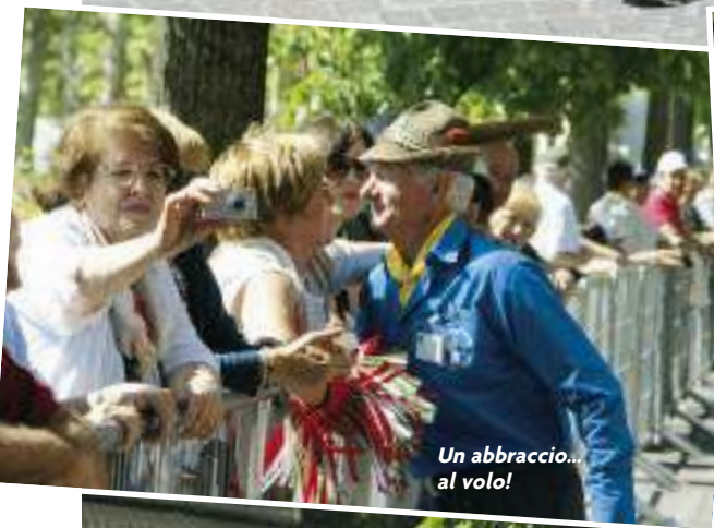
Un abbraccio... al volo!