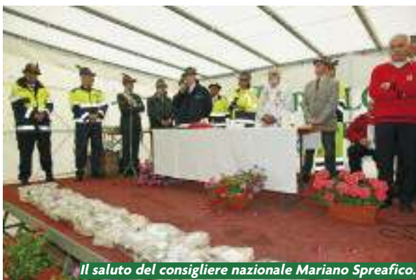
Il saluto del consigliere nazionale Mariano Spreafico.

È seguita l'apposizione della medaglia sul vessillo sezionale (assegnata dalla Presidenza del Consiglio dei Ministri all'ANA per riconoscere l'impegno dei volontari che hanno operato a seguito del terremoto in Abruzzo), cui sono seguiti i brevi interventi di saluto e ringraziamento delle autorità e dei vertici associativi: il consigliere nazionale