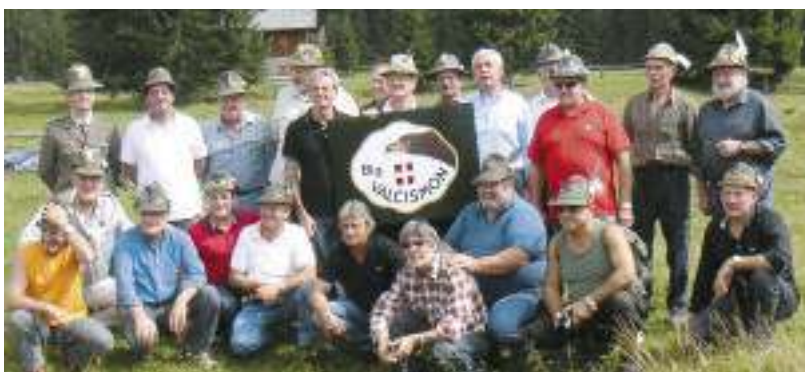
Alpini del btg. Val Cisonon dei contingenti del 1973 si sono ritrovati alla caserma Calbo di Santo Stefano di Cadore, al cimitero militare per l'omaggio ai Caduti e alla chiesetta della Madonna delle Nevi.