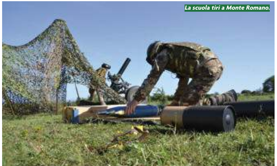
La scuola tiri a Monte Romano.

dell'Aviazione dell'Esercito di stanza a Viterbo, ha svolto una esercitazione a fuoco, e al Col Maurin, in Piemonte, dove sono stati impegnati tutti e cinque i reggimenti. Una prova generale di cooperazione con le diverse forze è stata infine condotta dal comando brigata a Bracciano, per simulare la reazione agli attacchi, verificare i collegamenti all'interno della brigata e interforze. Insomma, non è stato lasciato niente al caso. Del resto i nostri alpini sono ormai veterani di queste missioni, anche se sono consapevoli che l'imprevisto sarà sempre in agguato. E si preparano ad affrontarlo. La loro professionalità è fuori discussione. In più hanno quello che li distingue dai militari delle altre nazioni che concorrono all'ISAF: sono alpini, ed il loro modello operativo è considerato vincente e preso ad esempio da tutti gli altri. ●