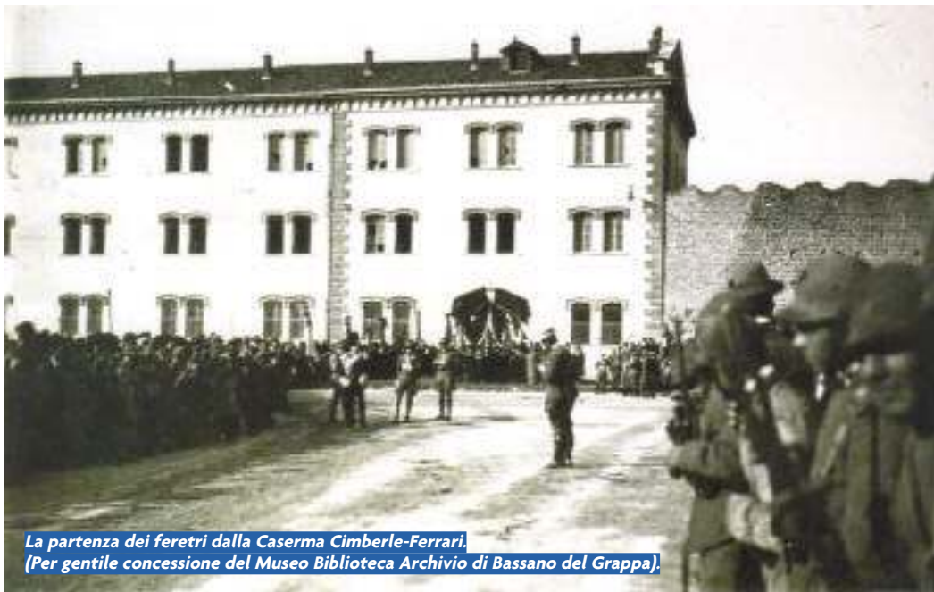
La partenza dei feretri dalla Caserma Cimberle-Ferrari. (Per gentile concessione del Museo Biblioteca Archivio di Bassano del Grappa).

La vecchia caserma “Cimberle-Ferrari” di Viale delle Fosse, ormai da tempo di proprietà del Comune di Bassano del Grappa, negli ultimi anni ha mutato più volte la sua destinazione d’uso: magazzino, parcheggio, cinema all’aperto, banco di prova di writers nonché sede di uffici comunali, di associazioni e del centro anziani. Molte sono le voci sulla definitiva sorte di questa testimone di una parte di storia della nostra città. Edificata alla fine del 1800, fu dapprima sede di uno squadrone di cavalleria, poi quella del battaglione alpini Bassano, che vi risiedette fino all’inizio della Grande Guerra, per divenire in seguito deposito del 6° reggimento Alpini per fornire i complementi da inviare sul fronte dell’Altopiano di Asiago.