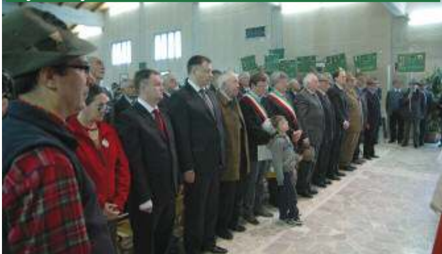
Le autorità ascoltano la Messa, mentre sullo sfondo i vessilli delle Sezioni ospiti sono schierati sull'attenti: Conegliano, Francia, Piacenza, Bassano del Grappa, Varese, Salò, Bolognese-Romagnola, Cadore, Brescia, Molise, Ivrea, Palmanova, Feltre, Vittorio Veneto, Savona.

Perona ha concluso: "Ho lasciato Nikolajewka con ben presente una cosa: solo attraverso questi sentimenti di grandissima umanità gli uomini si possono confrontare. Il prossimo anno ci sarà il 20° anniversario e l'asilo è in perfette condizioni. Ma ciò che è straordinario è che 20 anni dopo non abbiamo perduto la memoria di tutti coloro che per costruire