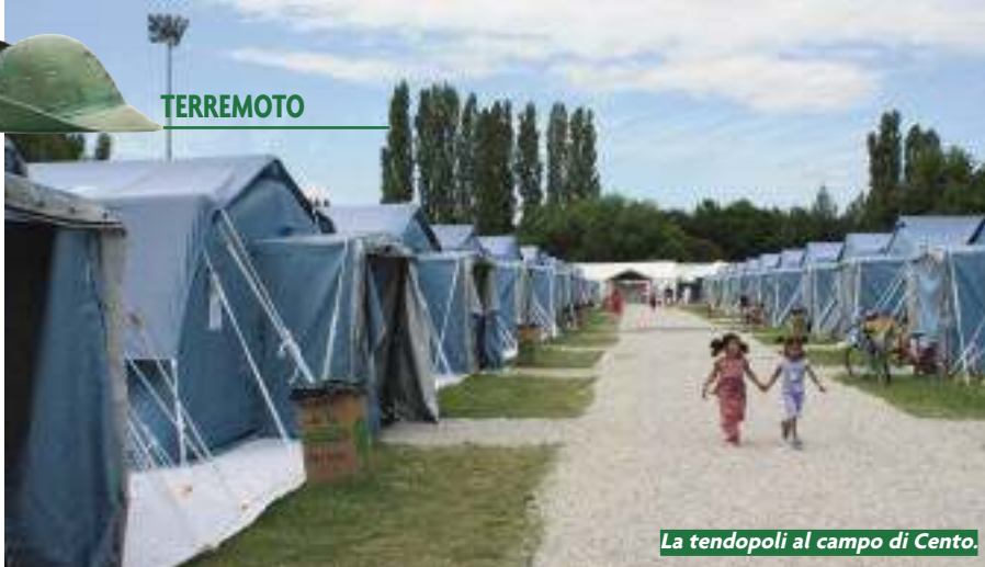
La tendopoli al campo di Cento.