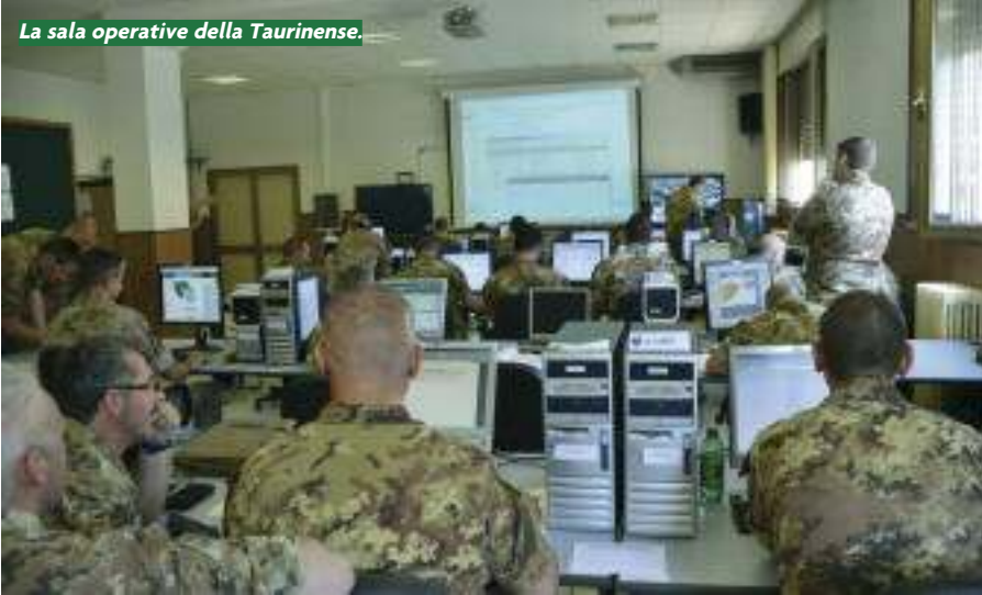
La sala operative della Taurinense.

L'Afghanistan è ormai alle porte per la Taurinense. La brigata, comandata dal gen. Dario Ranieri, ha messo a punto l'addestramento dei suoi reparti in vista della missione che inizierà ai primi di settembre. Darà il cambio ai bersaglieri della brigata Garibaldi e si attesterà sul territorio della Regione Ovest, che è grande come l'intera pianura Padana, affidato alla responsabilità del comando italiano. Ci saranno tutti e cinque i reggimenti: il 2° di Cuneo, il 3° di Pinerolo, il 9° de L'Aquila, il 1° artiglieria di Fossano, il 32° genio alpino di Torino, città nella quale ci sarà la cerimonia di saluto. Ma prima ancora, un piccolo contingente sarà già in Afghanistan per organizzare la procedura del cambio in attesa dell'arrivo del resto della brigata.