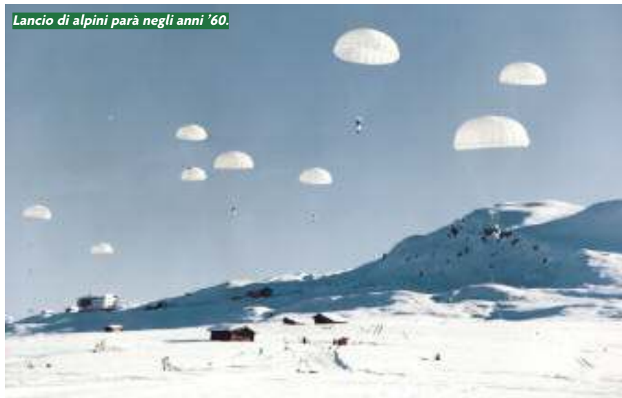
Lancio di alpini parà negli anni '60.