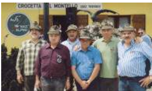
Alcuni commilitoni del 1°/75 che erano nell'8° Alpini a Pontebba si sono ritrovati a Crocetta del Montello, a 29 anni dal congedo.