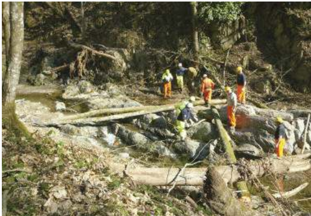
Uno dei cantieri della nostra Protezione Civile a Monterosso, in Liguria, nel post-alluvione.

A ncora una volta il Dipartimento di Protezione Civile ha dimostrato l'elevata affidabilità che ripone nella nostra Associazione. Il 23 e 24 Aprile si è tenuto a Roma, presso la Sede del Dipartimento, uno scambio di idee tra esperti sul volontariato di Protezione Civile e i partner del Programma EURO-MED - PPRD South ( Programme for the Prevention Preparedness and Response to Natural and Man-Made Disasters ) promosso dalla Commissione Europea. All'incontro erano presenti i responsabili delle strutture di Protezione Civile di Germania, Slovenia e Svezia. In rappre-