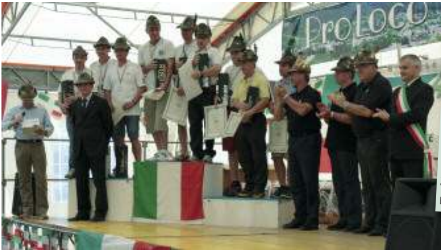
Nelle foto: il podio dei vincitori e un momento delle gare.

Ma la competizione non è stata solo bellezze paesaggistiche: il percorso della gara ha offerto una panoramica sulle località che sono state l'ultimo baluardo a difesa dell'Italia nella prima guerra mondiale dopo la rotta di Caporetto, dove sono state scritte dolorose e gloriose pagine di storia patria. Non solo una gara sportiva quindi, ma anche un sentito e doveroso omaggio a quanti hanno sacrificato la loro vita prima di noi e per noi. La manifestazione si è poi conclusa con il pranzo per tutti gli atleti e le premiazioni dei vincitori presso gli impianti sportivi di Segusino. ●