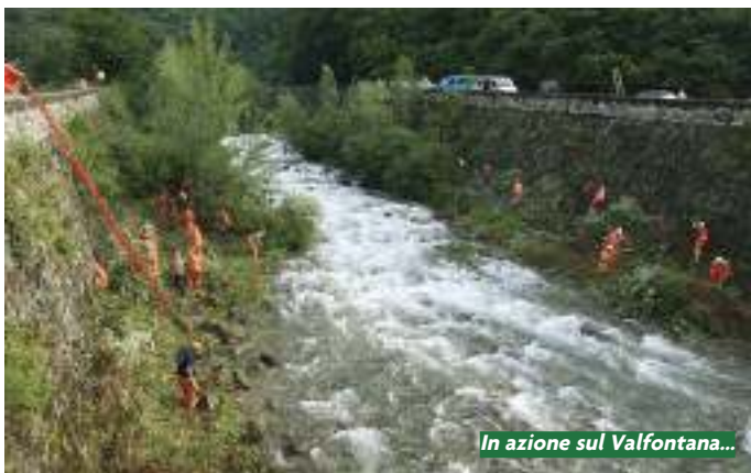
In azione sul Valfontana...