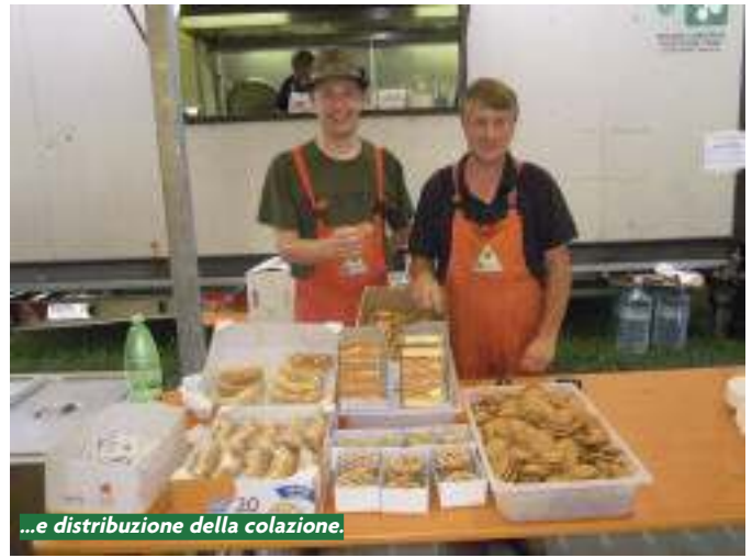
...e distribuzione della colazione.

di ANA e rapporti con la Regione. Verso sera i volontari della Colonna Mobile ANA sono a Finale ed inizia, con un tempo avverso (pioggia incessante) il montaggio delle tende, della mensa e della cucina; attività difficoltose, abbiamo al seguito torri faro che ci permettono un'attività senza alcuna interruzione. La Regione Emilia Romagna con il passare del tempo prende sempre più possesso della gravità dell'evento e quindi assume il suo ruolo di coordinamento. Arriva la sera e la situazione del coinvolgimento ANA è ancora in evoluzione.