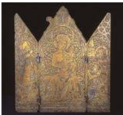
La prima immagine sacra portata sul Rocciamelone: il trittico raffigura la Madonna con il Bambino, San Giorgio che uccide il drago e San Giovanni Battista mentre presenta Bonifacio Roero alla Vergine. Attualmente è custodito nella cattedrale di San Giusto di Susa.

ne del tenente Ferretti, trasportarono la statua, prima con le carrette, poi con l'aiuto dei muli, fino a Ca' d'Asti dove i pezzi rimasero fino al 25 luglio, mentre in vetta venivano eseguiti i lavori di fondazione per il piedistallo.