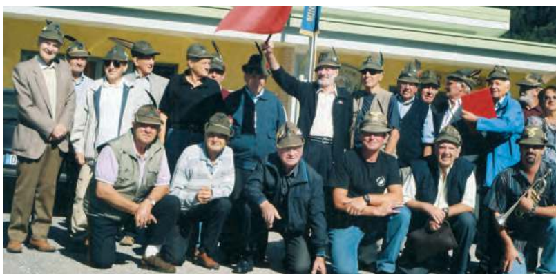
Si sono ritrovati ad Arta Terme gli alpini dell'8° Alpini, 8° Mortai, che erano a Tolmezzo nel 1950.