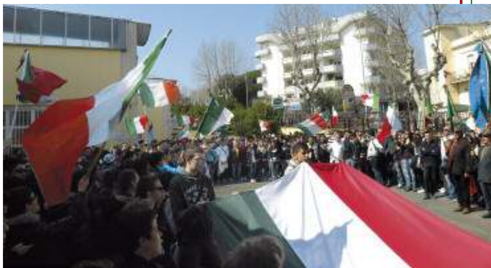
L'onore ai Caduti (sullo sfondo la nuova baita) e la targa commemorativa scoperta alla presenza del sindaco, del presidente Pinamonti e del capogruppo.

Il passaggio della bandiera italiana, portata dai rappresentanti d'istituto seguita dal vessillo della Sezione e dai gagliardetti dei Gruppi al ritmo del “Trentatatrè”, è stato accolto con grande entusiasmo dagli