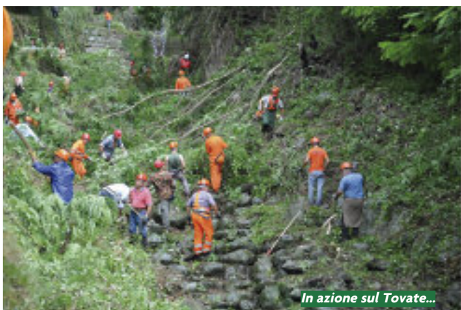
In azione sul Tovate...

Uno slancio collettivo, un assalto all'incuria e in 7/8 ore d'interventi lo scenario è completamente mutato. La lussureggiante vegetazione di arbusti, piante, cespugli e rovi che occultava il corso e costituiva un potenziale moltiplicatore di danni in caso di piena dei torrenti era scomparsa. Tagliata, ordinatamente