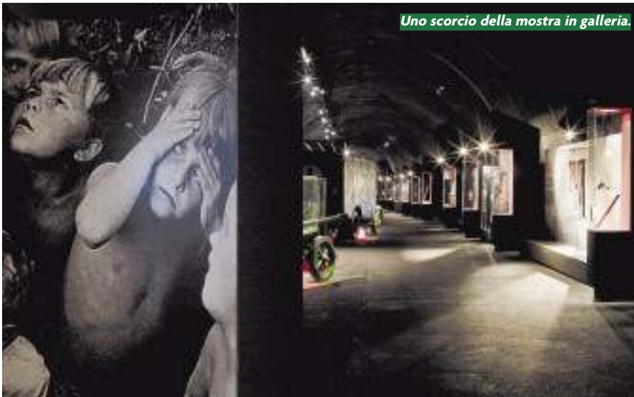
Uno scorcio della mostra in galleria.

le degli Alpini”, formata da chiunque si proponga di sostenere concretamente l’attività del museo: a tal fine hanno aderito la Provincia Autonoma di Trento ed il Comune di Trento; tra i soci fondatori vi è anche l’ANA. Molto attiva ed in piena sinergia con l’ANA e le istituzioni, l’associazione “Amici del Museo” ha coadiuvato nelle visite in sede o fuori sede, attività che ha portato il museo a superare il “muro” di 50mila visitatori.