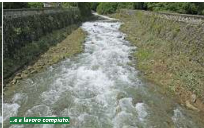
...e a lavoro compiuto.

Il terremoto prima - tutti hanno sentito la vicinanza alle genti colpite - e l'imperversare del maltempo durante, non hanno scalfito la buona riuscita dell'esercitazione di Protezione Civile “Valtellina 2012” che si è svolta dall'8 al 10 giugno.