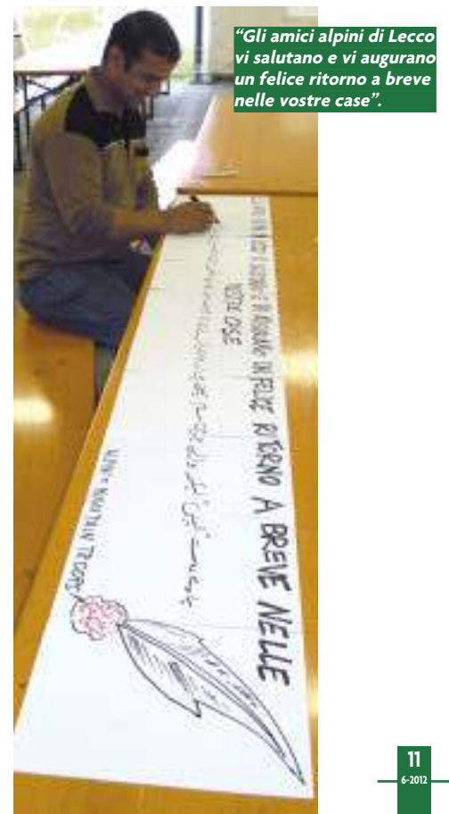
"Gli amici alpini di Lecco vi salutano e vi augurano un felice ritorno a breve nelle vostre case".

Il 20 giugno il numero dei volontari (uomini e donne) che hanno portato il loro contributo all'emergenza connessa con il terremoto in Emilia, per turni di 2/3/4/7 giorni è di circa 1.700 persone. ●