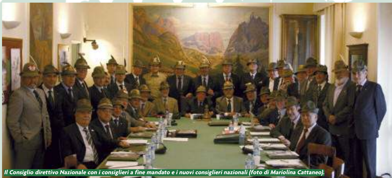
Il Consiglio direttivo Nazionale con i consiglieri a fine mandato e i nuovi consiglieri nazionali.