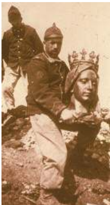
1899: il trasporto della statua sulla cima del Rocciamelone. A destra: gli alpini accanto alla statua.