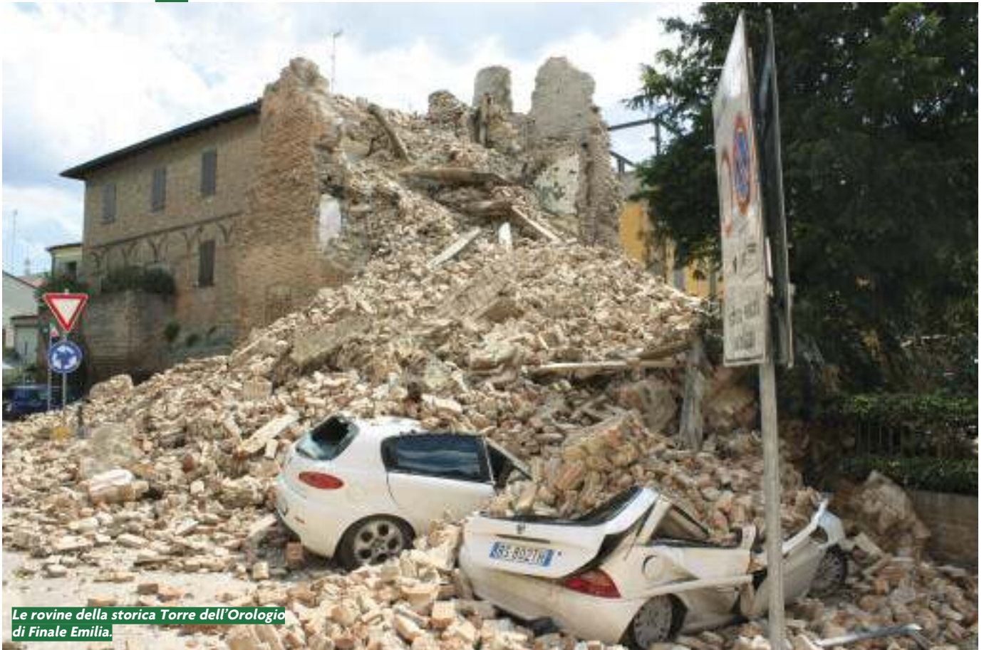
Le rovine della storica Torre dell'Orologio di Finale Emilia.