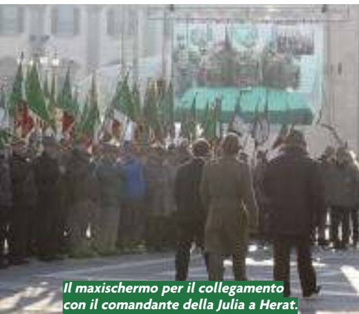
Il maxischermo per il collegamento con il comandante della Julia a Herat.