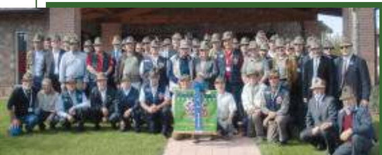
Ritrovo nella sede del gruppo di Lonato (Brescia) per una cinquantina di alpini del btg. Tirano. Nell'occasione è stata fissata la data del prossimo incontro – il 3 e 4 settembre 2011 – a Malles Venosta e Glorenza. Per informazioni: www.iltirano.org