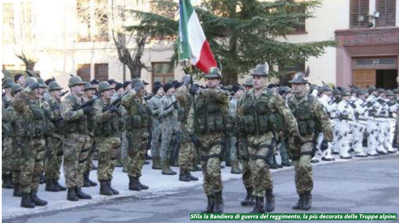
Sfila la Bandiera di guerra del reggimento, la più decorata delle Truppe alpine.