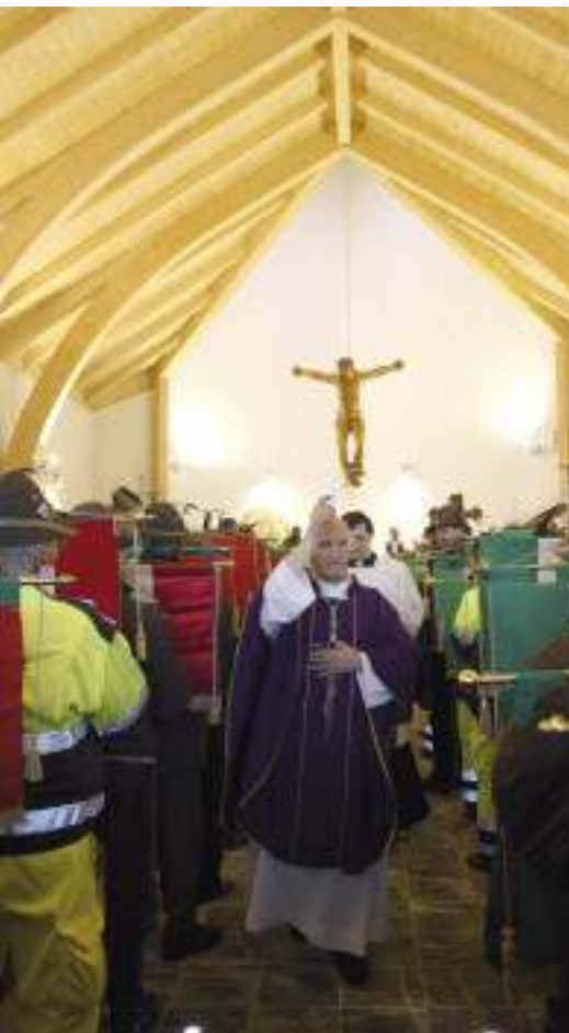
Mons. Molinari, arcivescovo de L'Aquila benedice la chiesa.