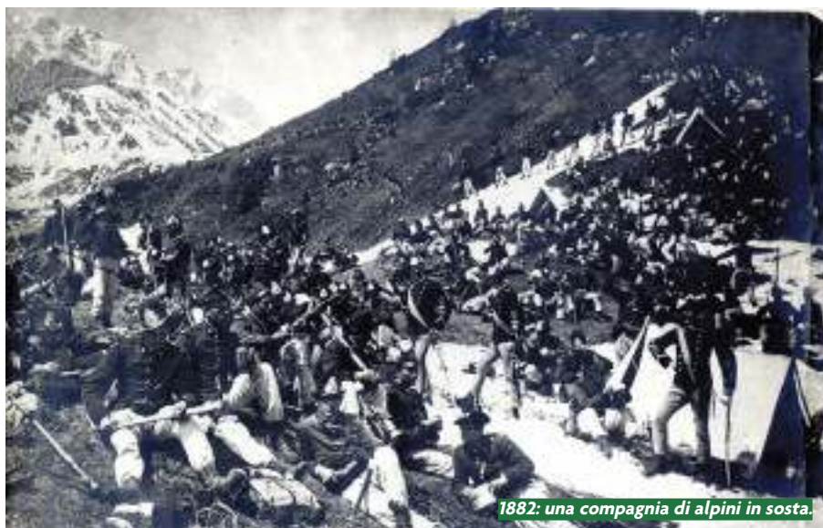
1882: una compagnia di alpini in sosta.

metà dell'Ottocento non è un paesaggio abituale come oggi, percorso da strade comode e disseminato di centri turistici: all'opposto, è una montagna severa, in parte ancora inviolata, coperta da ghiacciai, attraversata solo da sentieri o da mulattiere. Mandare in quell'ambiente giovani cresciuti in pianura sarebbe militarmente fallimentare: in quota servono soldati abituati a muoversi sui terreni accidentati, a resistere alle temperature rigide, ad arrampicarsi su pendii impervi. Di qui la proposta di Perrucchetti (che oggi sembra logica e banale, ma che al tempo risultò rivoluzionaria): affidare la difesa alpina a soldati nati e cresciuti in montagna, pratici dei luoghi sin dalla giovinezza, e sicuramente motivati nel caso in cui dovessero difendere da un'aggressione nemica i propri cari e i propri beni. Il ministro della guerra in carica, il generale Cesare Ricotti Magnani, legge