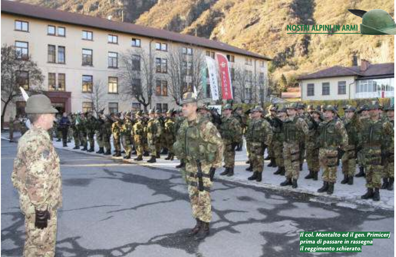
Il col. Montalto ed il gen. Primicerj prima di passare in rassegna il reggimento schierato.

stra zona di Lancio e queste montagne il nostro scenario a cui si assocerà il nostro reggimento. Il nostro spostarci fisicamente non potrà mai mutare ciò che siamo e sempre saremo... alpini. Noi alpini paracadutisti ci teniamo a sottolineare che ci sentiamo alpini prima che ogni altra cosa e che la nostra identità - oltre che le tradizioni fulgide da cui nasciamo - non potrà mai essere messa in discussione ed è indissolubilmente legata alla montagna. Il nostro reggimento è diverso dagli altri, noi abbiamo l'esuberanza e la spregiudicatezza di chi sa aggredire il cielo, ma ancor più custodiamo gelosamente le leggi che la montagna ci ha insegnato".