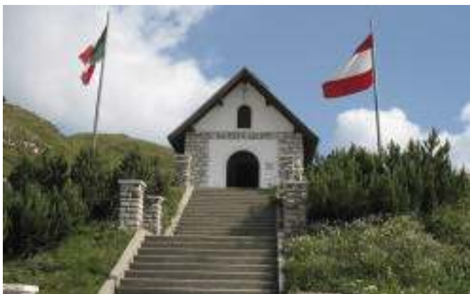
Nelle foto: la chiesetta e la foto ricordo, con il gen. Rossi.