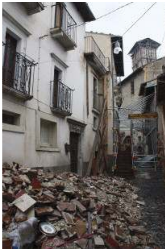
Macerie tra i viottoli del vecchio borgo di Fossa, sullo sfondo svetta il campanile lesionato della parrocchiale.