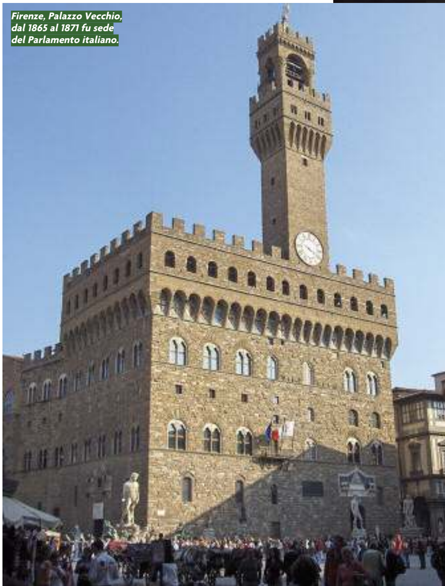
Firenze, Palazzo Vecchio, dal 1865 al 1871 fu sede del Parlamento italiano.

I piemontesi avevano digerito l'evento con qualche difficoltà, eppure alla fine se n'erano fatti una ragione, era un atto che professava la determinazione a completare il progetto e in quanto tale andava accettato. Si calmarono pensando che il trasloco del potere dal Po al Tevere era un'eventualità indeterminata e, certo, non immediata. Lo stesso Cavour aveva trovato modo di sottolinearlo nei