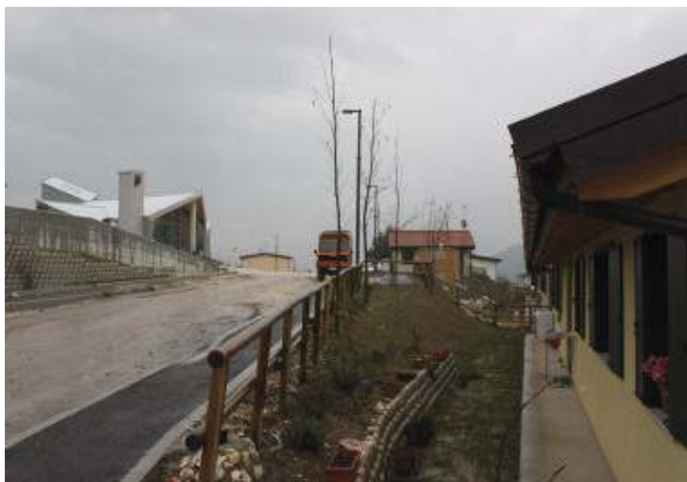
A destra alcune case del Villaggio ANA e, sullo sfondo, la nuova chiesa.