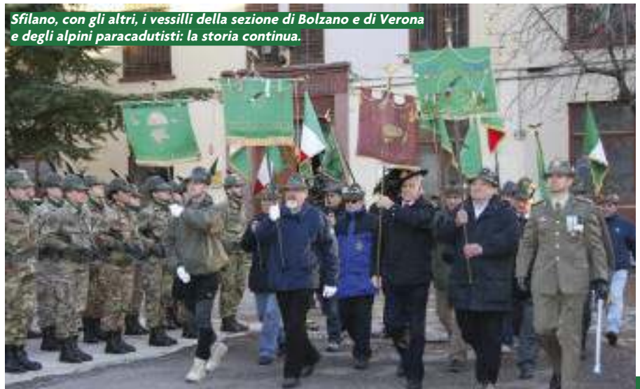
Sfilano, con gli altri, i vessilli della sezione di Bolzano e di Verona e degli alpini paracadutisti: la storia continua.

La cerimonia è finita qui. Agli ospiti è stato offerto un rinfresco. Dietro le palazzine del complesso, lunghe teorie di automezzi erano schierate. Forse era uno spettacolo usuale, ma la circostanza faceva venire una stretta al cuore. ●