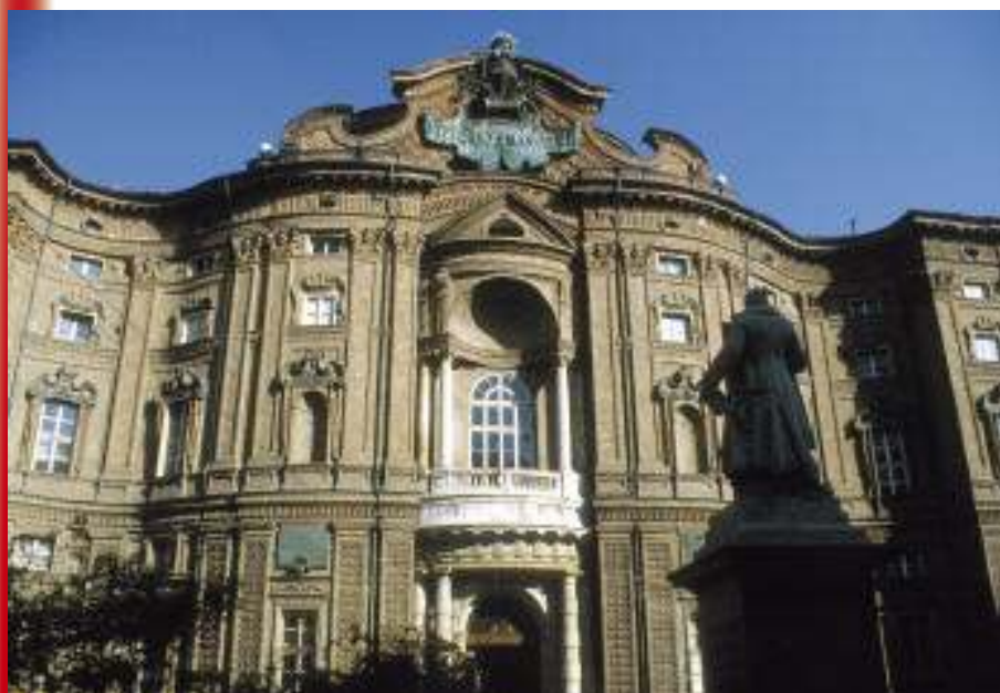
Palazzo Carignano (foto di Michele D'Ottavio - Archivio Turismo Torino e Provincia).

Negli anni Novanta, con la rivoluzione informatica e la ristrutturazione del modo di produrre, il modello fordista dei decenni precedenti è tramontato e Torino ha dovuto reinventarsi: non più città-fabbrica che vive in funzione alle attività degli stabilimenti di Mirafiori, ma città che riscopre la sua storia sabauda, che "investe" nella riqualificazione del cen-