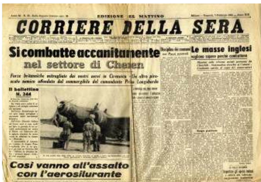
La prima pagina del "Corriere della Sera" del 7 febbraio 1941.