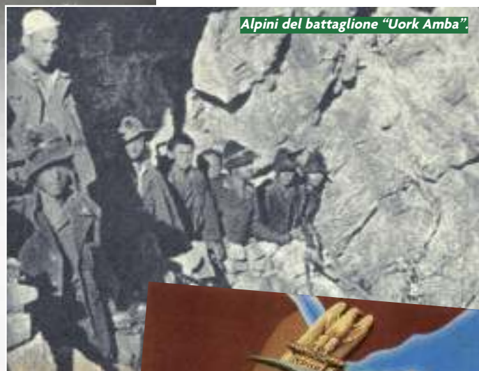
Alpini del battaglione "Uork Amba".