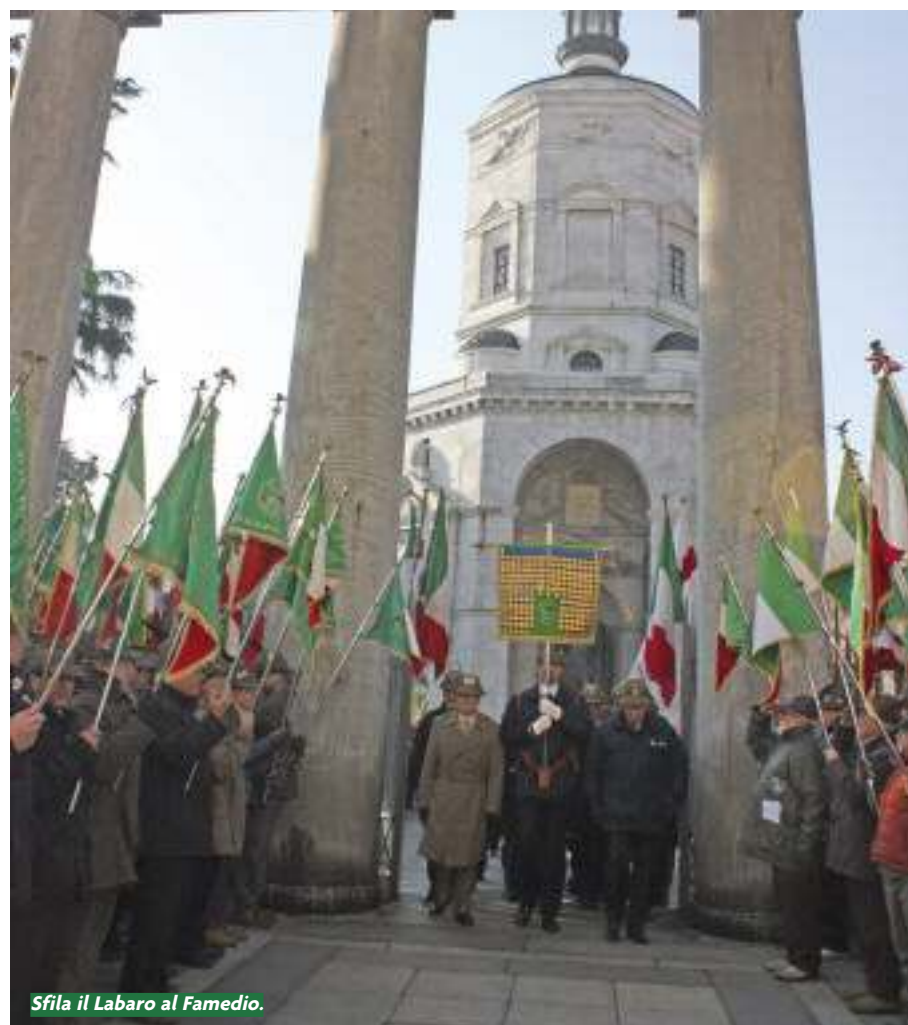
Sfila il Labaro al Famedio.