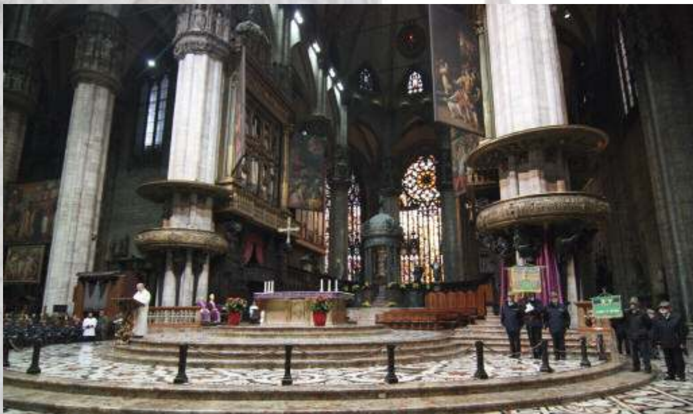
L'interno del Duomo durante la Messa e, nella foto sotto, i gagliardetti nella navata.

lunga teoria di vessilli e gagliardetti, accompagnato dagli applausi del pubblico, ed è poi salito sul sagrato, fra le autorità. Ha preso quindi la parola il presidente della sezione Boffi, per ringraziare i tanti alpini, i sindaci e le centinaia di milanesi presenti.