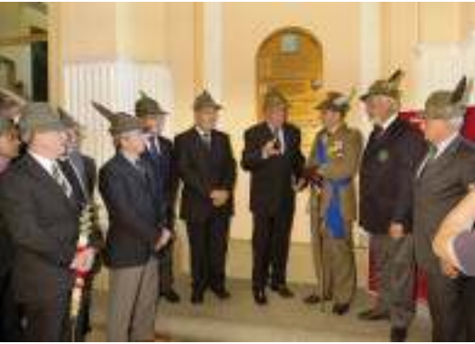
La foto del saluto e insieme del benvenuto nell'ANA da parte del presidente nazionale Perona alla fine della cerimonia del cambio di comando e collocamento in ausiliaria del gen. Cravarezza.

S ono nato in una famiglia alpina, con zio reduce di Russia ed il papà alpino, prima nel Dò di Cuneo e poi richiamato e combattente in Corsica dal '40 al '43 e per tutta l'Italia con il Corpo Militare Italiano di Liberazione. Come rimpiango i suoi ricordi di vita militare raccontati sottovoce, con pudore, e tra tante immagini di sacrifici, polvere e coraggio, anche quella del suo primo colonnello sul cavallo bianco, così simbolico e diverso dalla mia esperienza ma così evocativo di un tempo di grandi ideali e storici personaggi, di forti convinzioni e esemplare stile di vita, di senso istituzionale e sacrale responsabilità. Ricordi di guerra e, a seguire, di una vita di lavoro e impegno per dare un futuro alla famiglia e dignità alla propria vita.