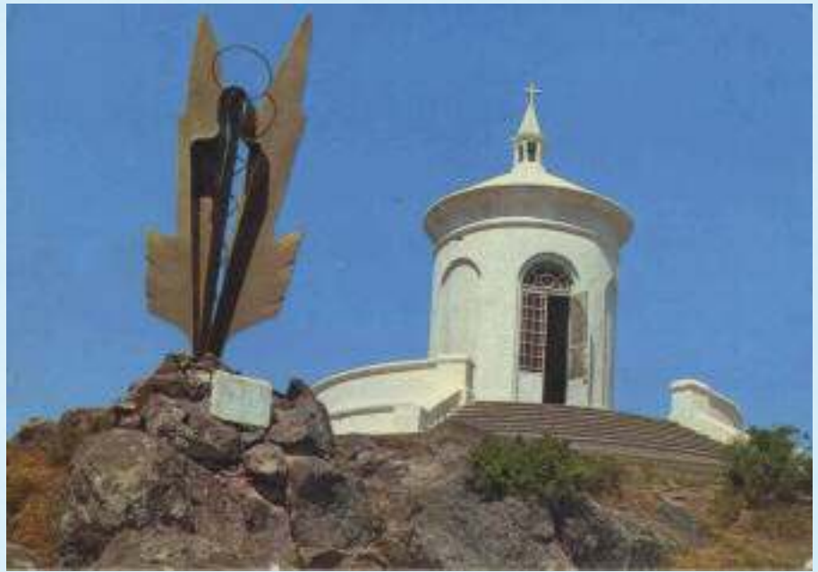
Piriapolis 2004. La chiesetta di Sant'Antonio e il monumento alla Vergine, con sfondo di due penne alpine. Le penne sono rivolte verso l'Italia, sulla targa la scritta: "Gli alpini nel centenario 1872 - 1972".