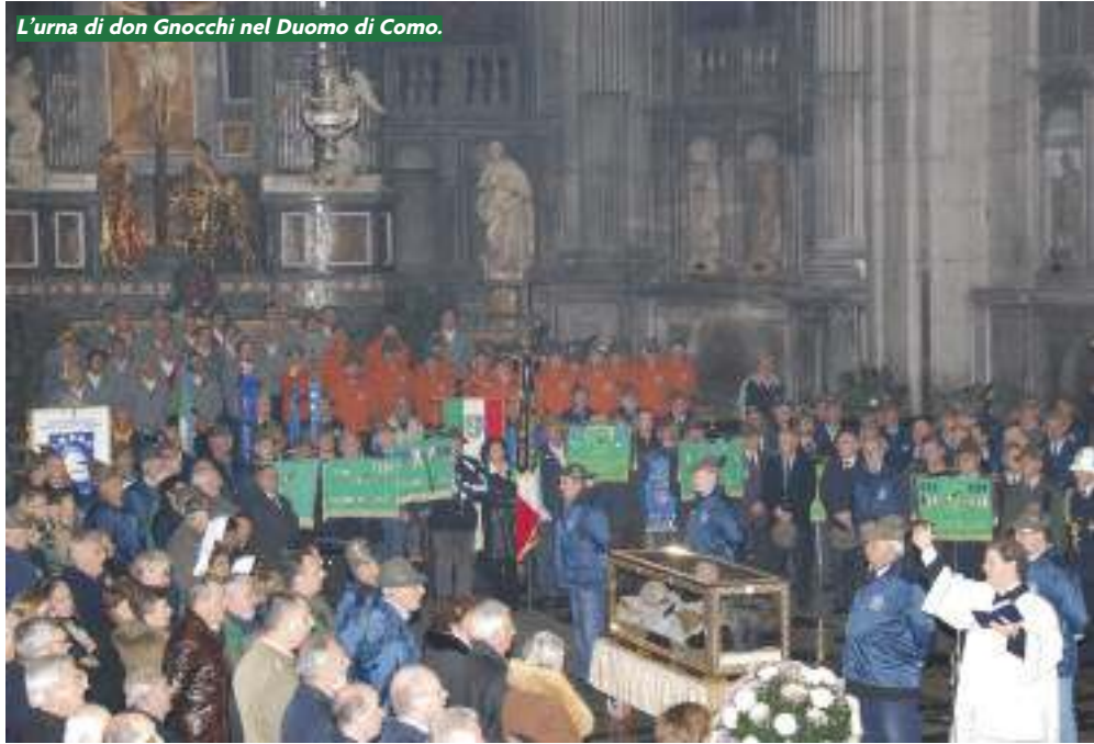
L'urna di don Gnocchi nel Duomo di Como.