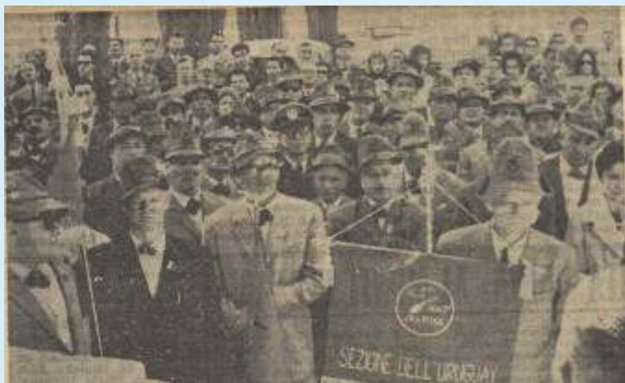
1963, dirigenti sezionali e soci riuniti per l'inaugurazione del nuovo vessillo.