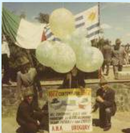
A Montevideo festa per i 100 anni del Corpo degli alpini. Si notano la bandiera italiana e uruguayana e il tabellone con la scritta: 1872 centenario 1972 - Nel centenario della sua fondazione gli alpini ricordano la loro Patria e i suoi Caduti.