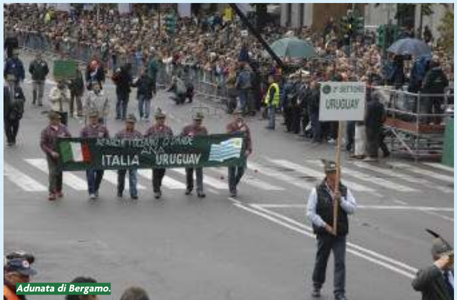
Adunata di Bergamo.