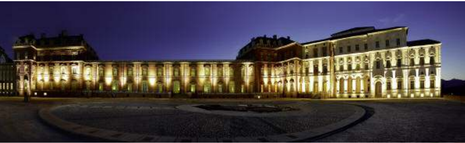
La Reggia di Venaria Reale (foto concessa da "La Venaria Reale"). Sotto: Roma, Palazzo del Quirinale.

sero scoppiati dei moti rivoluzionari, cosa che riconosceva di fatto i diritti dell'Italia su Roma.