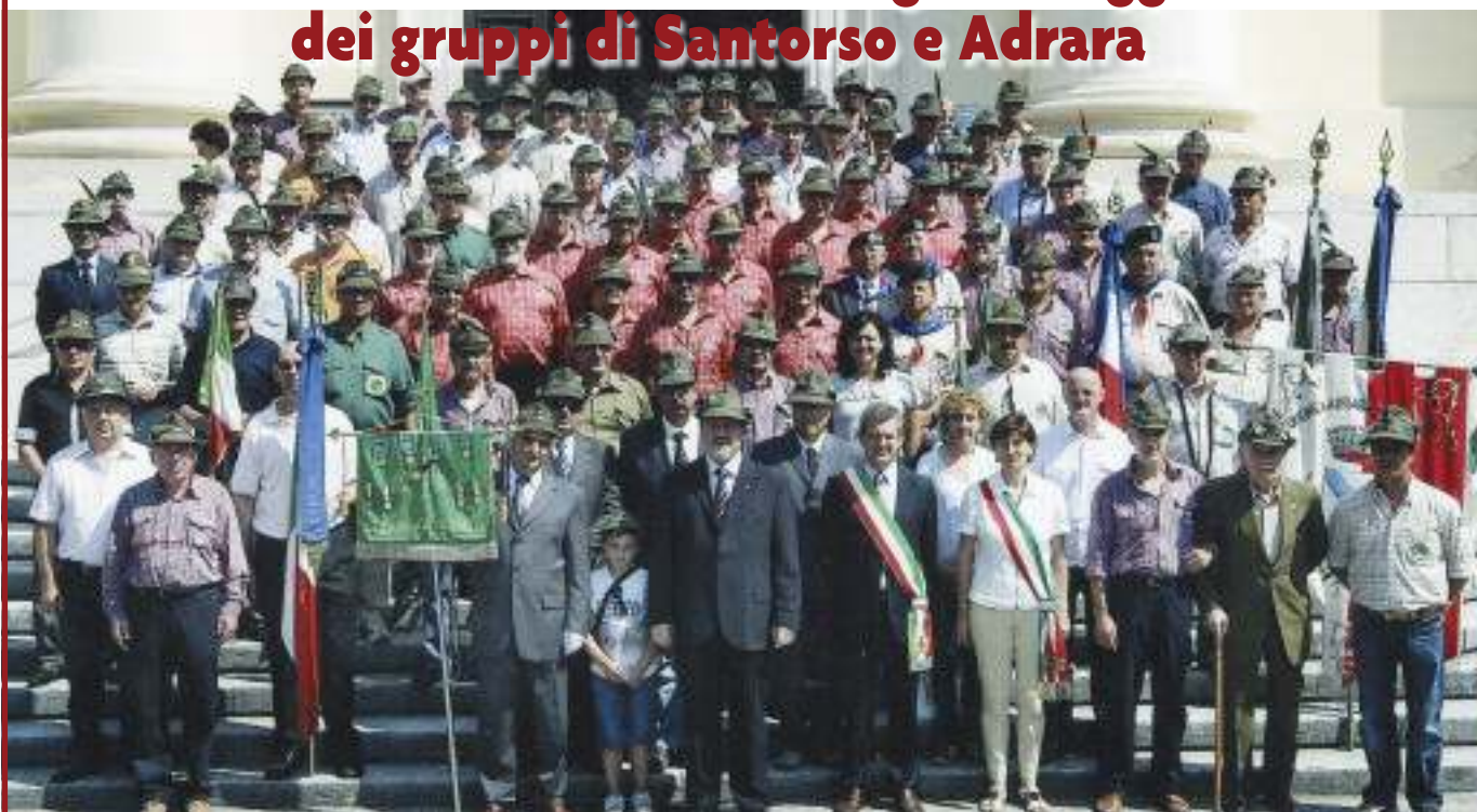
Foto di gruppo degli alpini e delle autorità dei gruppi di Santorso (Vicenza) e di Adrara San Martino (Bergamo) in occasione del 10° anno dal loro gemellaggio. Dopo l'alzabandiera e la deposizione della corona al monumento ai Caduti, accompagnati dalla fanfara storica della sezione di Vicenza e dal coro ANA di Piovene Rocchette, hanno sfilato per le vie di Santorso fino alla chiesa parrocchiale Santa Maria Immacolata, dove hanno assistito alla Messa. Poi la foto ricordo. ●