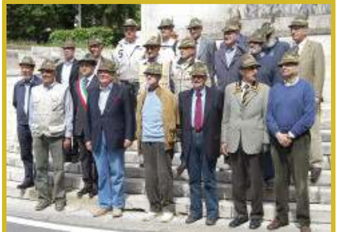
AUC del 25° corso artiglieria da montagna che erano a Foligno nel 1960 si sono ritrovati a Valdobbiadene, per festeggiare il 50° dalla naja.