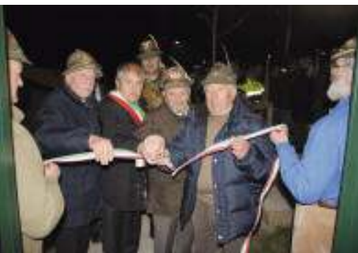
L'inaugurazione della "Casa degli alpini".