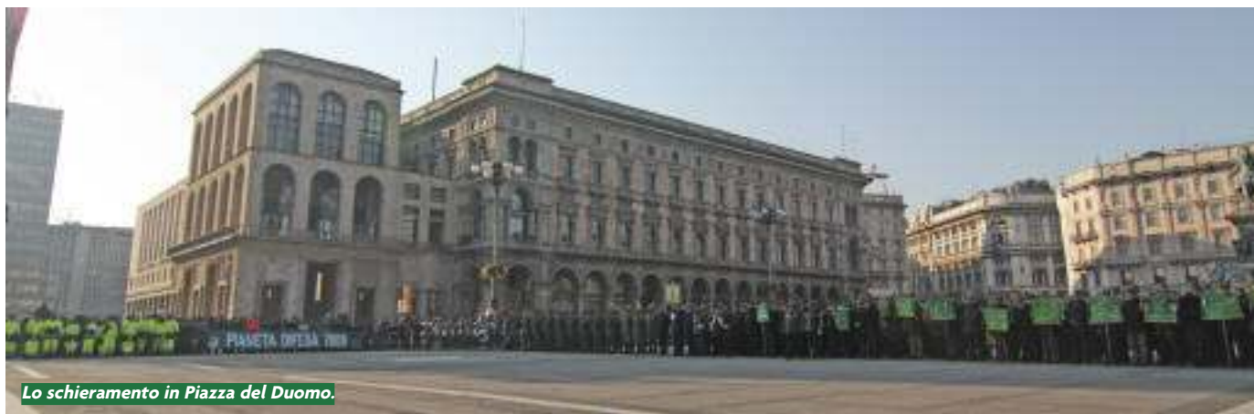
Lo schieramento in Piazza del Duomo.