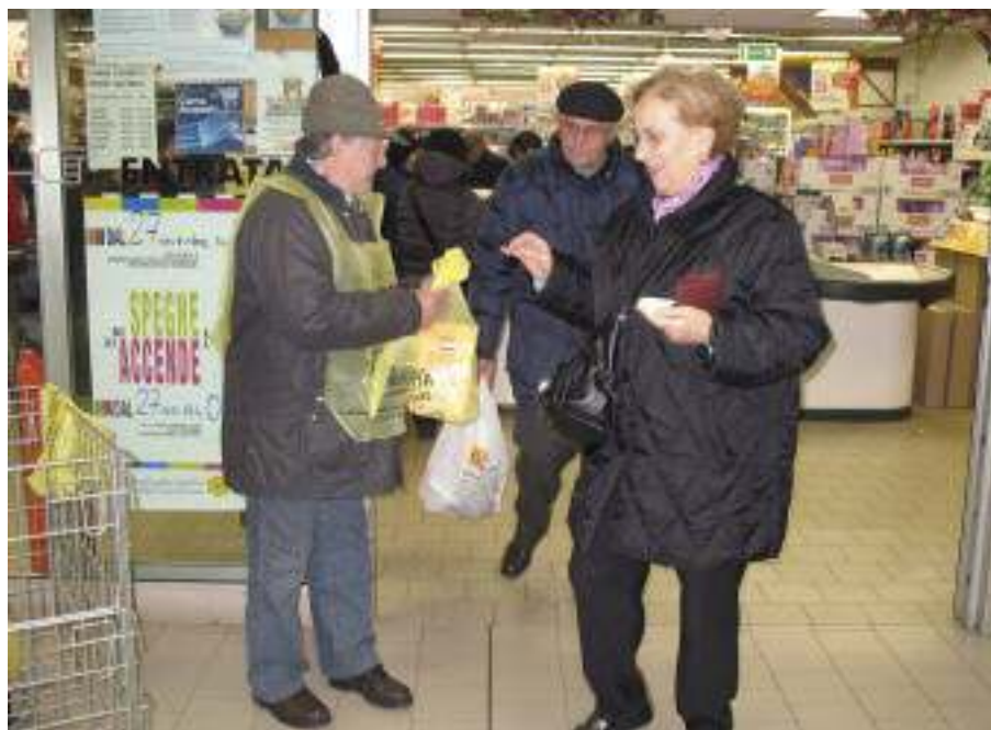
La raccolta a Imola Valsanterno.

La 14ª edizione della Giornata Nazionale della Colletta Alimentare, svoltasi sabato 27 novembre scorso in più di 8100 supermercati, è stata un successo. Grazie alle migliaia di persone che hanno donato e all'aiuto di oltre 110.000 volontari nei supermercati, migliaia dei quali alpini dell'ANA, sono state raccolte 9.400 tonnellate di prodotti alimentari, il 9% in più rispetto all'edizione 2009. Ancora una volta, nonostante la crisi, gli italiani hanno dimostrato solidarietà, soprattutto grazie anche alla presenza rassicurante degli alpini, ed alla simpatia che esprimono. Il cibo sarà smistato nelle decine di depositi dislocati in tutta Italia e quindi distribuito alle oltre 8.000 strutture caritative convenzionate con la Rete Banco Alimentare che assistono ogni giorno famiglie in difficoltà e un milione e mezzo di persone. ●