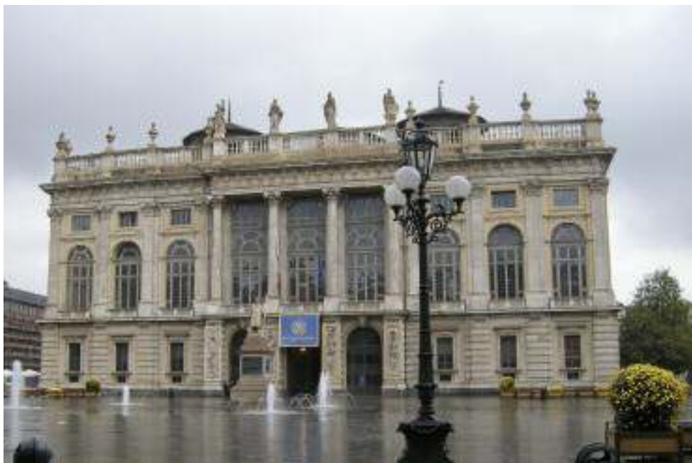
Palazzo Madama.

L'adunata che piace ai torinesi (e non solo a loro!) è questa: l'incontro tra persone che condividono non soltanto una passata esperienza di caserma, ma una cultura, un modo d'essere, una tradizio-