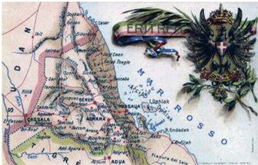
Cartolina d'epoca che raffigura i possedimenti italiani in Eritrea.

Attacchi, contrattacchi, scaramucce, pattuglie: i battaglioni sono ridotti a sole compagnie, manca tutto e le posizioni sono ormai indifendibili; si resiste ancora fino al 27 marzo, ma dopo 56 giorni di sacrifici arriva l'ordine di ripiegare. Gli italiani non sono battuti sul campo, ma la sanguinosa lotta, con circa 6.500 tra