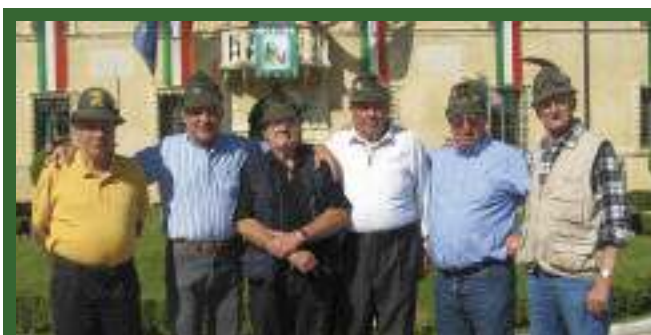
Incontro a Povegliano Veronese, dopo 57 anni, dei commilitoni che erano a Dobbiaco nel gruppo Asiago.