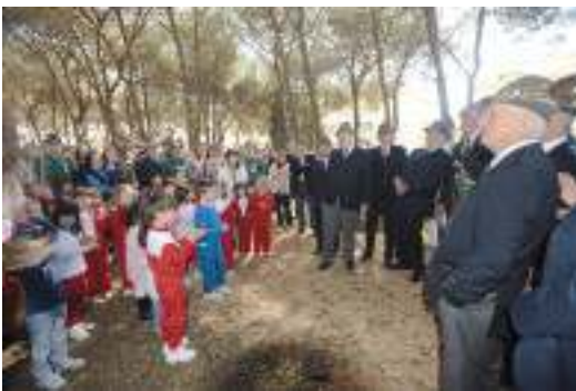
L'incontro con gli alunni.