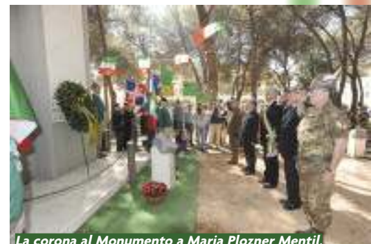
La corona al Monumento a Maria Plozner Mentil.

Mentre ci avviamo al pullman con il motore già avviato, si avvicina un vecchio in ottima forma, e sentendo nel nostro gruppo qualche cadenza veneta dice: "Mi son de Oliero, Valsugana, so' rivà qua 'n tel '34, a undese ani, e go sempre e solo laorà". Alla domanda come si sono comportati i tedeschi e gli americani durante la guerra risponde: "Tutti si sono comportati bene". Ci saluta con un cenno della mano screpolata e un sorriso soddisfatto.