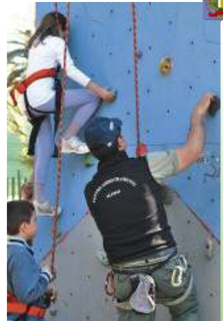
Alla scoperta dell'arrampicata, guidati da un istruttore del Centro Addestramento Alpino di Aosta.