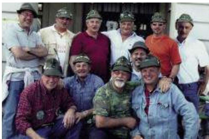
Erano alla caserma Goi Pantanali nella compagnia genio Pionieri, 1°/68. Eccoli di nuovo insieme a Cuneo.