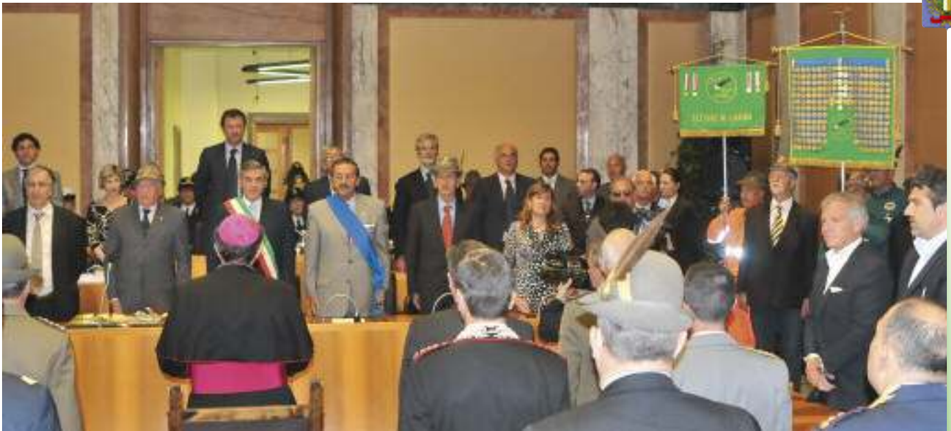
L'aula del Consiglio comunale di Latina durante la cerimonia. Il Consiglio ha approvato all'unanimità la proposta del conferimento della cittadinanza all'ANA.