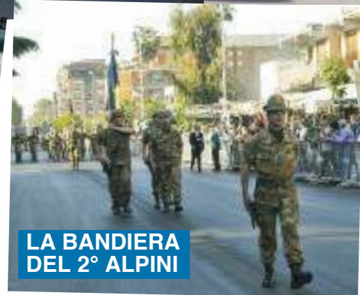
LA BANDIERA DEL 2° ALPINI