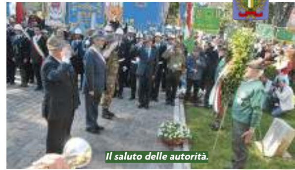
Il saluto delle autorità.

composte almeno da quattro uomini, due donne e tutti i bambini che la Provvidenza mandava. Se la bonifica è stata un miracolo d'ingegneria idraulica e di architettura compiuta a tempi di record, inimmaginabili anche ai tempi nostri, il lavoro dei campi partiva da zero e non richiedeva meno ingegno e arte per dare i