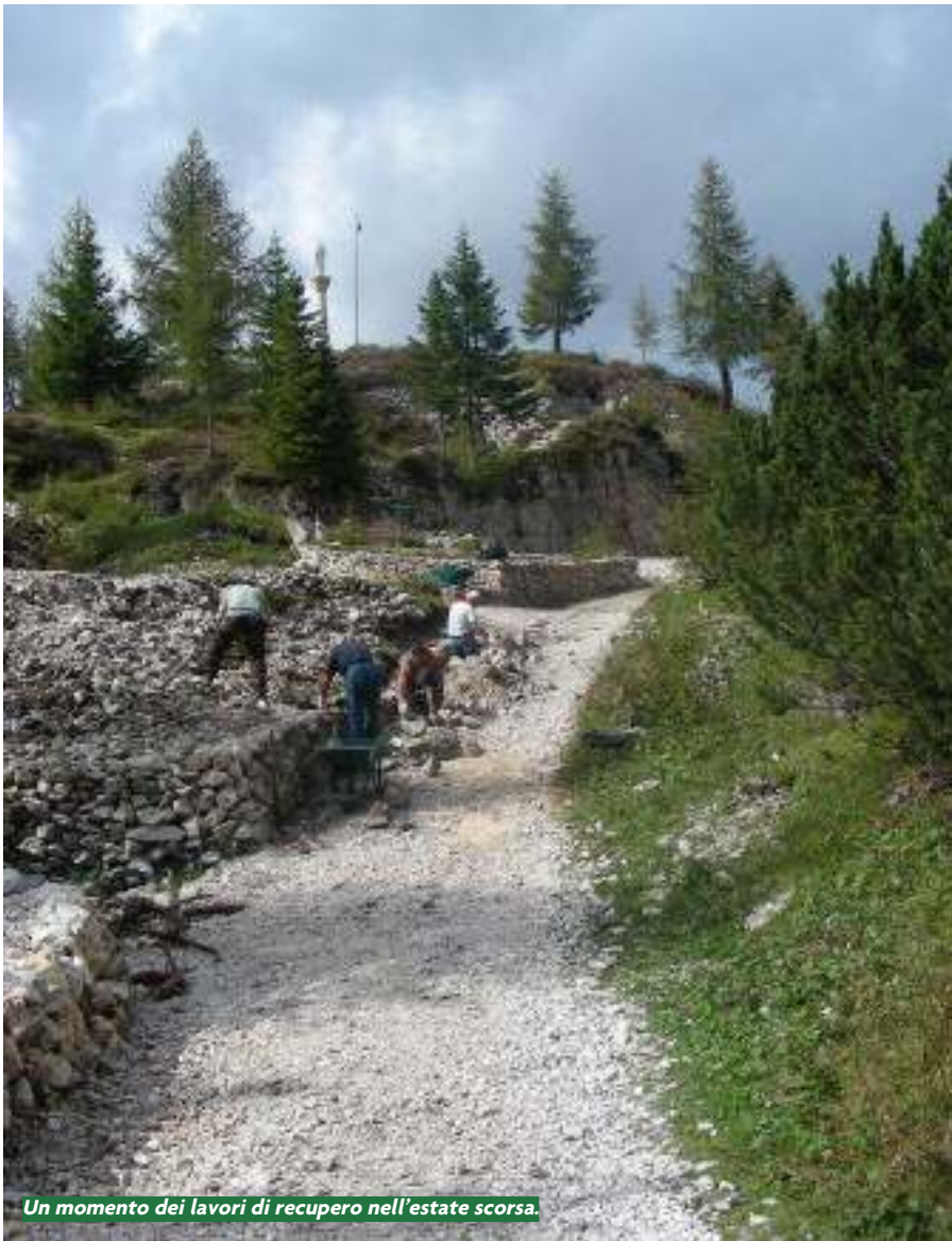
Un momento dei lavori di recupero nell'estate scorsa.