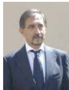
Ignazio La Russa

Nel rinnovare la mia profonda stima, Le giunga l'augurio più sincero per la vostra grande 82ª adunata nazionale.