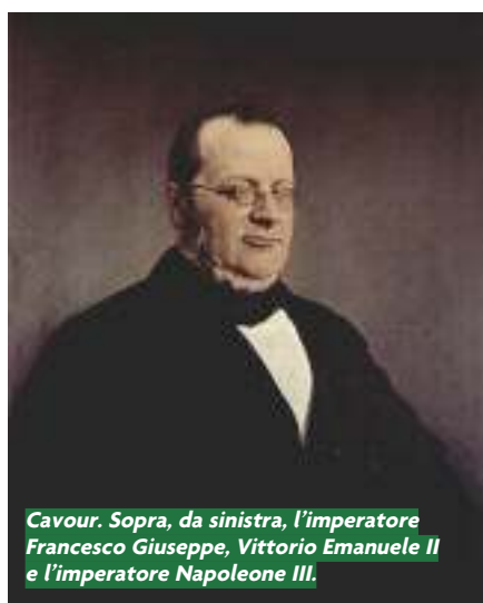
Cavour. Sopra, da sinistra, l'imperatore Francesco Giuseppe, Vittorio Emanuele II e l'imperatore Napoleone III.

La battaglia si combattè in tre località: Medole, Solferino e San Martino. Lo scontro iniziò a Medole (Mantova) alle 3 del mattino del 24 giugno 1859. Sul campo il IV Corpo d'Armata francese comandato dal generale Adolphe Niel e la Prima Armata Imperiale austriaca del feld-