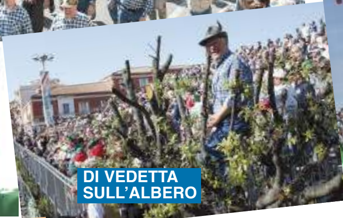
DI VEDETTA SULL'ALBERO