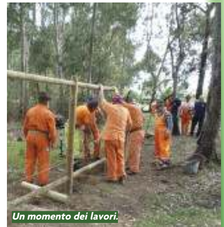
Un momento dei lavori.