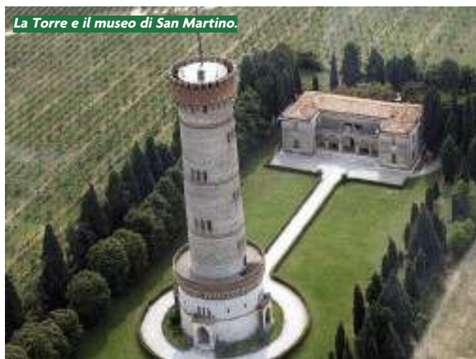
La Torre e il museo di San Martino.