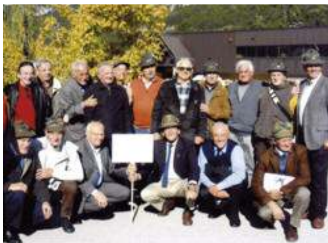
Ritrovo della 44ª batteria, gruppo Lanzo, 1°/63 in occasione del 45° anniversario dalla tragedia del Vajont, dopo la quale prestarono i primi soccorsi.