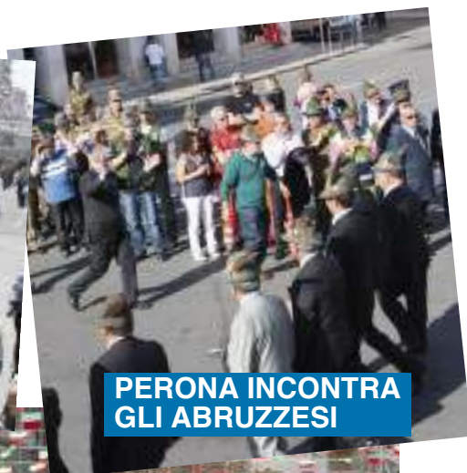
PERONA INCONTRA GLI ABRUZZESI