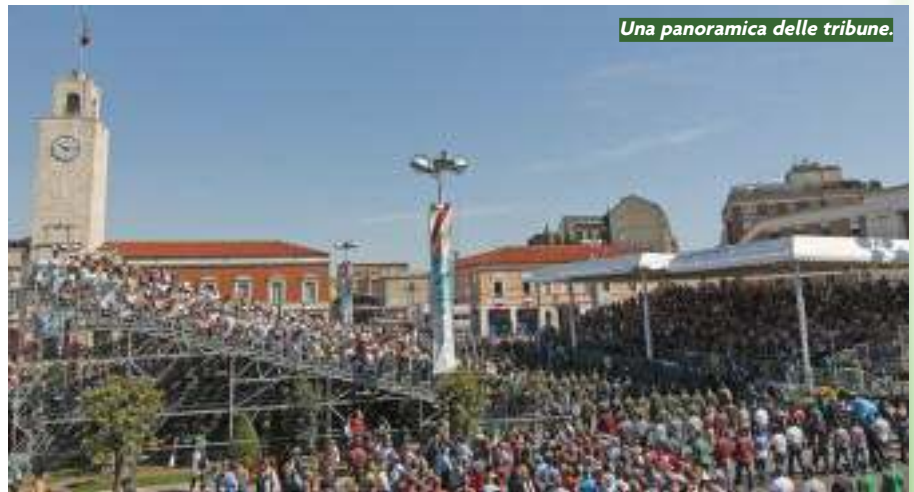
Una panoramica delle tribune.

Solenne per la grandezza dello spirito che ha avvolto Latina negli ultimi quattro giorni, prima con la baraonda variopinta e un po' folle delle migliaia di visi-