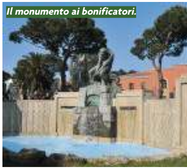
Il monumento ai bonificatori.

Piazza del Quadrato, una delle numerose aree verdi che abbelliscono la città di Latina, ospita il monumento ai bonificatori. È un'opera importante, assolutamente priva di retorica: ricorda la fatica di uomini e donne che, arrivati dal Friuli, Veneto, Romagna e da regioni del Sud per ricominciare una nuova vita, hanno trasformato una terra vergine in un giardino. Se l'adunata nazionale degli alpini si fa a Latina è anche per rendere omaggio a quei pionieri, molti di loro ex-combattenti della Grande Guerra e alpini. Hanno lavorato duramente, cominciando da salariati, mezzadri o concessionari dell'Opera Nazionale Combattenti, con due buoi, due vacche e una da latte. Le unità lavorative dovevano essere