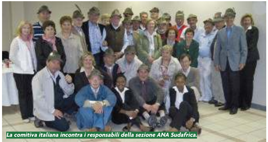
La comitiva italiana incontra i responsabili della sezione ANA Sudafrica.