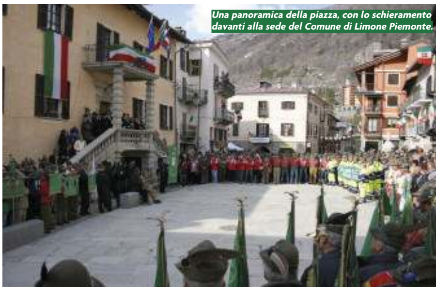
Una panoramica della piazza, con lo schieramento davanti alla sede del Comune di Limone Piemonte.