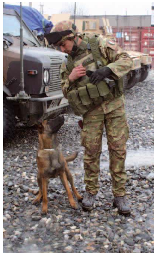
Con il fido cane addestrato nel fiutare gli esplosivi: un collaboratore indispensabile per la scoperta di arsenali nascosti.

L'esperienza, gli operatori specializzati del 32° reggimento l'hanno accumulata nel corso delle missioni all'estero, in paesi martoriati dalla guerra: Bosnia, Kosovo, Albania, Libano ed Afghanistan. Molto spesso gli ordigni sono fabbricati artigianalmente, con materiali di fortuna e riciclando materiale esplosivo di recupero: i cosiddetti IED, Improvised Explosive Devices , che comprendono – oltre alle mine – giubbotti imbottiti di tritolo, automobili o motociclette riempite di esplosivo ed ordigni