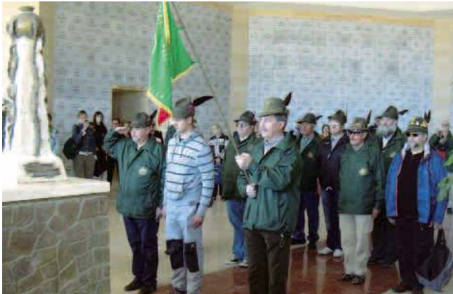
Il momento degli onori ai Caduti all'interno del Sacrario.

Il Gruppo di Arcella, nell'ambito dell'iniziativa "I percorsi della memoria", ha organizzato in febbraio un viaggio al Sacrario militare di El Alamein (Egitto) a cui hanno partecipato, oltre a numerosi alpini del Gruppo Arcella anche alpini dei gruppi di Piove di Sacco, Campodarsego, San Gregorio Magno (Padova) e Montegalda (Vicenza) oltre a congedati di altre armi (marina ed aviazione). Bella la cerimonia dell'alzabandiera eseguita davanti alla torre del Sacrario, durante la quale il suono del nostro inno nazionale si è diffuso sulla circostante piana desertica. Austeramente la cerimonia a ricordo dei Caduti con la deposizione di una corona di fiori, giunta direttamente dall'Italia, mentre aleggiavano le note del "Piave" e del "Silenzio". La cerimonia è terminata con la lettura della "Preghiera dell'Alpino". Era palpabile la commozione non solo degli alpini e anche di un gruppo di circa 160 italiani in visita al Sacrario, che hanno ringraziato per quanto gli alpini hanno fatto e sanno fare. Particolarmente cordiale è stato l'incontro con il ten.col. Carlo Emiliani, addetto militare all'ambasciata italiana al Cairo, che dopo aver assistito alla cerimonia ha accompagnato il gruppo nella visita al museo al quale è stato donato il "guidoncino" del Gruppo. ●