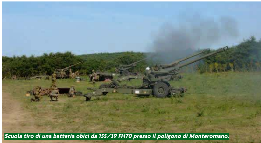
Scuola tiro di una batteria obici da 155/39 FH70 presso il poligono di Monteromano.