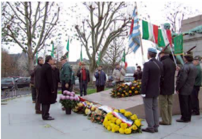
Nelle foto: due momenti degli onori ai Caduti, al "Monumento del Ricordo".