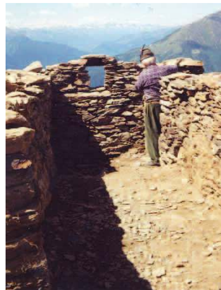
leri e oggi: alpini minatori al lavoro in una tunnel e una trincea del Montozzo, nei pressi del Tonale, che fa parte del grande museo all'aperto della Grande Guerra che si estende dalla Linea Cadorna al Carso.

alpini, singolarmente o in collaborazione con altri sodalizi ed enti, per bonificare e restaurare trincee, baraccamenti, postazioni e manufatti militari di ogni genere hanno contribuito a realizzare nel tempo un enorme museo all'aperto che – da ovest ad est, dalla mai utilizzata Linea Cadorna alle martoriolate trincee del Carso – rimane una viva testimonianza della fatica e del sacrificio pagati dai nostri padri per completare il Risorgimento d'Italia.