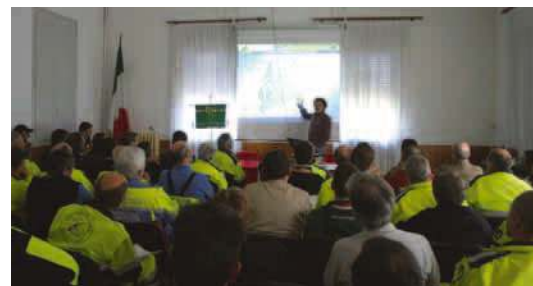
I volontari di protezione civile allo stage di aggiornamento.