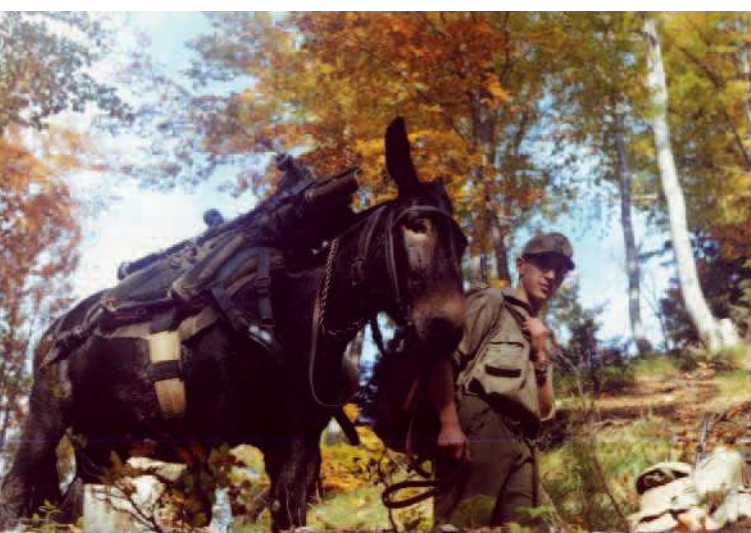
Trasporto someggiato della culla inferiore obice 105/14 della 24ª batteria gr. Belluno (settembre 1980 monte Lussari)

La fine della contrapposizione bipolare e l'insorgenza di nuovi scenari internazionali, che hanno determinato il progressivo passaggio da un esercito di leva a quello professionale per disporre di uno strumento commisurato alle nuove esigenze operative, hanno infine comportato l'ulteriore soppressione di altri gruppi di artiglieria. Diversamente dal passato, quando nelle brigate alpine il rapporto tra battaglioni alpini e gruppi di artiglieria da montagna era di uno a uno, al termine del processo di ristrutturazione durato più di dieci anni, in ambito brigata alpina c'è attualmente un solo reparto di artiglieria, a fronte di tre reparti di fanteria alpina, denominati reggimenti. Il reggimento di artiglieria, in organico alle due brigate alpine ha in dotazione due linee di materiali di armamento. Si tratta di 24 obici FH 70 da 155/39, trainati da moderni trattori che