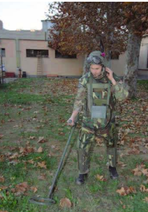
Un artigiere alpino alla ricerca di mine con il metal detector.

comandati a distanza. Vittime principali degli ordigni sono i civili, in particolare i bambini, visto che alcune munizioni hanno forme che attirano la curiosità per poi rivelarsi trappole letali. Per dare un'idea della gravità del fenomeno, solo a Kabul, l'ospedale ortopedico della Croce Rossa Internazionale di Ginevra (diretto dal piemontese Alberto Cairo) cura 6.000 persone l'anno, per lo più vittime di esplosioni. Senza contare chi perde la vita. Nelle varie missioni multinazionali, i genieri alpini svolgono in collaborazione con le agenzie delle Nazioni Unite, anche opera di prevenzione, tenendo lezioni di riconoscimento degli ordigni esplosivi e di comportamento ad un pubblico selezionato: bambini delle scuole e forze armate locali.