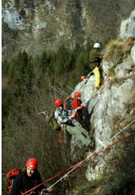
Le squadre alpinistiche durante la discesa in corda doppia nello zaino.