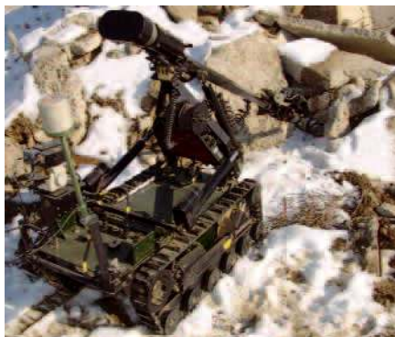
Il robot teleguidato che consente di disattivare un ordigno ad alta pericolosità.

H anno compiuto oltre 180 interventi e rimosso ben 440 ordigni: è il bilancio di due anni di attività degli specialisti del 32° reggimento genio guastatori alpini della Brigata "Taurinense", di stanza a Torino. Un tempo si usava il termine "artigieri" per indicare chi trova, identifica, neutralizza e poi distrugge residui bellici e affini. Oggi, i genieri dell'Esercito adoperano una sigla inglese, EOD, che sta per Explosive Ordnance Disposal , cioè bonifica ordigni esplosivi: esattamente il compito che assolvono dal 1° aprile del 2006, giorno in cui hanno assunto la responsabilità per tutto il territorio italiano del nordovest.