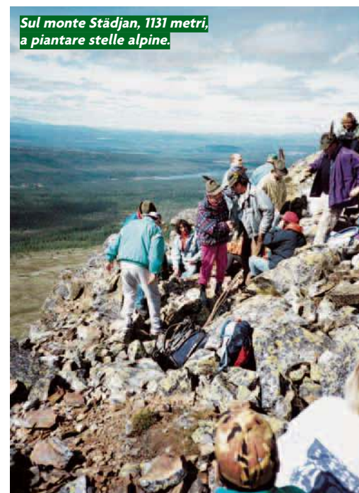
Sul monte Städdjan, 1131 metri, a piantare stelle alpine.