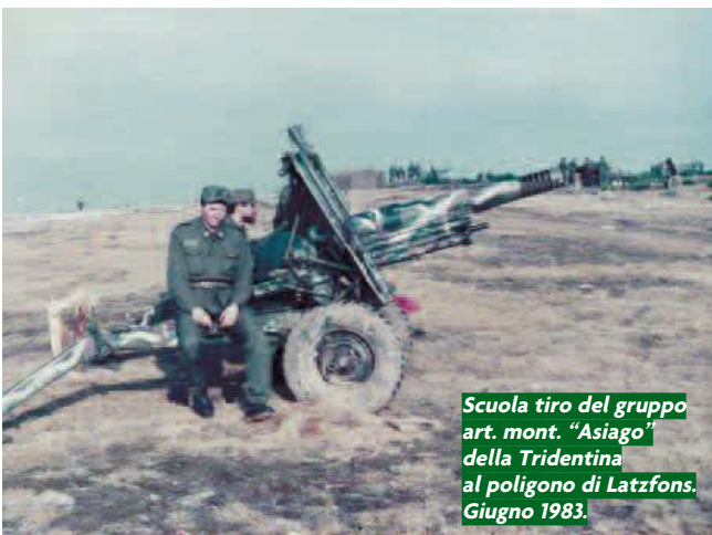
Scuola tiro del gruppo art. mont. "Asiago" della Tridentina al poligono di Latzfons. Giugno 1983.