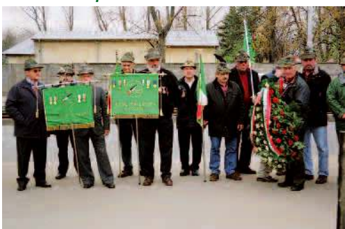
Gli alpini delle sezioni di Palmanova e Bassano del Grappa con la corona di fiori per i Caduti che riposano nel cimitero di guerra italiano.