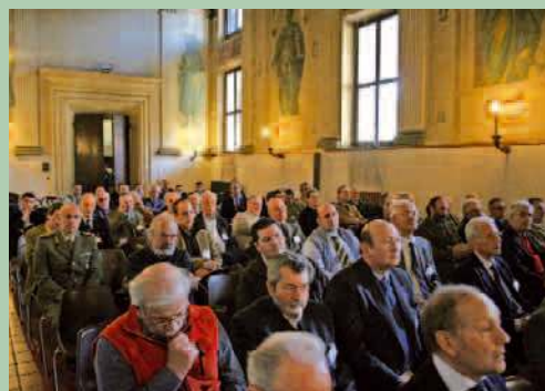
Uno scorcio del bellissimo salone dell'abbazia olivetana di Rodengo Saiano.

Una calorosa esortazione è venuta dal consigliere nazionale Cesare Lavizzari, che ha sottolineato la necessità della collaborazione delle Sezioni a tutti i progetti nazionali e l'importanza di fornire risposte adeguate entro i termini stabiliti, per consentire agli uffici di lavorare con serenità ed efficacia. Lavizzari, infine, ribadendo l'importanza strategica del Centro Studi per la conservazione e diffusione del nostro