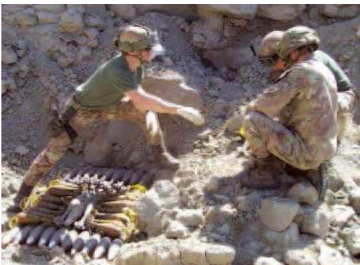
Alcuni genieri impegnati nella preparazione della buca di brillamento degli ordigni recuperati.