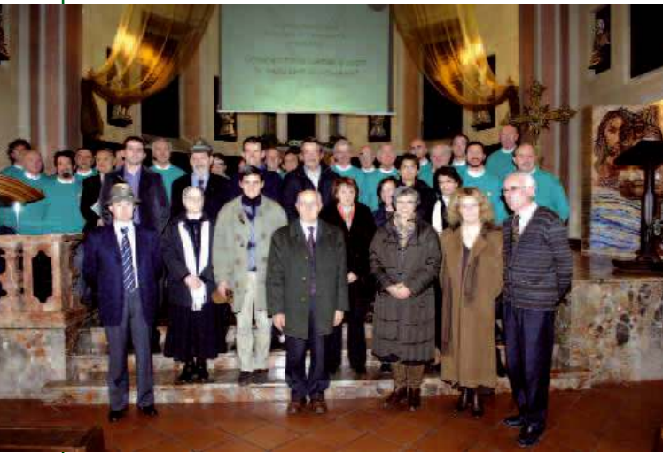
Il coro ANA Campo dei Fiori del gruppo di Varese durante un concerto di beneficenza con alcuni rappresentanti degli enti beneficiati.

Da molti anni gli alpini del gruppo di Varese sostengono con i fondi raccolti con le loro iniziative ed il lavoro di volontariato numerose associazioni che operano sia sul territorio varesino che in Africa. Nel corso di circa un decennio il gruppo ha donato 3 auto e un pullmino per disabili, e quest'anno ha contribuito in maniera significativa all'acquisto di un nuovo mezzo e ha donato una somma di denaro a 14 associazioni. La solidarietà è caratteristica degli alpini insieme alla riservatezza e gli alpini del gruppo di Varese ne sono la dimostrazione. ●