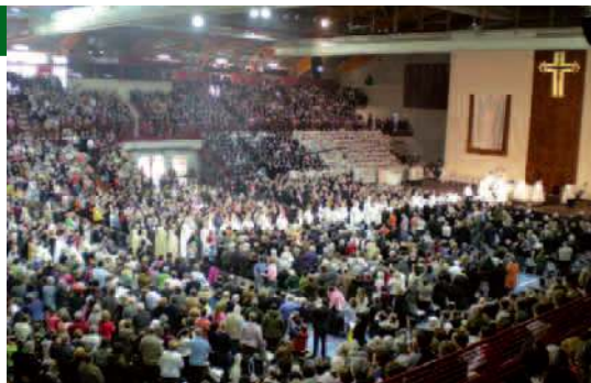
Il palazzetto dello sport di Novara gremito di fedeli.

Gli alpini sono stati chiamati dalla diocesi a sovrintendere all'afflusso di migliaia di fedeli al palazzetto dello Sport di Novara in occasione della beatificazione del filosofo spiritualista don Antonio Rosmini. Rosmini, nato a Rovereto nel 1797, si stabilì sul lago Maggiore a Domodossola. Fu proprio in questa città che nel 1828 fondò sul sacro monte Calvario l'Istituto della Carità, primo germe dell'ordine dei Rosminiani e delle suore della Provvidenza. A circa 150 anni dalla scomparsa di Rosmini la pratica di beatificazione chiesta dal vescovo di Novara, Renato Corti, è stata accolta e la beatificazione ha potuto essere dichiarata in forma solenne a Novara, presente per il papa il car-