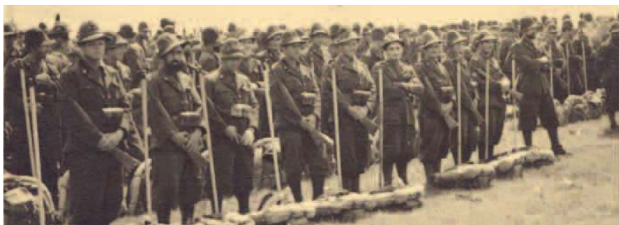
Piana di Zabliek (Montenegro) – 13 agosto 1942. La 259ª compagnia del btg. Val Leogra alla rivista passata da S.E. il gen. Pirzio Biroli governatore del Montenegro.

Quando giunsi al termine della lettura del diario – fortunatamente ritrovato qualche anno fa – mi dissi che la storia di quegli alpini, con i loro patimenti, i loro eroismi e le loro speranze, avrebbe dovuto essere conosciuta, pubblicata. Ma ben presto mi resi conto che nessun editore avrebbe mai pubblicato il diario di una guerra lontana nel tempo, dimenticata, spinta nell'oblio dalla successiva immane tragedia della guerra di Russia. E oltretutto privo dei nomi dei protagonisti (indicati solo con