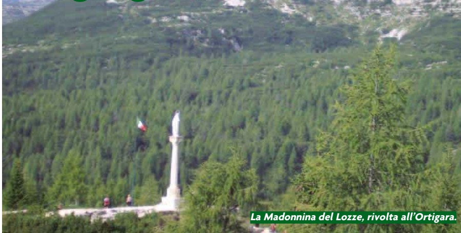
La Madonnina del Lozze, rivolta all'Ortigara.