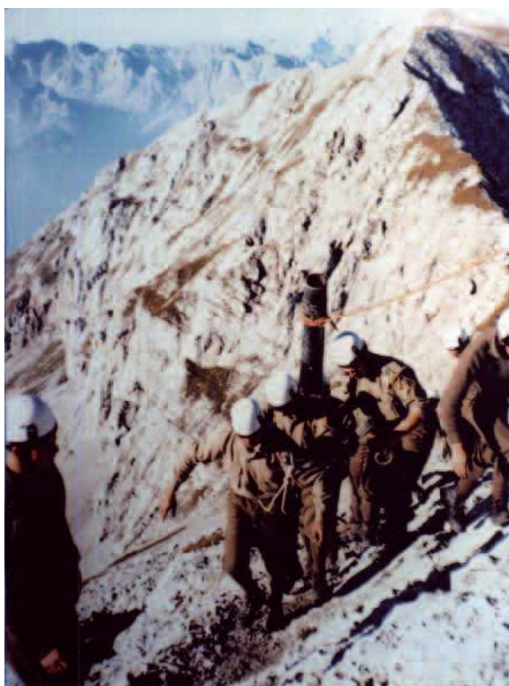
Escursioni Estive - Monte Bivera - 24ª btr. gr. Belluno. Ascensione spalleggiata bocca da fuoco obice 105/14

N on hanno mai avuto particolare successo i tentativi di realizzare un mezzo meccanico che potesse sostituire, potenziandole, le funzioni svolte dal mulo. Alla fine degli anni Sessanta sono stati distribuiti ai battaglioni logistici delle brigate i muli meccanici, Moto Guzzi tre per tre, che hanno avuto breve vita operativa. Alla fine degli anni Settanta sono stati introdotti in servizio i motocarrelli, che pur sottoposti a successivi miglioramenti meccanici e tecnologici, si sono rivelati comunque inadeguati a sostituire il mulo, rimasto fino alla fine della guerra fredda il protagonista del trasporto operativo e logistico in alta montagna, ovvero in presenza di vie di comunicazioni limitate al movimento appiedato. Nei primi anni Ottanta, per rispondere alla esigenza di dotare la brigata alpina di una artiglieria di supporto generale – incaricata di battere gli obiettivi di responsabilità della brigata – ad un gruppo sui tre in organico alla grande unità, i pezzi da 105/14 vennero sostituiti con pezzi da campagna da 155/23 trainati da trattori TM 69. Dalla fine degli anni Ottanta, caduto il muro di Berlino, le cose cambiarono