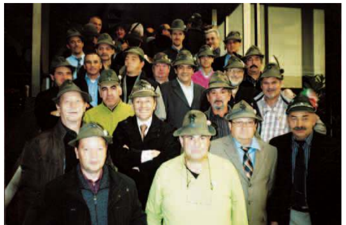
Raduno alla caserma Pieve di Cadore degli alpini del 7° che 50 anni fa erano a Pieve di Cadore.