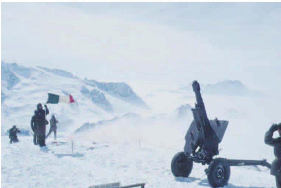
Schieramento in alta quota dell'obice da 105/14 durante le escursioni.

dispongono anche di una cabina per il trasporto dei serventi, e di 6 mortai rigati Thomson da 120 millimetri di fabbricazione francese, trainati da VM90. Sotto il profilo tecnico artiglieresco, il reggimento per l'impiego dell'obice FH70 dispone di un sistema per il calcolo dei dati di tiro denominato SAGAT (Sistema di Automazione per il Gruppo Artiglieria Terrestre). Dispone inoltre di moderni sistemi per la rilevazione dei dati topografici, l'acquisizione degli obiettivi e la sorveglianza del campo di battaglia. Gli artiglieri da montagna, come avviene per gli alpini, pur provenendo per la gran parte dalle regioni del Sud d'Italia, una volta completata presso i reggimenti di addestramento volontari la formazione di base e, presso i rispettivi reparti, i corsi formativi di ciascun incarico, svolgono l'attività di