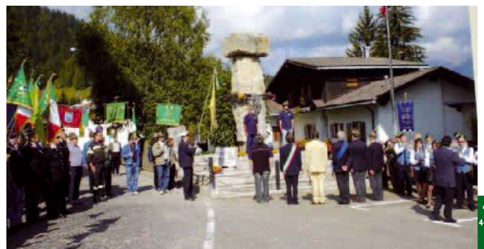
Gli onori ai Caduti prima dell'inaugurazione della nuova sede di gruppo.