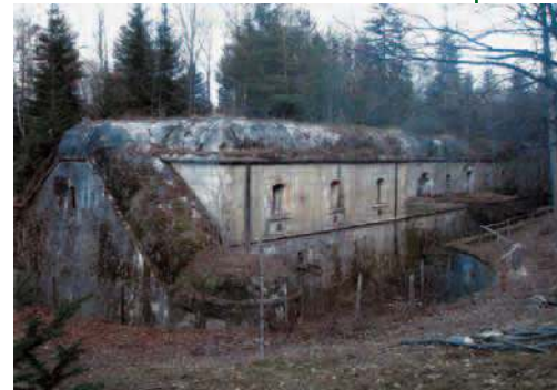
Il forte Sertou.

Nel Comune di Tirano, località Canali, sorge il "Forte Sertou" di proprietà del Demanio Militare, costruito agli inizi del secolo scorso, negli anni immediatamente precedenti la Grande Guerra, con lo scopo di proteggere la provincia dall'eventuale invasione di truppe austro-ungariche. Il forte, sullo stile di