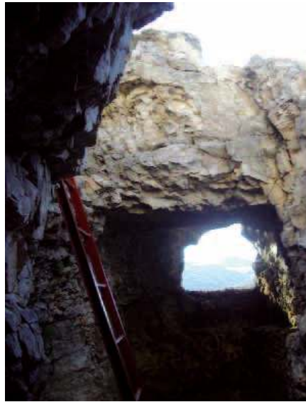
Due postazioni della Grande Guerra sull'Ortigara

• Ogni partecipante, a seconda dell'attività dovrà avere al seguito i dispositivi di protezione individuali (DPI) adeguati alle operazioni da compiere. Maggiori indicazioni saranno date dal tutor.