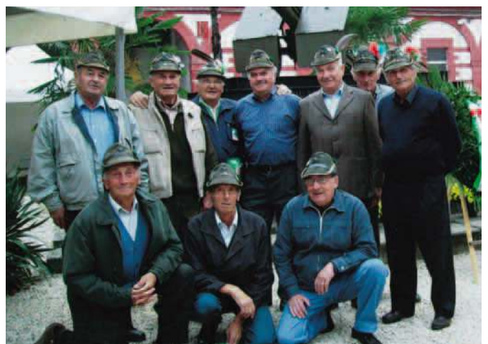
Di nuovo insieme dopo 47 anni. Sono gli autisti del reparto comando, negli anni '59/60 al 13° raduno degli artiglieri da montagna del gruppo Aosta, di Saluzzo.