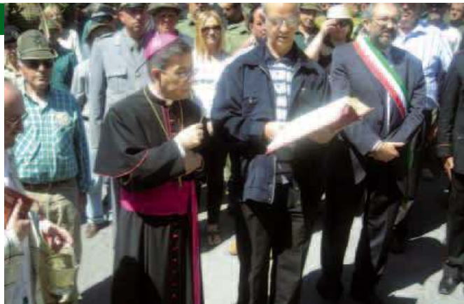
Nelle foto il vescovo di Isernia Venafro mons. Salvatore Visco e il ricostituito gruppo Mainarde.

È seguita la sfilata per le vie del paese e la celebrazione della S. Messa, accompagnata dal coro di Colli a Volturno. (Paolo Mastracchio)