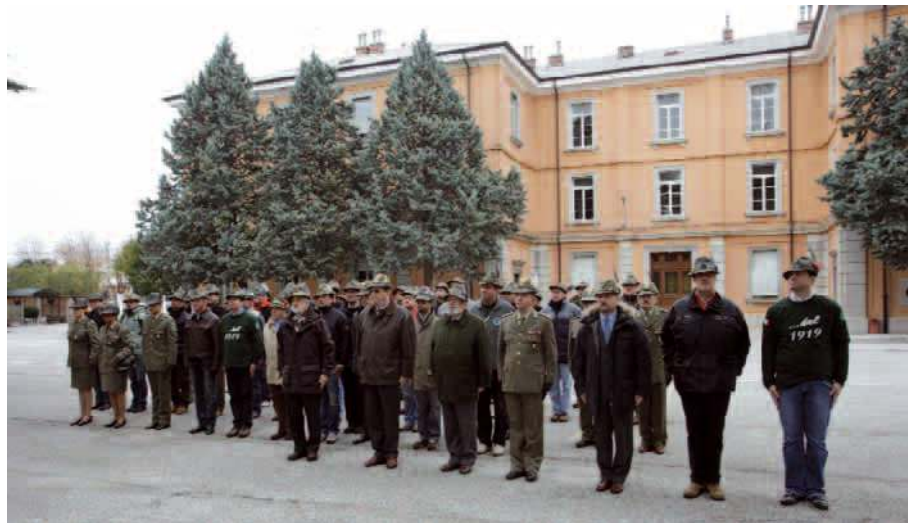
La resa degli onori ai Caduti.