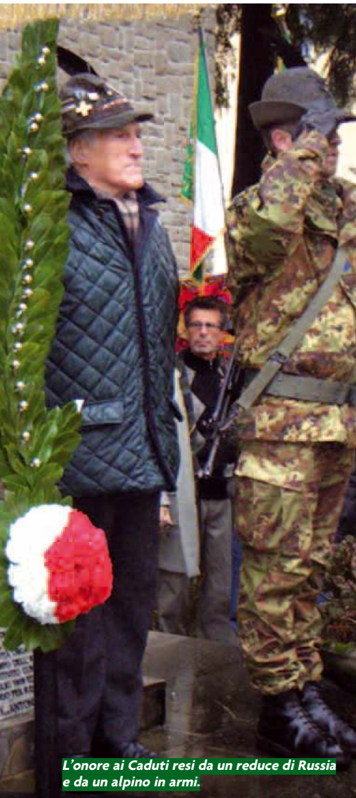
L'onore ai Caduti resi da un reduce di Russia e da un alpino in armi.