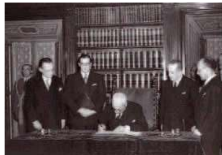
La firma della Costituzione da parte di Enrico De Nicola, Alcide De Gasperi e Umberto Terracini.

Spostiamo l'obiettivo su quello che non funziona. La gestione della "macchina Stato", con un andamento in costante degrado, è stata, e continua ad essere, per essere generosi, inadeguata. Debito pubblico, ingovernabilità, costo della politica, mancanza di senso dello