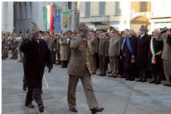
Lo schieramento con il nostro Labaro e quello dell'UNIRR, il picchetto del 1° rgt. da montagna e le tre Bandiere di guerra. A destra, il gen. C.A. Armando Novelli durante la rassegna di sabato pomeriggio in Piazza della Loggia, con il presidente Corrado Perona.

Come l'Ortigara richiama il simbolo più significativo del sacrificio degli alpini nella Grande Guerra, così Nikolajewka riconduce alla tragedia più grande – se fosse possibile tracciare una classifica del dolore – che ha coinvolto gli alpini nel secondo conflitto mondiale. Nikolajewka è un simbolo della memoria, e che oggi questo nome figuri soltanto nelle vecchie carte topografiche, sostituito dal moderno e sereno Livenka, rende ancor più profondo l'archetipo d'una tragedia che non potrà mai essere dimenticata. La ricorrenza viene celebrata con particolare solennità a Brescia, dove gli alpini hanno costruito l'istituto per miodistrofici "Nikolajewka", un nome che comprende tutto: il sacrificio di tanti alpini, la memoria, la solidarietà e il desiderio di pace. Quest'anno, 65° anniversario della battaglia, c'erano il presidente nazionale Corrado Perona con il Consiglio direttivo nazionale, il comandante delle Truppe alpine gen. di Corpo d'Armata Armando Novelli ed il generale di divisione Bruno Petti, una rappresentanza dell'UNIRR, l'Unione nazionale reduci di Russia con il Labaro, il sindaco di Brescia Paolo Corsini, il presidente della Provincia Alberto