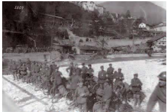
Foto a sinistra: soldati germanici attraversano il Tagliamento su una passerella di fortuna (inizio novembre 1917). Foto a destra: ciclisti germanici nell'Isonzo presso Tolmino, fine ottobre 1917.