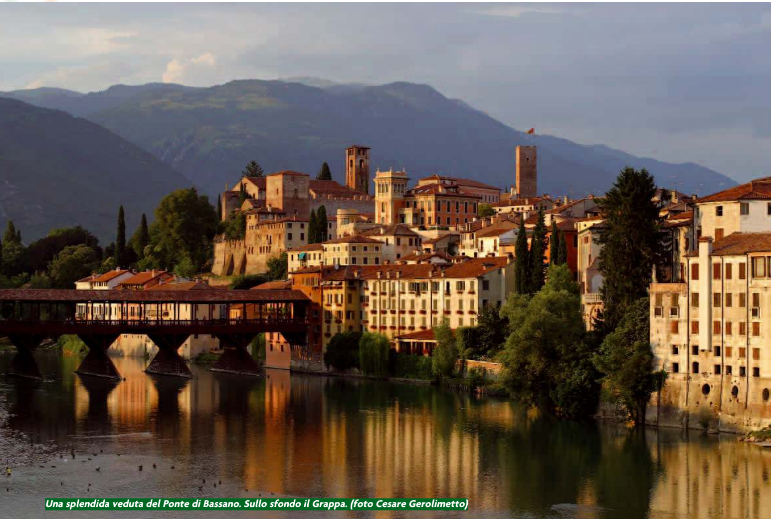
Una splendida veduta del Ponte di Bassano. Sullo sfondo il Grappa.