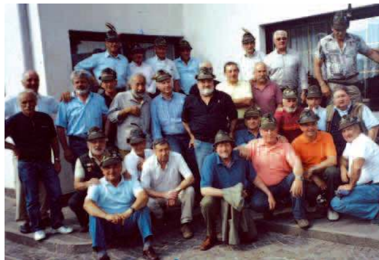
Gli alpini paracadutisti del 1°/66 hanno festeggiato il 41° anniversario dalla naja.