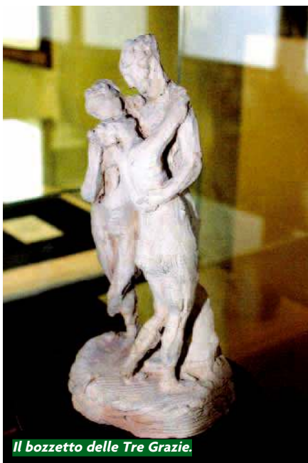
Il bozzetto delle Tre Grazie.

disegni oltre bozzetti, dipinti, modelli e calchi: compreso il primo bozzetto originale - acquisito dal Comune - delle “Tre grazie”, il capolavoro di marmo conservato all'Hermitage di San Pietroburgo.