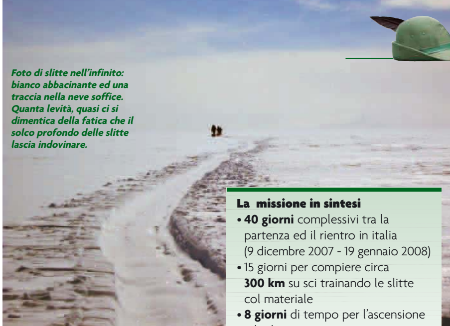
Foto di slitte nell'infinito: bianco abbagliante ed una traccia nella neve soffice. Quanta levità, quasi ci si dimentica della fatica che il solco profondo delle slitte lascia indovinare.

Il percorso è stato compiuto sugli sci fino alla quota 2.800. Dopo aver riposato, il 5° giorno sono ripartiti alle ore 10 per l'ultimo balzo, la meta cui puntavano da mesi. Quando hanno raggiunto la vetta sono velocemente cambiate le condizioni meteorologiche, che hanno costretto il quartetto a riprendere la discesa per raggiungere il campo alto alle 19. ●