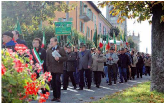
Un momento della sfilata.