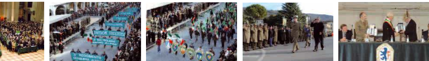
Nelle foto, immagini della due giorni.