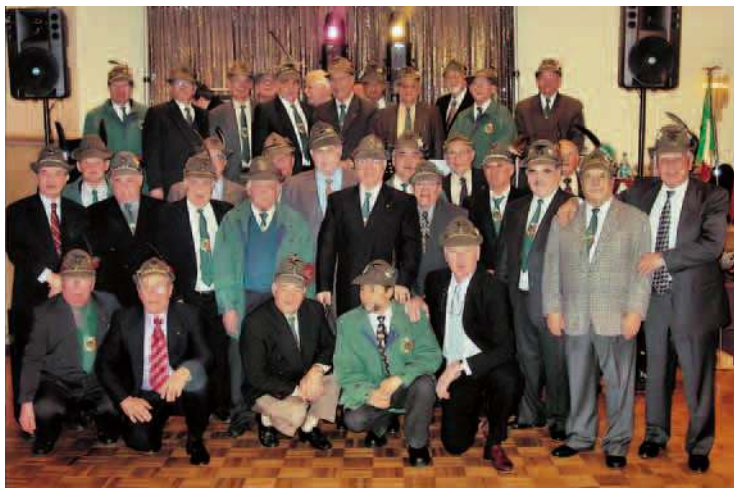
Nella foto, il gruppo di soci di Laval.

Durante la serata sono stati consegnati certificati di benemerita ai soci reduci di guerra. ●