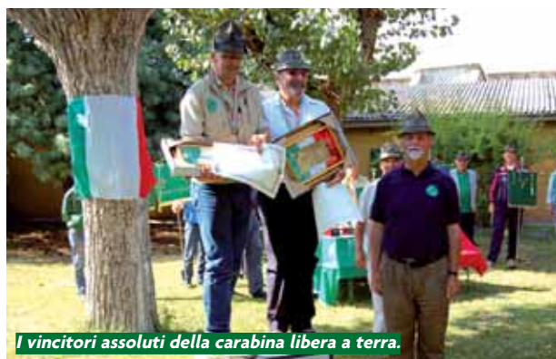
I vincitori assoluti della carabina libera a terra.

L '1 e 2 settembre la sezione di Parma ha avuto l'onore di ospitare, per la prima volta nei suoi 86 anni di vita, i campionati nazionali A.N.A. di tiro a segno per le specialità individuali e a squadre di pistola standard e di carabina libera a terra, giunti rispettivamente alla 24ª e 38ª edizione. Teatro dell'importante manifestazione è stato lo storico impianto di tiro a segno nazionale di Parma risalente al 1862, che anche se poco conosciuto è ad oggi, dopo un attento ed impegnativo lavoro di ristrutturazione, uno fra i migliori poligoni di tiro in Italia.