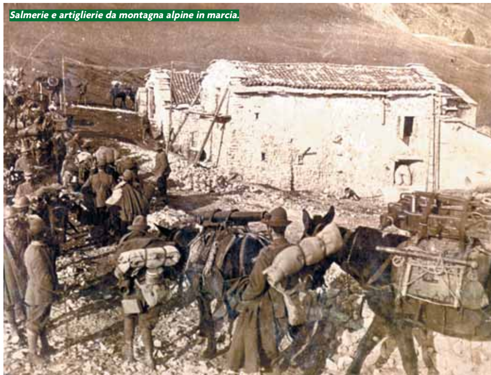
Salmerie e artiglierie da montagna alpine in marcia.

Rosa" sul Monte Pertica, che varranno la promozione per merito di guerra al suo comandante maggiore Benedetti, a scrivere la parola "fine", il 16 novembre, alla crisi più pericolosa del Grappa e ai sogni del I Corpo d'Armata austro-ungarico di raggiungere la pianura. Forse in poche altre occasioni come in questa fase decisiva della "battaglia d'arresto", i reparti alpini operarono secondo lo spirito con cui erano nati, agendo con un'ampia autonomia,