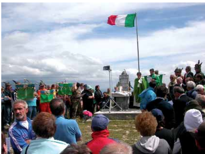
La celebrazione della S. Messa.