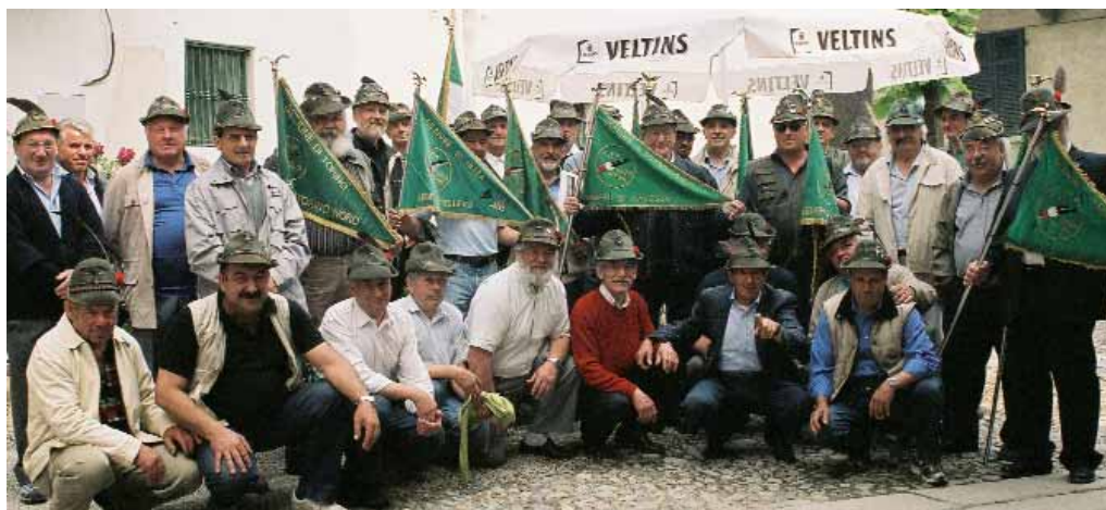
Si sono ritrovati a Baveno (Verbania) per il sesto raduno gli alpini del btg. Aosta, anni '64/'65 e '66 e del 6° corso A.C.S. della S.M.A.L.P. a più di 40 anni dal congedo.