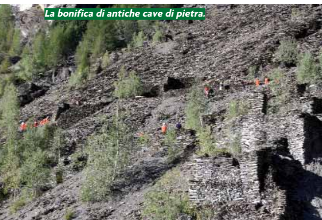
La bonifica di antiche cave di pietra.