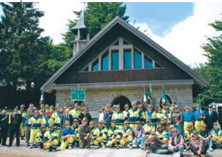
Un gruppo di volontari della Protezione civile della Sezione.