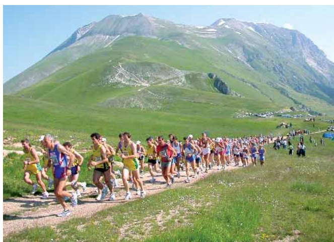
La partenza delle centinaia di concorrenti.