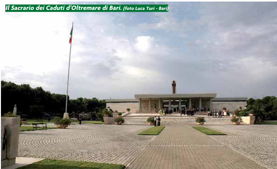
Il Sacrario dei Caduti d'Oltremare di Bari.