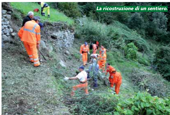
La ricostruzione di un sentiero.