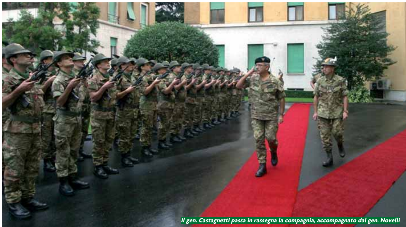
Il gen. Castagnetti passa in rassegna la compagnia, accompagnato dal gen. Novelli

Il capo di Stato Maggiore dell'Esercito, generale di Corpo d'Armata Fabrizio Castagnetti, che recentemente ha sostituito il generale Filiberto Cecchi al vertice della Forza Armata, ha fatto visita al Comando delle Truppe alpine. Lo ha accolto il generale di C.A. Armando Novelli che, dopo gli onori all'ospite resi da un picchetto di alpini in armi, ha illustrato al capo di Stato Maggiore l'attuale situazione delle Truppe alpine impiegate nelle missioni di supporto alla pace in atto e le principali attività addestrative in corso in vista dei