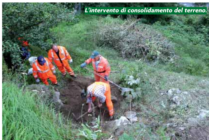
L'intervento di consolidamento del terreno.