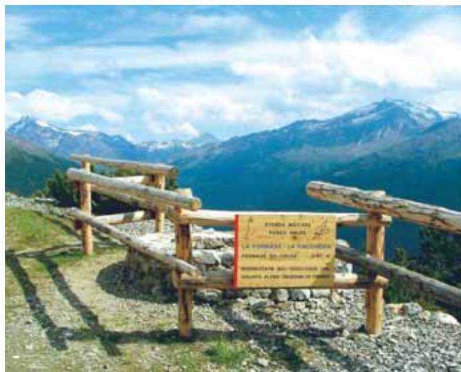
La fornace in calce ristrutturata dagli alpini.