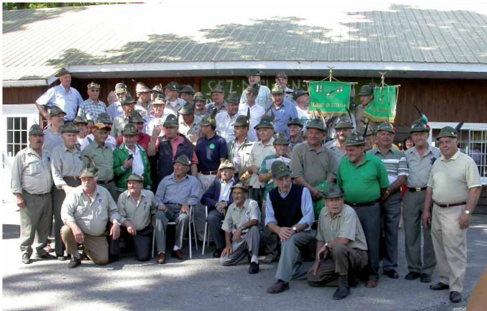
Foto di gruppo con le penne nere di Ottawa.

Il giorno 28 partenza da New York ed arrivo a Toronto dove il coro alpino "Stella del Gran Sasso" della sezione Abruzzi, arrivato in giornata, ha dato un entusiasmante concerto. Il giorno