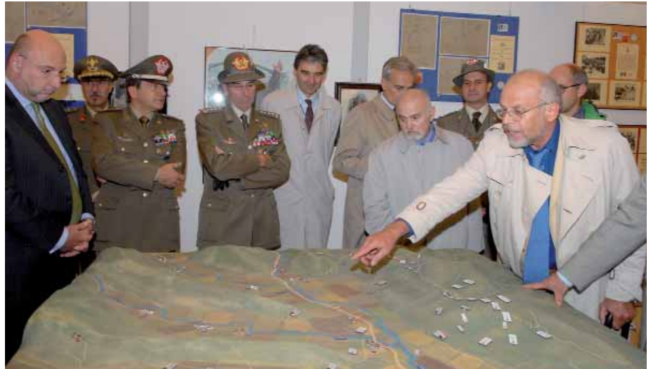
Un calco della linea del fronte illustrato al comandante delle Truppe alpine gen. Novelli.

I temi affrontati nei tre giorni del convegno sono stati quanto mai diversi e dibattuti con una rilettura innovativa dei momenti salienti della 1ª Guerra