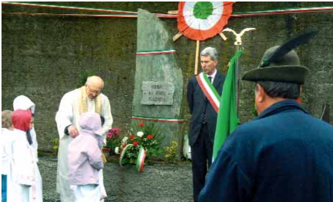
Nella foto: il parroco e il sindaco davanti al monumento ai Caduti, con alcuni scolari.