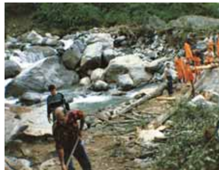
Nella foto: la costruzione di una passerella su un torrente nei giorni dell'alluvione del 1987.

La giornata luminosissima, i contrasti della sera, l'acqua limpidissima del torrente ritornato nel suo alveo, i pascoli verdi, rimersi dal ghiaione e