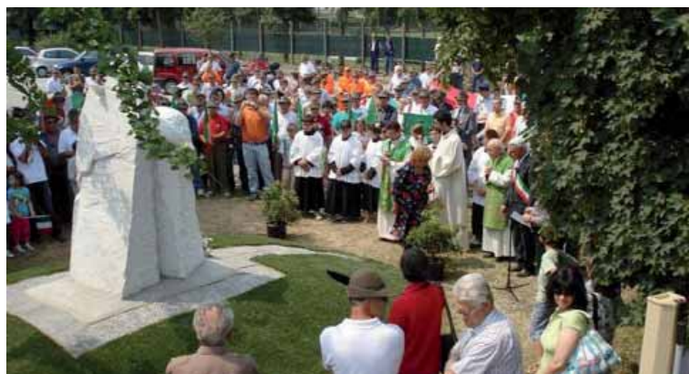
Nelle foto: il momento della benedizione e un primo piano del monumento agli Alpini.