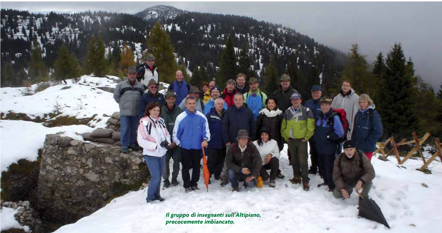
Il gruppo di insegnanti sull'Altopiano, precocemente imbiancato.