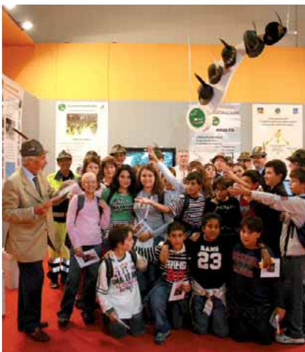
Una scolaresca in visita allo stand dell'ANA all'Expo.