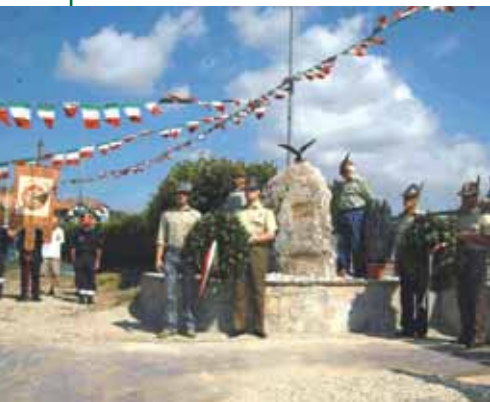
Il monumento ai Caduti.