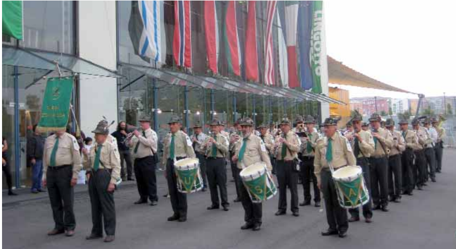
La fanfara della Sezione Val Susa.

nascita di un turismo focalizzato nell'intero arco dell'anno. Al Lingotto sono stati 150 gli espositori, che hanno occupato una superficie complessiva di 10.000 metri quadri. La rassegna, molto curata, ha accompagnato gli oltre 20.000 visitatori attraverso quattro tunnel tematici dove, grazie a ricostruzioni scenografiche con immagini, suoni, profumi e colori, si è potuta scoprire la montagna in tutte le sue valenze: cultura, abitabilità, risorse e sapori. In molti hanno anche assistito ad uno dei convegni (ospite, sabato pomeriggio, il premier Romano Prodi) che hanno tracciato nuove sfide in merito alla politica della montagna, al clima e alle energie rinnovabili. Tra i 60 espositori non commerciali, nell'area dedicata alla cultura della montagna, c'era lo stand dell'Associazione Nazionale Alpini, allestito con il contributo delle penne nere della sezione di Torino guidata da Giorgio Chiosso.