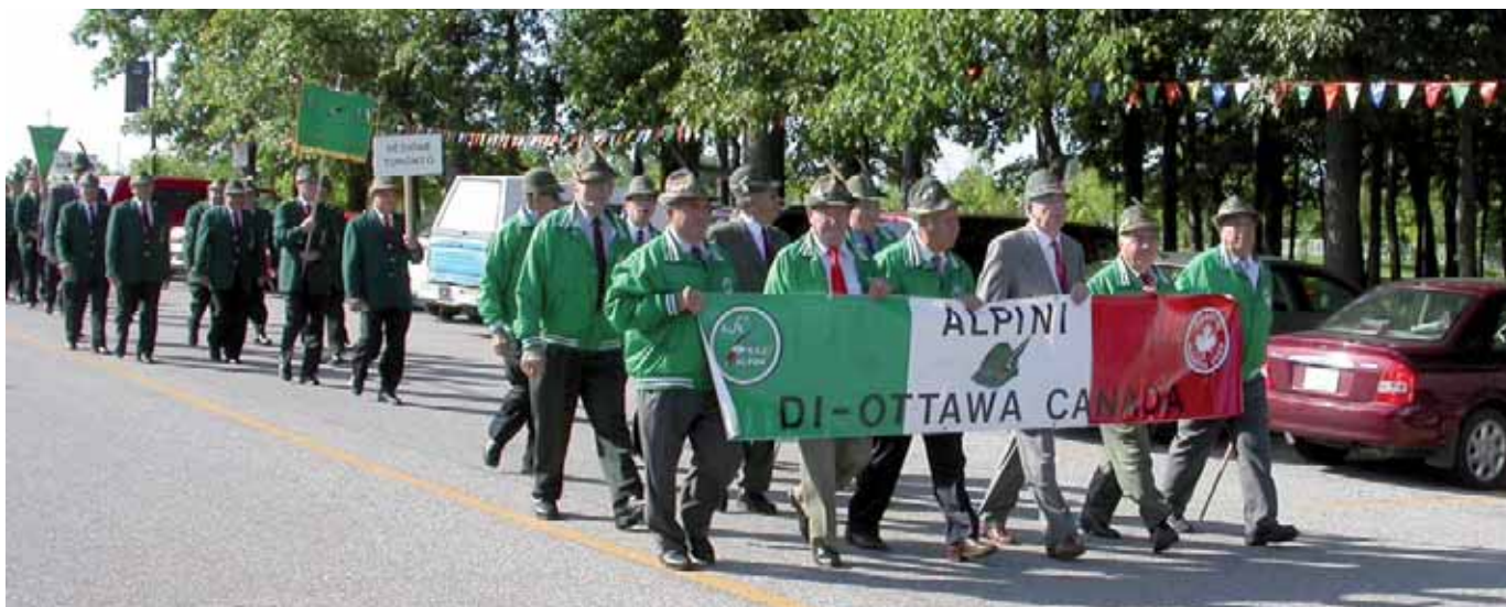
Uno scorcio della sfilata. Nelle immagini della pagina seguente, momenti della sfilata.