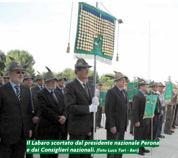
Il Labaro scortato dal presidente nazionale Perona e dai Consiglieri nazionali.