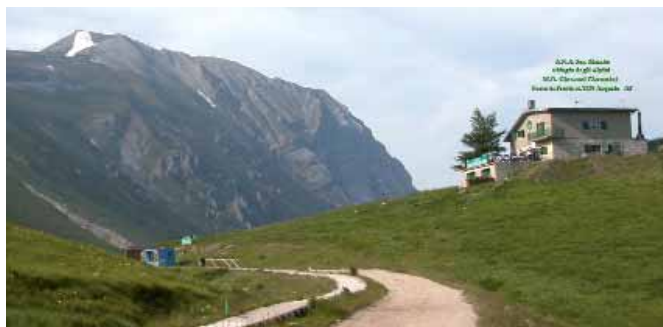
Il rifugio Giacomini, a Forca di Presta.

L'edizione della manifestazione di quest'anno ha visto la partecipazione di oltre duemila appassionati, e di molte autorità civili e mili-