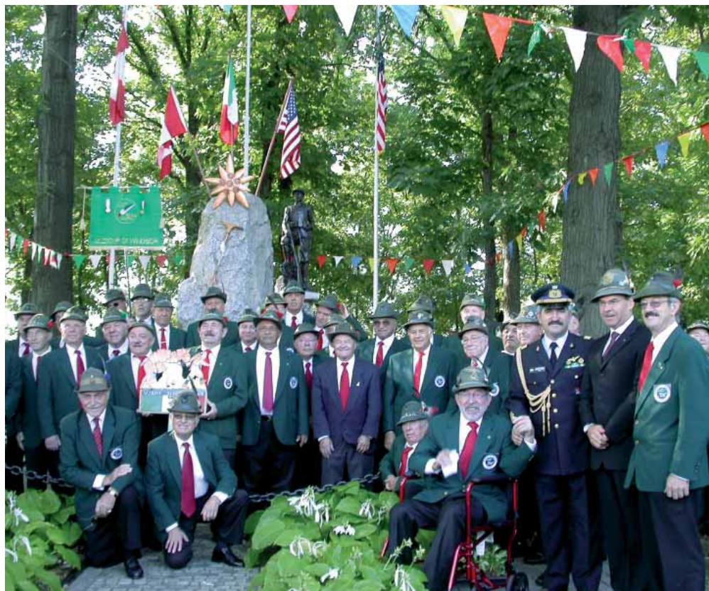
Gli alpini della Sezione di Windsor.