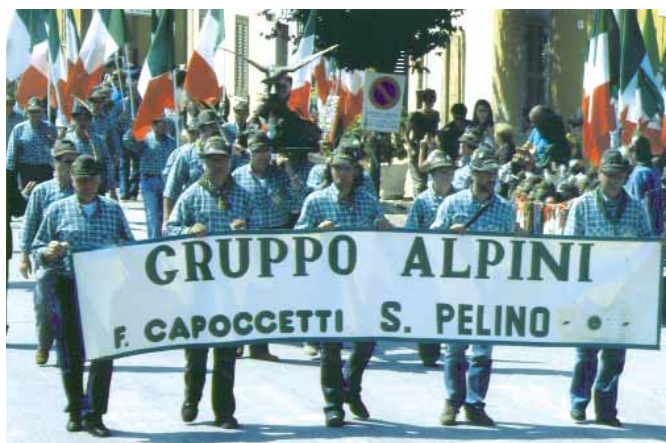
Un momento della sfilata per le vie di San Pelino.