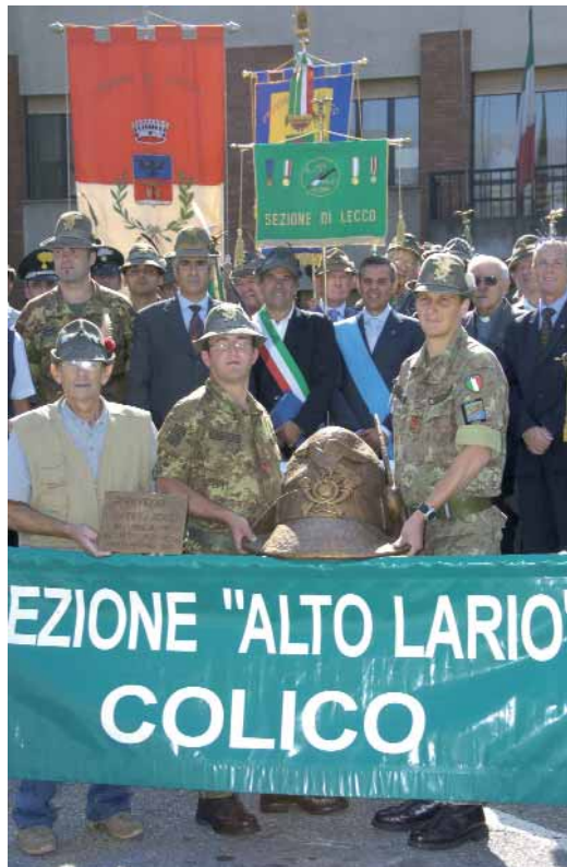
Il cappello alpino consegnato dagli alpini di Colico.