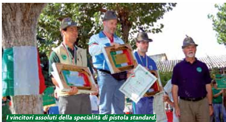
I vincitori assoluti della specialità di pistola standard.