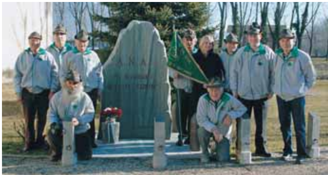
Nella foto: alcuni alpini del gruppo

Il gruppo di Sant'Antonino di Susa ha festeggiato l'80° anno di fondazione con una sfilata lungo le vie del paese e una mostra sugli alpini in tempo di guerra e di pace. E' stato inoltre raccolto del materiale scolastico che sarà distribuito ai bambini afgani dagli alpini del 3° in missione di pace a Kabul. Nelle due serate precedenti alla manifestazione si erano esibiti il coro alpino Valsusa e la fanfara sezione. ●