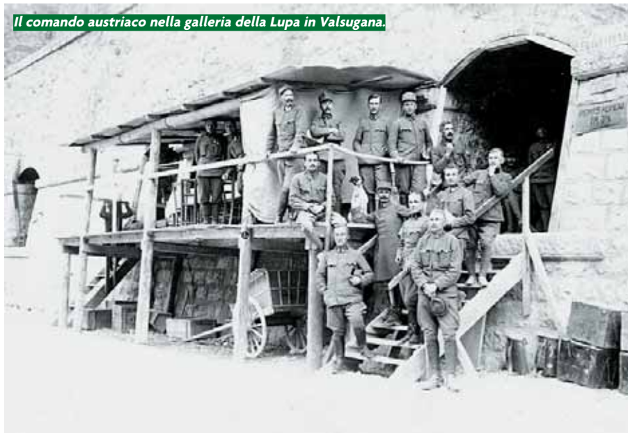
Il comando austriaco nella galleria della Lupa in Valsugana.

guerra nella pianura veneta da un lato, e quella di resistere e di impedire al nemico di raggiungere i suoi obiettivi dall'altro. Anche quando ciò avveniva, come per gli alpini del "Feltre", del "Monte Pavione" o del "Val Cismon", con le proprie case e le rispettive famiglie stese ai piedi del monte, in mano al nemico e, ancor peggio, bersaglio inevitabile delle artiglierie italiane. La ritirata dal Cadore, con i suoi evitabili ritardi ed il conseguente disastro di Longarone, e quella dal Primiero, avvenuta sotto la pressione del XX Corpo d'Armata austriaco,