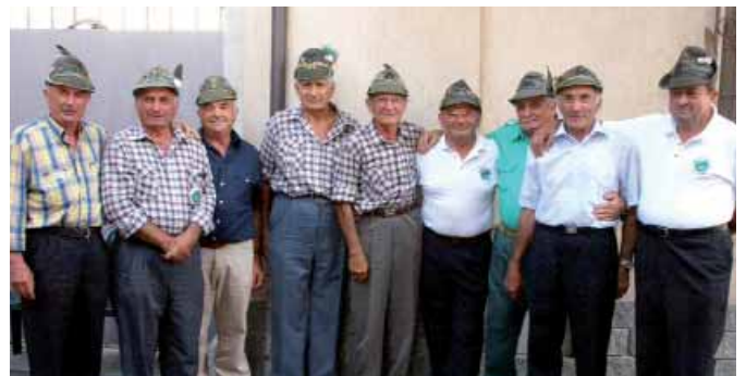
Al raduno della Julia a Caselle Torinese, si sono ritrovati i coscritti della classe '38 della sezione Torino che nel 1959 erano in Friuli e in Piemonte.