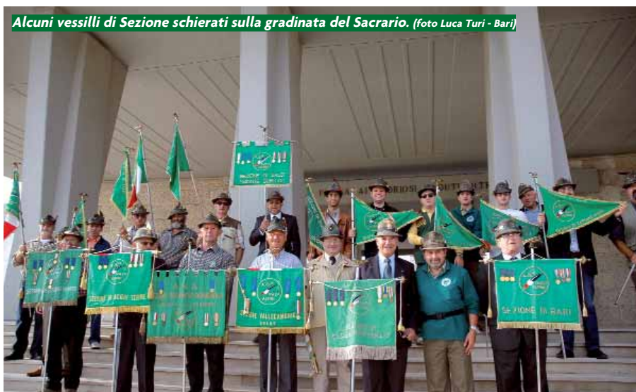
Alcuni vessilli di Sezione schierati sulla gradinata del Sacrario.

Domenica 7, alle 9,45, sull'incantevole Rotonda situata a metà strada del lungomare a sud della città, abbellita da dodici getti d'acqua e da una vegetazione ancora piena di vigore, l'alzabandiera. Non è stata una cerimonia di routine, scontata. Presente un picchetto armato con plotoni dell'Esercito, della Marina, dell'Aeronautica, dei Carabinieri, della Finanza e anche un gruppetto di alpini con un sottotenente, tutti originari della Puglia e in forza all'8° reggimento di Cividale, con la banda militare che intonava l'Inno di Mameli, in contemporanea con le città di Trieste, Venezia, come accade da tanti anni, la prima domenica di ottobre, quel rito simbolico ricordava i sacrifici di tutti quelli che hanno contribuito a realizzare l'unità d'Italia. Subito dopo c'è stato un simpatico duello tra la banda "ufficiale" e quella di Gavardo, anch'essa perfettamente schierata, a suon di marce e brani popolari, conclusosi senza vincitori. Poco prima delle 11, gonfaloni e