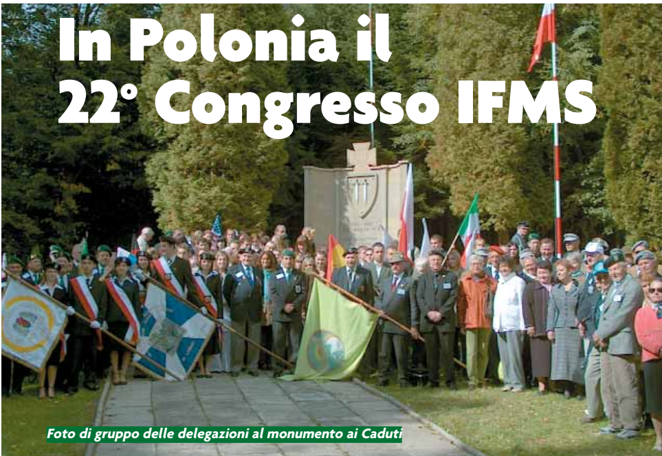
Foto di gruppo delle delegazioni al monumento ai Caduti