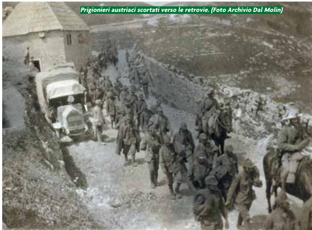
Prigionieri austriaci scortati verso le retrovie.

Non mancheranno, è pur vero, gli sbandamenti anche fra i battaglioni alpini, o chi preferirà interrompere la ritirata e fermarsi presso le proprie famiglie. Così come non mancheranno i reparti vittime della tattica austriaca dell'infiltrazione e dell'aggiramento: la maggior parte del "Vestone" cadrà prigioniera assieme al crollo dello sbarramento di San Marino, il 23 novembre in Val Brenta. Saranno però l'intervento ed il contegno del "Monte