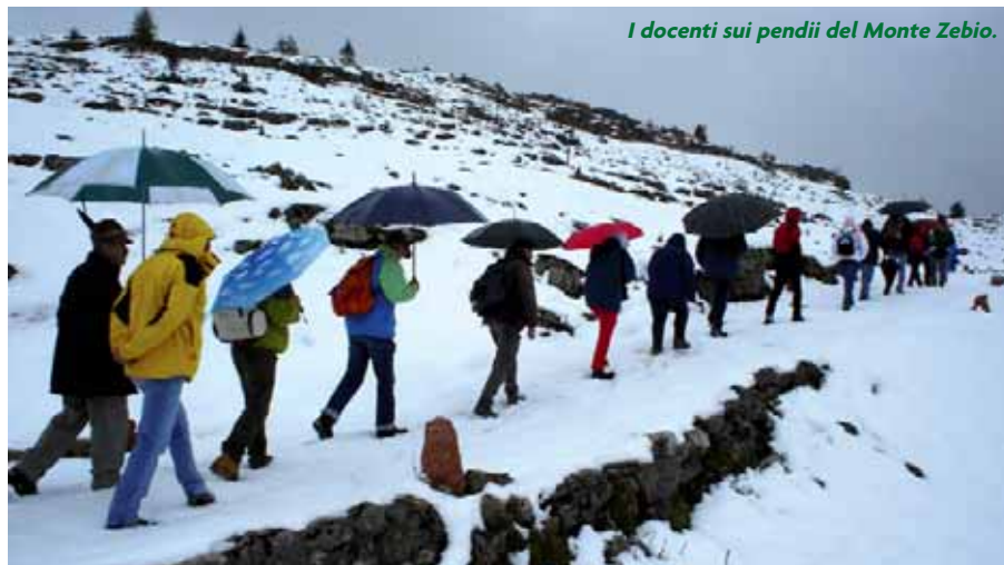
I docenti sui pendii del Monte Zebio.

Che tra gli Alpini e la gente dell'Altopiano dei Sette Comuni vi sia una fortissima vicinanza di sentimenti è non solo un dato di fatto, ma un indissolubile ed operoso legame che periodicamente genera eventi che coinvolgono anche altre realtà. La memoria storica di una collettività, di una Regione in questo caso, che si fonda su un passato che lascia in eredità tracce tanto evidenti quanto immediatamente riconducibili ad un evento storico, trova ad Asiago e sul suo intero altopiano una felice sintesi ed un emblematico modello di studio per i numerosi elementi che la compongono. Le tante battaglie combattute dai battaglioni alpini, e non solo, durante la prima guerra mondiale su queste montagne hanno lasciato in eredità memorie individuali e collettive, racconti di soldati e di civili a cui la storiografia ha attinto contribuendo a perpetuare l'evento. Segni indelebili e tangibili dell'evento, quali trincee, fortificazioni, strade, reperti bellici, simboli del ricordo, monumenti, cippi, lapidi, celebrazioni e ricorrenze, sono elementi che hanno concorso e concorrono tuttora alla costruzione della memoria della popolazione che quell'evento ha subito.