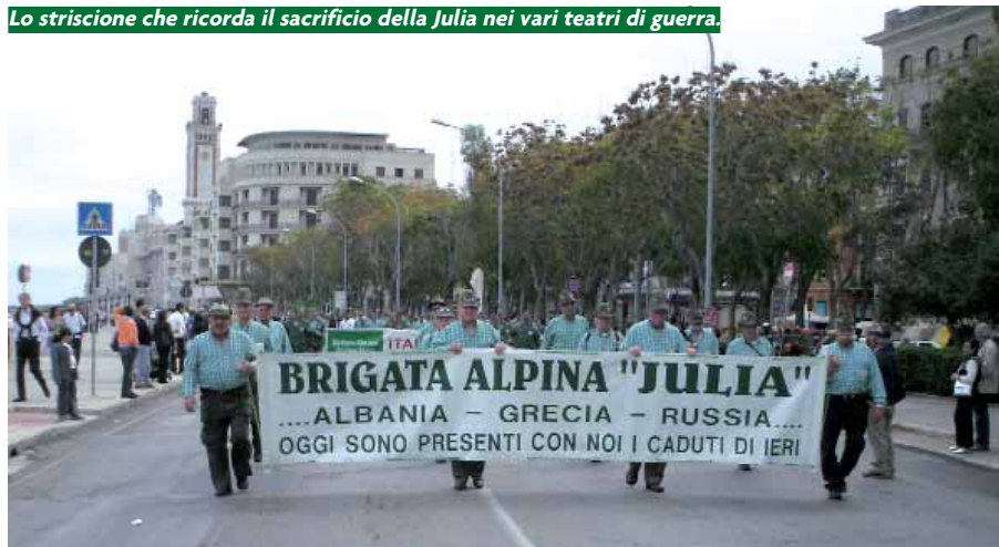
Lo striscione che ricorda il sacrificio della Julia nei vari teatri di guerra.