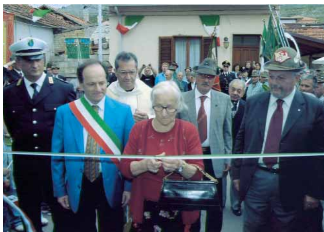
Il taglio del nastro da parte della madrina del gruppo inaugura la nuova sede.