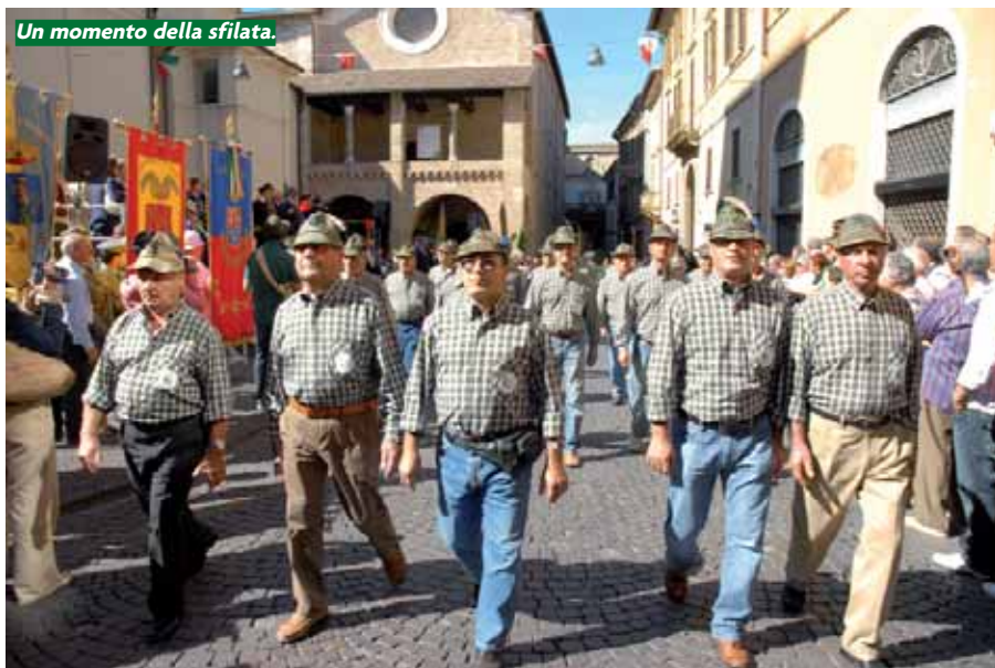
Un momento della sfilata.