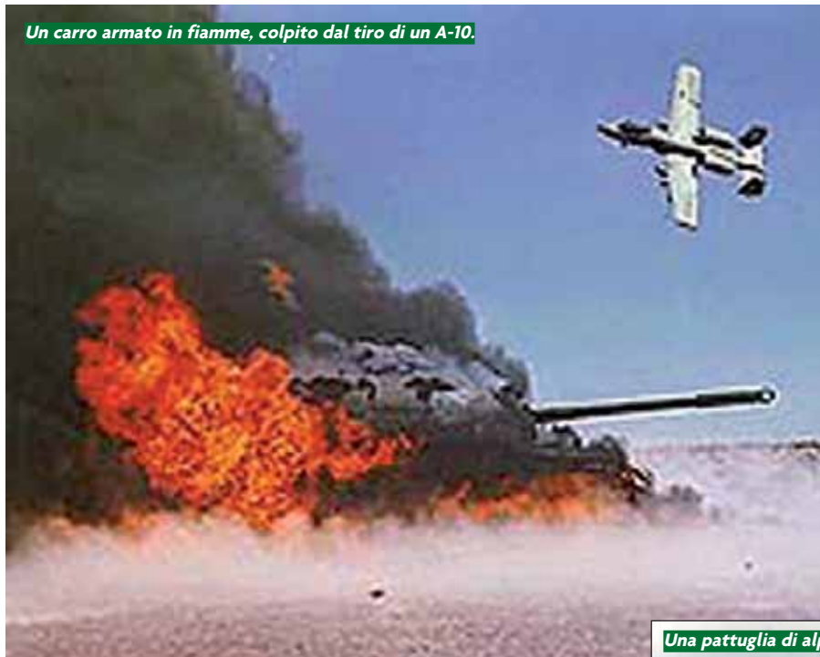
Un carro armato in fiamme, colpito dal tiro di un A-10.

Ora si sa, ufficialmente: per la “sindrome dei Balcani e del Golfo” – l'esposizione alle polveri di uranio impoverito dei proiettili anticarro sparati nei vari teatri di guerra – 37 militari italiani sono morti e attualmente 255 sono ammalati di cancro. Queste crude cifre, dietro le quali ci sono tragedie infinite di altrettanti giovani e delle loro famiglie, sono state fornite dallo stesso ministro della Difesa davanti alla Commissione d'inchiesta presieduta dalla senatrice Lidia Menapace. Parisi ha precisato che nei dieci anni intercorsi fra il 1996 e il 2006, dei 255 militari colpiti da tumore reduci dai Balcani, dal Libano, dall'Iraq e dall'Afghanistan, 161 appartengono all'Esercito, 47 alla Marina, 26 all'Aeronautica e 21 all'Arma dei Carabinieri; dei 37 deceduti, 29 erano dell'Esercito, uno dell'Aeronautica e 7 Carabinieri. Cifre che secondo le associazioni dei familiari e secondo l'Osservatorio militare sarebbero calcolate per difetto: i militari colpiti da patologie tumorali sarebbero 2.536, dei quali 164 deceduti.