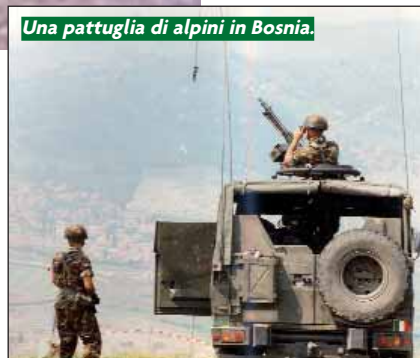
Una pattuglia di alpini in Bosnia.

Sul nostro giornale – che è l'organo della nostra Associazione – ne abbiamo parlato solo quando ci è giunta qualche lettera. La nostra posizione è sempre stata di attesa: in mancanza di una versione istituzionale non potevamo, non dovevamo