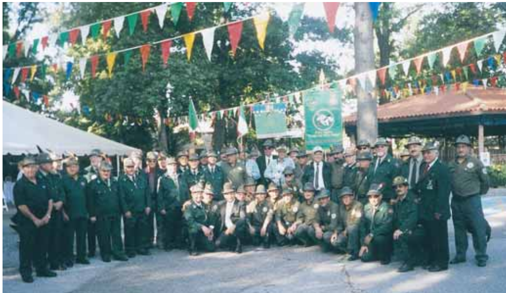
Al "Fogolar furlan", durante il congresso, il coro Stella del Gran Sasso, della Sezione Abruzzi, con alpini abruzzesi della Sezione Canada.