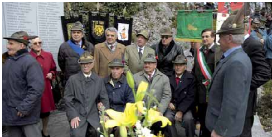
Alcuni alpini superstiti del naufragio del piroscafo Galilea che li riportava in Patria.