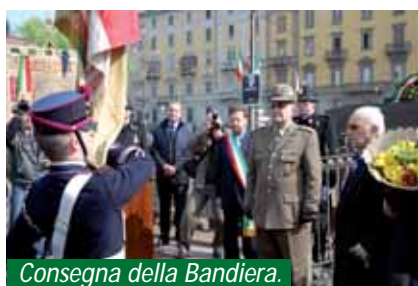
Consegna della Bandiera.