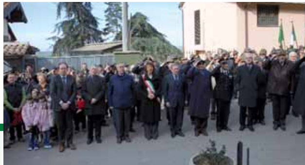
Le autorità davanti all'area del parco della Rimembranza.

provinciali e regionali. La cerimonia è iniziata con l'Alzabandiera, la resa degli onori al prefetto ed è proseguita con la sfilata per le vie del paese, preceduta dalla filarmonica Castelrossese, e la celebrazione di una Messa a suffragio degli alpini "andati avanti".