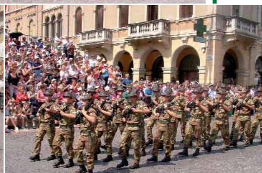
Da sinistra: sfilano i volontari della Protezione Civile, i reduci scortati dai “bocia”, e un reparto dell'8° rgt. Alpini di Cividale.

gio come Bepi De Marzi, i momenti liturgici hanno toccato il profondo dell'anima alpina. La chiesa gremita ha cantato, come ormai non capita più, Signore delle cime , Sul cappello , Sul ponte di Perati e Mira il tuo popolo . Era il popolo di Dio con il suo pastore che a pieni polmoni lodava il Signore con il trasporto del nostro sentire popolare. Momenti indimenticabili. Le sera, gran concerto in piazza Marconi da parte della Fanfara della brigata Julia.