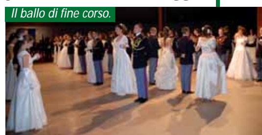
Il ballo di fine corso.

Un'identità che ci riconduce a quelle eroiche Cinque Giornate del 1848, quando il primo Tricolore, simbolo della Milano del Risorgimento, sventolò su Milano. È lo stesso che oggi è conservato al Museo del Risorgimento, a Roma, e che ogni anno, a marzo, viene tolto dalla vetrina, scortato a Milano e affidato dal Sindaco della città agli allievi della Teuliè. Per cinque giorni la storia si ricompone e il suo simbolo affidato ai giovani migliori. (g.g.b.)