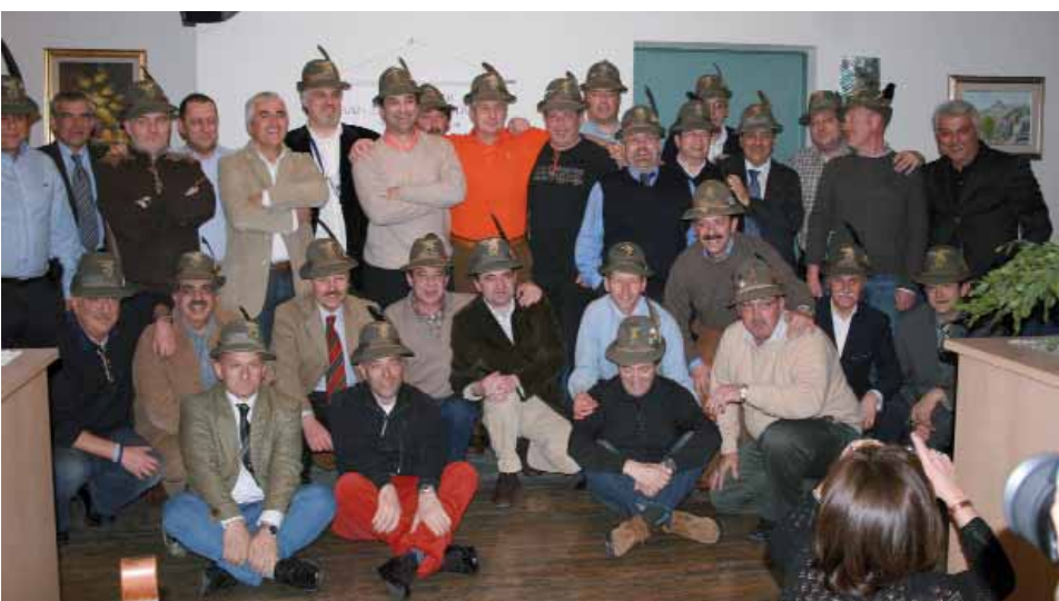
Gli AUC delle SMALP dell'86° corso si sono dati appuntamento a San Zeno di Montagna (Verona) in occasione del 30° anniversario dalla fine della naia.