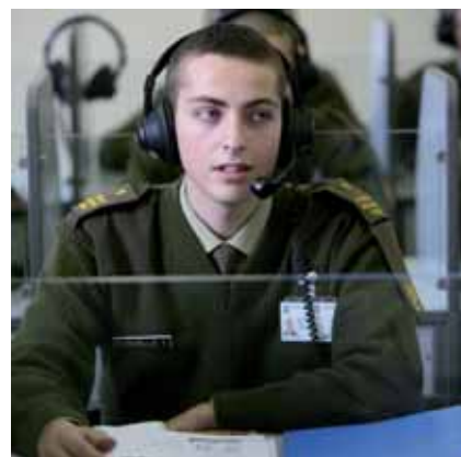
In aula, all'ora di lingua straniera.