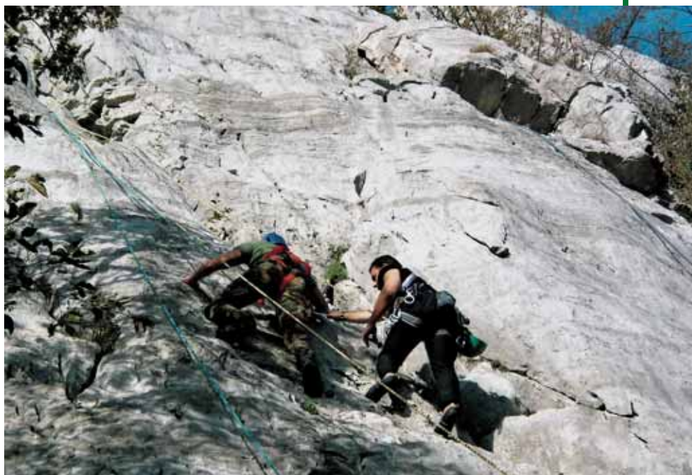
Arrampicata su una via attrezzata.

tato il cappello alpino durante la "naja", fa da legame anche durante le esercitazioni, per mantenere la forma migliore ed espletare quanto ci siamo imposti di fare.