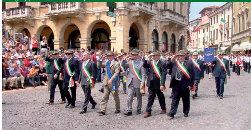
Un gruppo di sindaci con il presidente della Provincia di Vicenza.