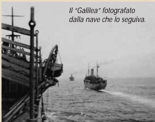
Il “Galilea” fotografato dalla nave che lo seguiva.

La sera del 28 marzo 1942 il piroscafo “Galilea” della Regia Marina, classificato come nave ospedale, stava attraversando l'Adriatico per riportare a casa il Battaglione Alpini Gemona della Divisione Julia, nonché gli ospedali da campo 629, 630, 814, l'8ª sezione sanità e l'8º nucleo assistenza. Alle 22.45 un siluro lanciato dal sommergibile inglese Protheus centra la fiancata di sinistra in corrispondenza della stiva 2. Il piroscafo si inclina di 15 gradi mentre cerca di dirigersi verso alcune isole a poche miglia di distanza. Ma la manovra però fallisce: c'è mare grosso e i danni allo scafo sono tali da non consentire la navigazione. La tragedia si sta compiendo, anche perché la nave non ha sufficienti scialuppe né giubbotti di salvataggio. Per di più, molti - sorpresi nel sonno - restano intrappolati nella stiva.