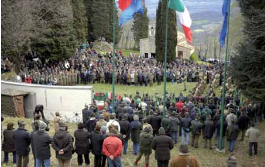
Una panoramica dello spiazzo a Muris di Ragogna durante la celebrazione della S.Messa a suffragio dei Caduti del Galilea.

mano lo spirito di Corpo, l'orgoglio dell'appartenenza alla nostra Associazione". "Guardando i reduci, i superstiti del Galilea, gli alpini in armi e in congedo, e soprattutto i giovani - ha concluso Perona - abbiamo la netta percezione che il nostro modo di intendere i valori non è cambiato e non cambierà. La nostra Associazione, forte dell'esempio di chi ha sofferto per darci un futuro di libertà, continuerà orgogliosa ad operare nel segno della solidarietà per un futuro di vera pace camminando davanti a tutti, come dice il motto del "Gemona": "Mai daur!". ●