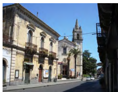
L'Etna vista dal Teatro Greco di Taormina e un panorama di Linguaglossa