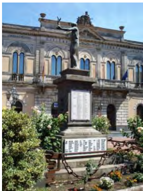
Piazza Municipio e il Monumento Caduti di Linguaglossa -

Il Corteo si snoderà lungo la Via Libertà, Via G. Garibaldi e Via Roma, il deflusso avverrà alla fine di Via T. Fazello per culminare in Piazza Tommaso D'Aquino.