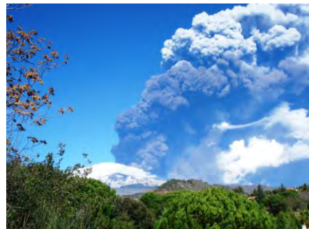
La Montagna che fuma panorama dell'Etna