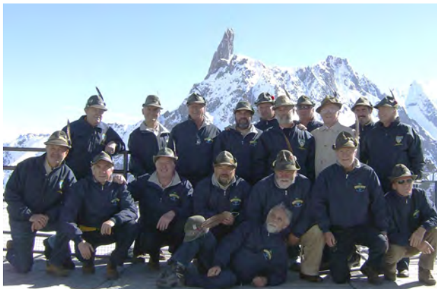
Il gruppo e il coro in gita a Punta Helbronner