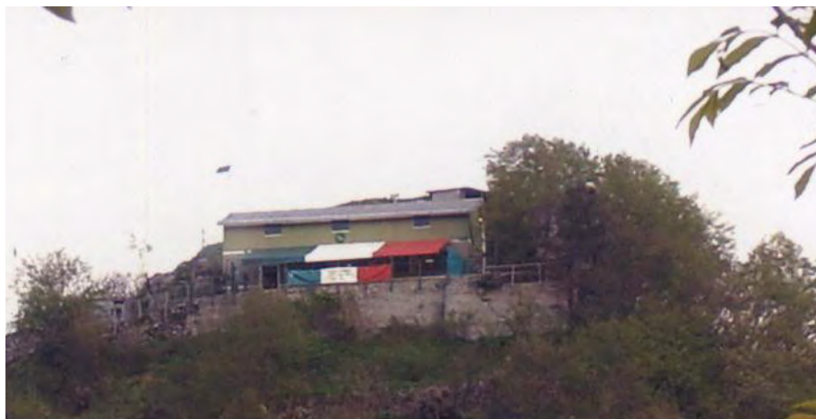
Il rifugio Margherita, del Gruppo Alpini di Rapallo, sul Monte Pegge