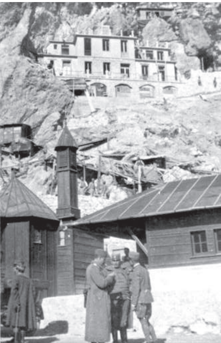
Torri del Falzarego: Baraccamenti ed Ospedale da Campo - ottobre 1916