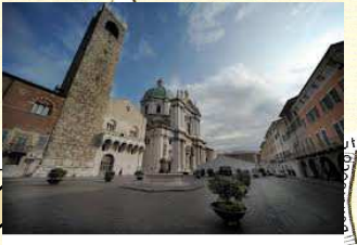
PIAZZA PAOLO VI