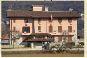
SEDE ANA BRESCIA