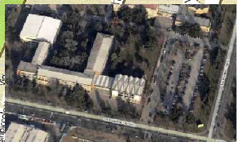
ISTITUTO N. TARTAGLIA