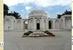
SACRARIO CIMITERO VANTINIANO