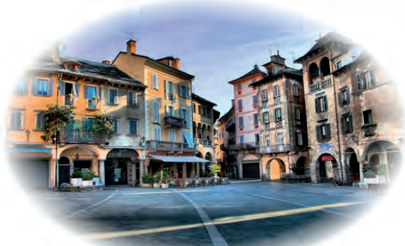
Piazza del Mercato Domodossola