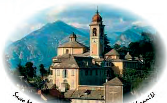
Sacco Monte Calvario Patrimonio Mondiale dell'Umanità