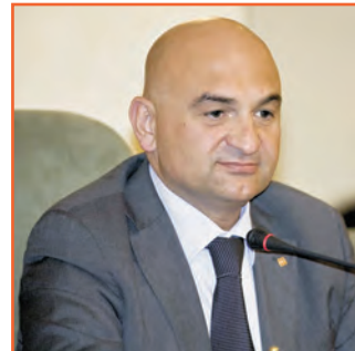
Valerio Cattaneo Presidente Consiglio regionale del Piemonte

Davvero grazie! Non tanto e non solo per questa iniziativa, ma per la vostra quotidiana disponibilità che non conosce limiti e confini e per essere sempre pronti e attenti ad intervenire in soccorso di chi ha bisogno, sul solco tracciato da coloro che "sono andati avanti"!