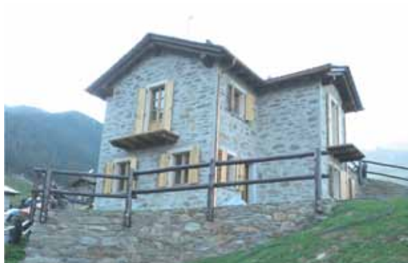
Baita in Valmalenco (2011)