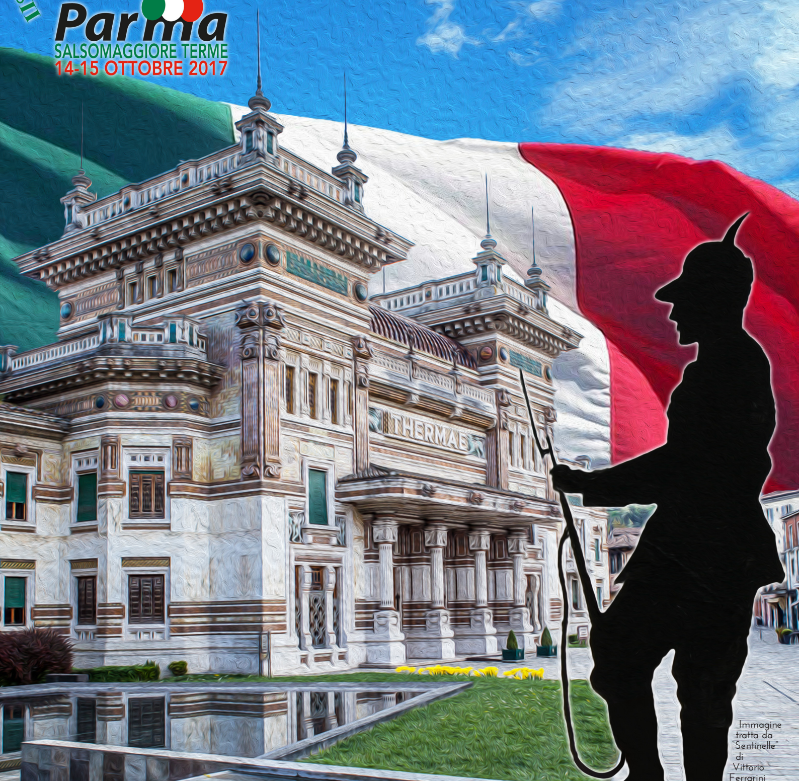
Immagine tratta da "Sentinelle" di Vittorio Ferrorini