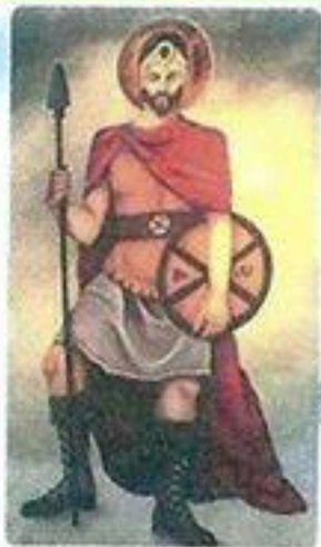
San Maurizio - Olio su tavola Scorreria Museo Biellese Degli Alpini